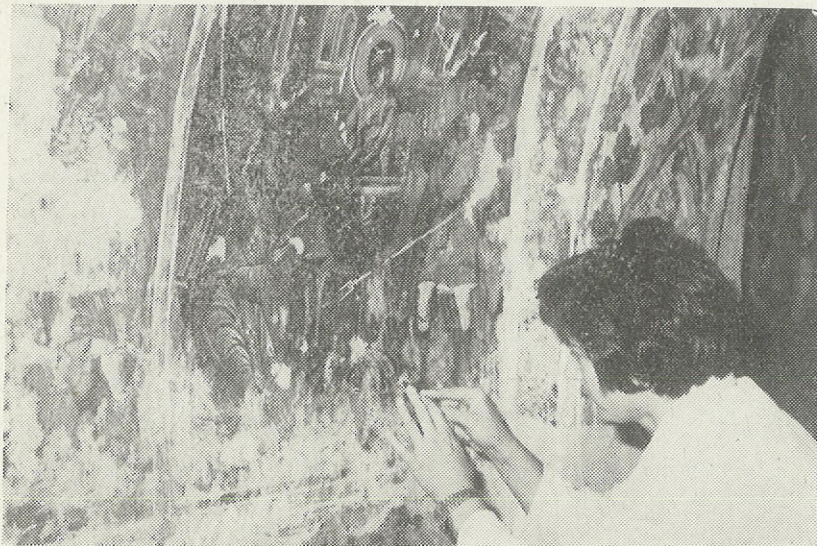
Συντηρήτρια του ύπουργείου Πολιτισμού και Έπιστημών, έργάζεται σέ τοιχογραφία του Ναού τής Παντάνασσας στό Μυστρά.

Γιά τούς παραπάνω λόγους έπιβάλλεται ν' άποτρέπονται τέτοιου είδους έπιβλαβείς έπεμβάσεις και νά ύποστηριχθοῦν οι κατά τόπους προσπάθειες για τήν αναβίωση των κλάδων τής παραδοσιακής εκκλησιαστικής μας τέχνης, δηλαδή τής άγιογραφίας, τής ξυλογλυπτικής και τής μεταλλοτεχνίας. Από τήν άλλη μεριά οι υπεύθυνοι για τήν εύπρέπεια των εκκλησιών μας, αλλά και οι πιστοί, καλό θά είναι νά εμφανίζονται περισσότερο άπαιτητικοί και έκλεκτικοί, όταν προμηθεύονται αντικείμενα και άφιερώματα, που προορίζονται για τή διακόσμηση των ιερών χώρων.