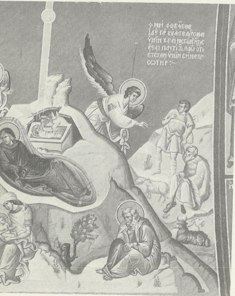
Ἐπιτομὴ τῆς Πειραιῶς. Ἔργο τοῦ συγχρόνου ἀγιογράφου Παύλου Σιδέρη.