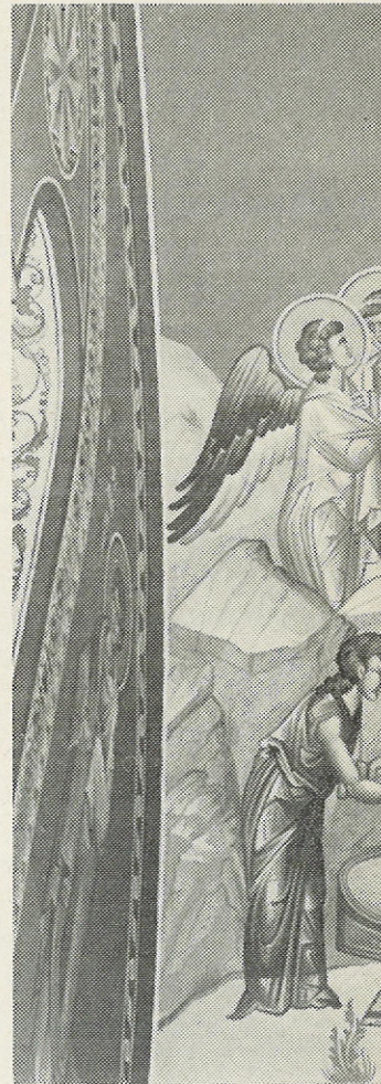
Η Γέννηση του Χριστού, στέν

πάνω από το μέρος της τροφής των. Γιατί όμως να μην είναι και ένας ώραϊος και άσύλλητος συμβολισμός! Έπιτρέπει ο άχώρητος να είναι εδώ τα άγνά αυτά ζώα δια να πάρουν μέρος στη σύνθεσι της ώραϊας και γραφικής αυτής βιβλικής εικόνας, μέσα στο σπήλαιο ένός πολέμου και μιās άναταραχής, στην καρδιά του χειμώνα. Λίγο άριστερά ένα μικρό κενό στον τοίχο (μικρό χωριάτικο ντουλάπι) νομίζει κανείς ότι είναι θαλμένο για να χρησιμοποιηθή τούτη την άγια ώρα, ως πρόθεσις. Έδώ εύτρεπίζονται τα τρία δώρα. Λίγο ψωμί κοινής στρατιωτικής κουραμάνας. Και λίγο κρασί που με προσοχή φυλάσσεται στις άπο-