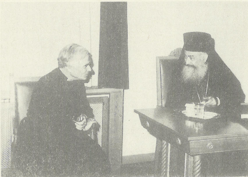
Ὁ Μακ. Ἀρχιεπίσκοπος Ἀθηνῶν κ. Σεραφεῖμ συνομιλεῖ μετὰ τὸν Ἐπίσκοπο τοῦ Ρέμπτον κ. Στέφανο ποῦ ἐπισκέφθηκε τὴν Ἑλλάδα ἐπικεφαλῆς Ἀγγλικανῶν.

Τιμὴ καὶ δόξα εἰς τοὺς ἥρωας, εἰς τοὺς αἰδιόμους Ἐθνάρχας καὶ τοὺς ὑποστηρικτὰς τῆς παιδείας, τιμὴ καὶ δόξα εἰς τοὺς γνωστοὺς καὶ εἰς τοὺς ἀφανεῖς Διδασκάλους τοῦ Γένους!