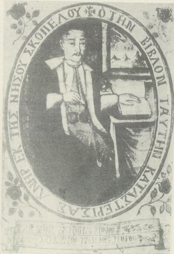
Ὁ Ἀγιορείτης βιβλιογράφος καὶ λόγιος Καϊσάρης Δαπόντες.

Βιβλιογράφοι δὲν λέγονται μόνο οἱ συντάκτες βιβλιογραφῶν (συχνὸς ὄρος), ἀλλὰ καὶ οἱ «τυπογράφοι» τῆς ἀρχαιότητος, τοῦ Βυζαντίου καὶ τῶν μεταβυζαντινῶν χρόνων. Γιατὶ πρὶν τὴν εὑρεση τῆς τυπογραφίας τὰ βιβλία ἀντιγράφονταν καὶ κυκλοφοροῦσαν κατὰ παραγγελία, ὅπως συμβαίνει στίς μέρες μας μὲ τίς χειροποίητες βυζαντινὲς εἰκόνες ἀπὸ τοὺς λεγομένους ἀντιγραφεῖς, καλλιγράφους ἢ βιβλιογράφους. Κατὰ κανόνα οἱ βιβλιογράφοι εἶχαν καὶ φιλοσοφικὰ ἐνδιαφέροντα, ἀφοῦ ἔπρεπε νὰ ἀναύρουν καὶ νὰ ἐπιλέξουν τὸ καλῦτερο πρότυπο, ἐνῶ συχνὰ ἐπέφεραν καὶ διορθώσεις ἢ ἔγραφαν σχόλια στὸ κείμενο, ἥδη ἀπὸ τὴν ἀλεξανδρινὴ ἐποχὴ. Οἱ τελευταῖοι αὗτοὶ ἀναδεικνύονταν σὲ κριτικούς ἐκδότες (βλ. σχετικὰ Κων. Ἰ. Βουρβέρη: Εἰσαγωγή εἰς τὴν ἀρχαιολογίαν καὶ τὴν κλασσικὴν φιλοσοφίαν, Ἀθήναι 1967. Γ. Ἰ. Κουρμούλη: Ἡ ἑλληνικὴ γλῶσσα, πανεπιστημιακαὶ σημειώσεις. Ν. Β. Τωμαδάκη: Κλείς τῆς Βυζαντινῆς Φιλολογίας, τρίτη ἐκδοσις, Ἀθήναι 1965).