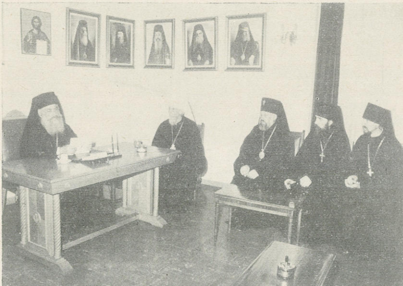
Ὁ Μακ. Ἀρχιεπίσκοπος Ἀθηνῶν κ. Σεραφεὶμ δέχθηκε στὸ Γραφεῖο του ἐπίσκεψη ἀντιπροσωπείας τῆς Ρωσικῆς Ὁρθοδόξου Ἐκκλησίας, μὲ ἐπικεφαλὴς τὸν Σεβ. Μητροπολίτη Λένινγκραντ κ. Ἀντόνιο.