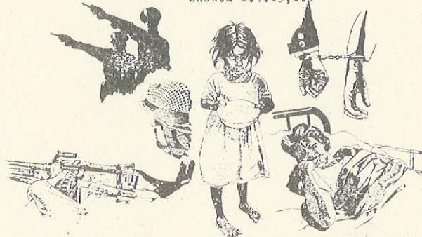
Σκοπιά I.4.69, σ.3

Η απόκρισι των αληθινών τους προθέσεων θα διαρκέσει ώσπου να τεθή το υποψήφιο θύμα κάτω από τον ψυχολογικό έλεγχο της εταιρίας, όποτε η λειτουργία