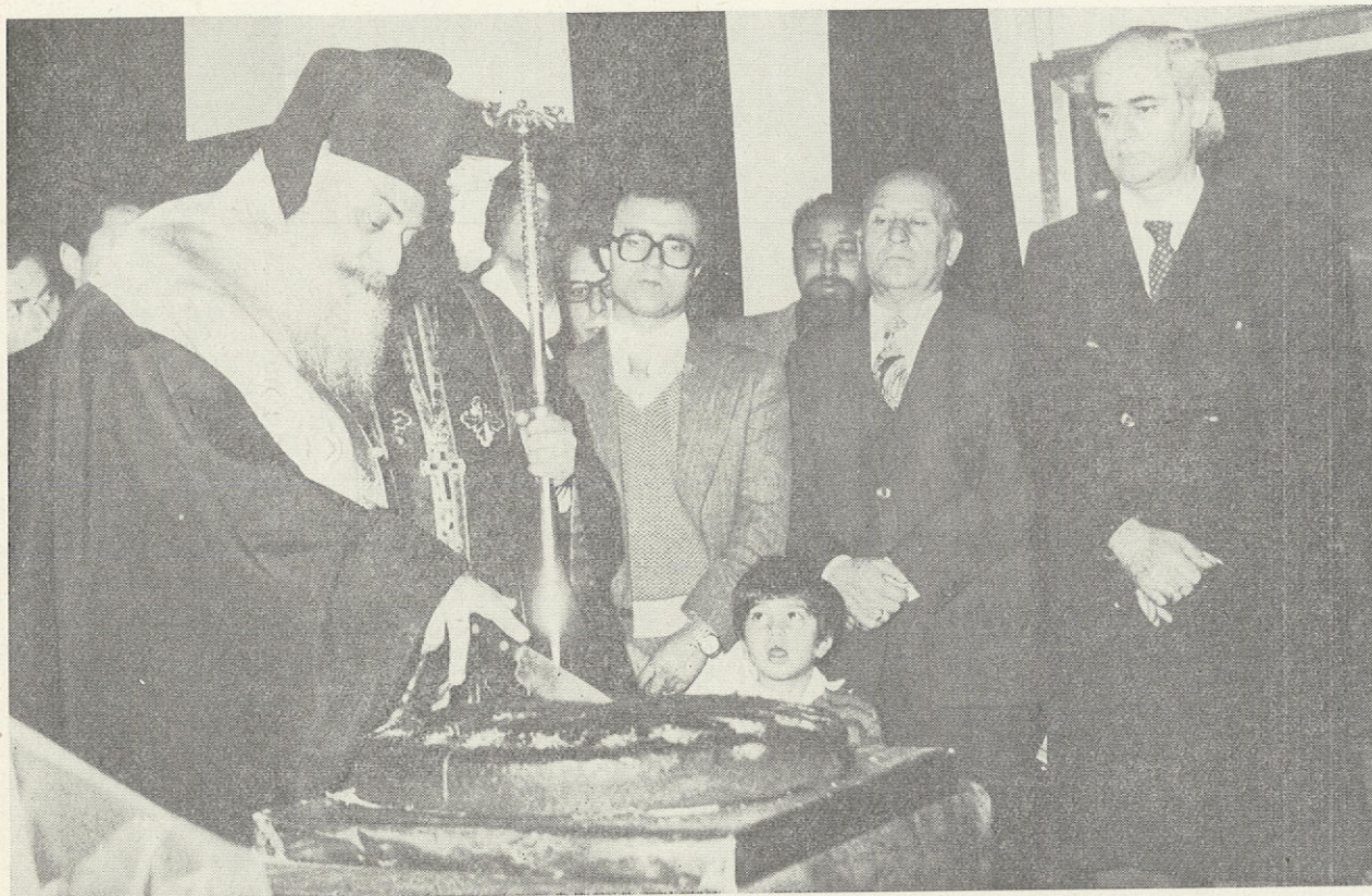
Ο Μακ. Ἀθηνῶν κ. Σεραφεὶμ κόβει τὴν Ἀγιοβασιλόπιττα στὴν Ἱ. Ἀρχιεπισκοπῇ. Δεξιὰ ὁ ὑπουργὸς Ἐθνικῆς Παιδείας καὶ Θρησκευμάτων κ. Ἀπόστολος Κακλαμάνης.