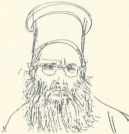
Σκίτσο Άλτα Άννα Πάρκινς.

Ο ιερεύς, είναι εκείνος ο όποιος, μαζί μέ τα δικά του τα προσωπικά προβλήματα πού άφορούν στην οικογένειά του, στην πρεσβυτέρα, στα παιδιά, στη μόρφωση και τήν άποκατάστασή τους, έχει νά παλαίψει: μέ χίλια δυό άλλα ζητήματα, οικονομικά, διαχειριστικά, κοινοτικά, πολιτικά, πολιτιστικά και μέσφ όλων αυτών νά καθοδηγήσει, νά διαφωτίσει και νά ποιμάγει τον Λαό του Θεού στους δύσκολους αυτούς καιρούς πού ζούμε.