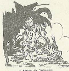
Η Κόληση των Ναρκωτικών

Πολλές Ι. Μητροπόλεις αναλαμβάνουν άγώνα για την καταπολέμησή τους. Πρέπει να μνημονεύσουμε την έβδομάδα καταπολεμήσεως ναρκωτικών, 2 με 9 Νοεμβρίου 1975, που είχε όργανώσει ή Ι. Μητρόπολις Νικαίας, συνεχίζουσα έκτοτε την προσπάθεια με ειδικές εκδηλώσεις και εκδόσεις. Ακόμα, ή Ι. Μητρόπολις Θεσσαλονίκης, έδώ κι ένα χρόνο, κήρυξε έναρξη άγώνα κατά της