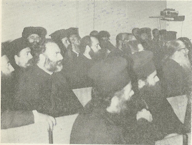
Υπεύθυνη επιμόρφωση των ιερέων μας.

Η διυπουργική επιτροπή, που συγκροτείται τον Ιανουάριο του 1983, θα παίξει το ρόλο του κύριου συντονιστή αυτής της προσπάθειας. Σ' αυτήν συμμετέχουν οι ύπουργοι Παιδείας, Δικαιοσύνης, Υγείας