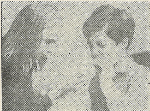
Τὸ πρῶτο δῆμα... («Ἀπογευματινὴ» 28 Ἀπριλίου 1983).

Τὸ πρόβλημα τῶν ναρκωτικῶν, οὐσιῶν, δηλαδή, πού προκαλοῦν ἐθισμό, φαίνεται ὅτι ἔχει πάρει ἀνησυχητικὲς διαστάσεις στὴ χώρα μας. Σύμφωνα μὲ τις ἐφημερίδες,