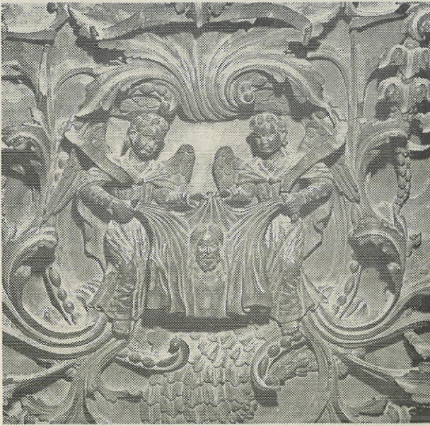
ΜΗΧΑΝΟΓΡΑΦΗ ΔΙΑΚΟΝΙΑ ΤΗΣ ΕΚΚΛΗΣΙΑΣ ΤΗΣ ΓΑΛΛΙΑΣ

Είναι ιστορική απαίτηση, όχι μόνο για τον Έλληνα και την Όρθοδοξία, αλλά και για ολόκληρη τη χριστιανότητα, να καταμετρηθούν κάποτε, να καταγραφούν και να διασωθούν από τη θάλασσα του αφανισμού οι καλλιτεχνικοί θησαυροί της Έκκλησίας.