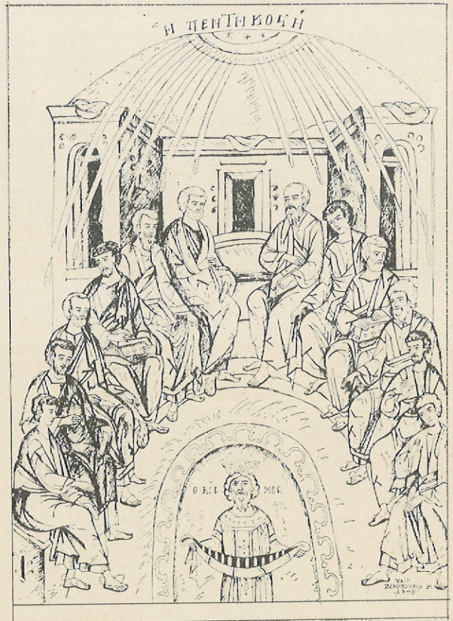
Έργο τοῦ Κ. Ξενόπουλου, ἀπὸ τὴν έκθεση Ἀγιογραφίας Ἱεροσπουδαστῶν τῆς Ἀθωνιάδος Ἀκαδημίας.

Οἱ συνεργάτες τῆς Έκκλησίας πρέπει να «ἐξασκήσουν τὴν θρασί τους», ὥστε να δοῦν γύρω τους τὰ προβλήματα αὐτά, να τὰ ἐντάξουν στο ὅλο ποιμαντικό έργο τους και ιδιαίτερα στο κοινωνικό και να φροντίσουν να τὰ θεραπεύσουν, ἀφοῦ δέν κατώρθωσαν να δράσουν προληπτικά και να ἐμποδίσουν τὴ δημιουργία τους.