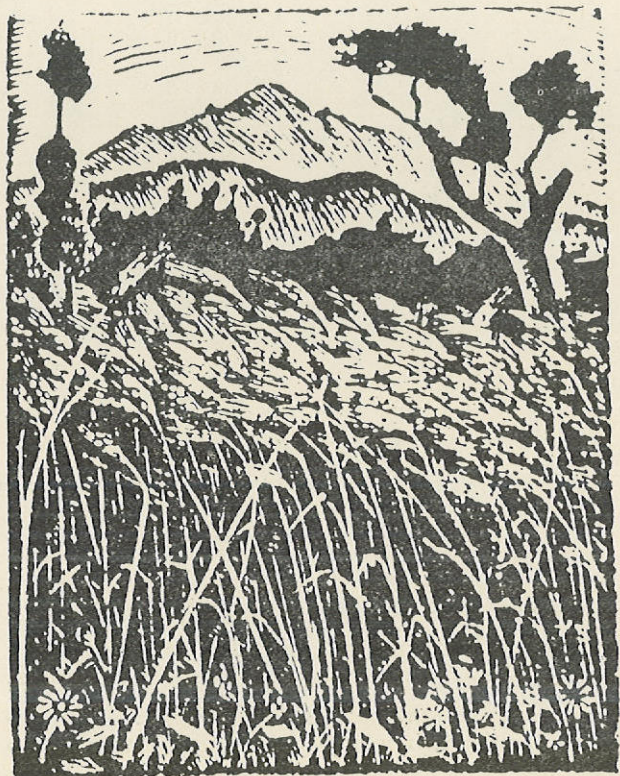
Γ. Μόσχου, «Στάχια», 1936.

τὰ σκοινιά καὶ οἱ λαϊμαριές τοὺς εἶχαν ἀνοίξει: πληγές, τὰ ρούχα τους ἦτανε γινομένα κουρέλια... Μιὰ Κυριακὴ ἦρθαν στὴν ἐκκλησία καὶ λειτουργήθηκαν, ἀνησπᾶστηκαν τὶς εἰκόνας καὶ κοινωνήσαν, τοὺς βλέπαμε ποὺ ἔκλαιγαν».