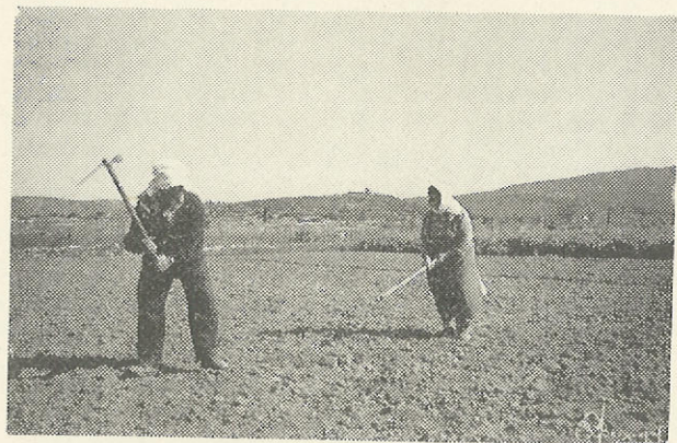
Δοκίμασαν ὕστερα νὰ συνεχίσουν τ' ὄργωμα μὲ τ' ἀξίνια, μὰ δὲ γινόταν.

Μιά μέρα, ἐκεῖ πού ὄργωναν, τ' ἄλογο χτύπησε τὸ ποδάρι του σὲ μιὰ κρυφὴ πέτρα, πληγώθηκε ἄσχημα. Φώναξαν τὸν ἀλμπάνη νὰ τὸ κοιτάξει, καὶ κείνος τοὺς εἶπε ὅτι ἔπρεπε νὰ περάσει μὴνας κι ὕστερα τὸ ζωντανὸ νὰ ξαναπιάσει μεροκάματο. Λυπήθηκαν τ' ἄλογο, λυπή- θηκαν τὸν κόπο τους, ἀλλὰ ἀκόμα πιὸ πολὺ γιὰ τὸ μισο- σκαμμένο χωράφι: καὶ γιὰ τὰ δυὸ τσουβάλια σπόρο πού ἔχαν ἀγορασμένο μὲ χίλιες στερήσεις. Πῆγαν νὰ δανειστοῦν ἄλογο, μὰ κανεὶς δὲν τοὺς ἔδινε· λίγα τὰ ζωντανὰ πού ἔχαν ἀπομείνει: στὸ χωριό, καιρὸς τῆς σπορᾶς, ὁ κάθε ἄνθρωπος κοίταξε τίς δικές του ἀνάγκες κι ὄχι: τίς ξένες. Δοκίμασαν ὕστερα νὰ συνεχίσουν τ' ὄργωμα μὲ τ' ἀξίνια, μὰ δὲ γινόταν· τὸ σκάψιμο δὲν ἦταν βαθὺ καὶ ἡ δουλειὰ δὲν προχώραγε γρήγορα. Ἀπελπίστηκαν, πῆγαν καὶ κά- θισαν σὲ μιὰν ἄκρη τοῦ χωραφιοῦ μὲ τὴ συφορὰ στήν καρδιά τους, ἔτοιμοι νὰ λυγίσουν, νὰ τὰ παρατήσουν, νὰ πᾶνε καὶ νὰ γυρέψουν δουλειὰ καὶ φαῖ στὸς μεγαλοκτη- ματίες, στοὺς πλοῦσιους.