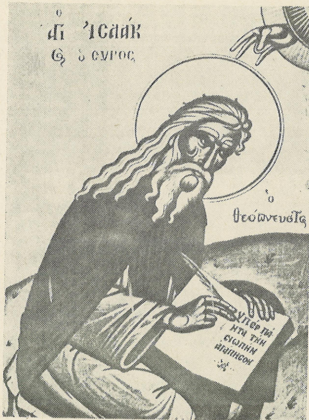
Ἀββᾶς Ἰσαάκ ὁ Σῦρος. Χεῖρ Β. Λέπουρα*.

Σὲ προηγούμενο σημείωμά μας ἀναφερθήκαμε σὲ ἐπιστράτευση δυνάμεων ποὺ θὰ τελεσφορήσουν στὴ στοιχειοθέτηση ἀπὸ μέρους μας τῆς «στάσεως φιλοξενίας», ἔκφραση καὶ καρπὸ τῶν στάσεων ὑποδοχῆς καὶ ἀγάπης. Λέγαμε μάλιστα ὅτι οἱ στάσεις αὐτὲς ἀπαιτοῦν μὴ ἐξ ἀσκησῆς ὑπὸ ἐπίβλεψη ἢ ἐποπτεία γιὰ νὰ εἶναι ἐγγυημένη ἢ ὀρθὴ ἀσκήση καὶ ἐφαρμογὴ τους. Αὐτὴ πάλι: ἢ