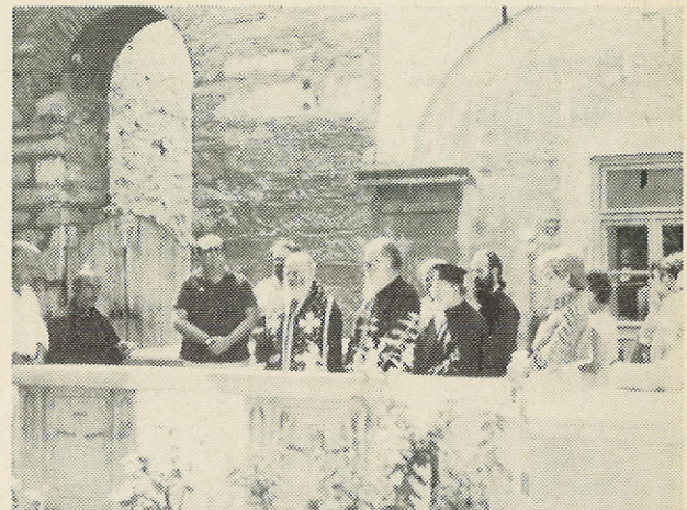
Τρισάγιο στὸν τάφο τοῦ Πατριάρχου Ἀθηναγόρα στὸ Μπαλουκλή.

πλοῦτο, πὺ σῶζεται: στὴν Πόλη καὶ στὴ μικρασιατικὴ γῆ... Ἡ διτρίνα τοῦ ἀεροδρόμιου εἶναι πραγματικά ἐντυπωσιακὴ. Ἴσως νομίσαις ὅτι προσγειώθηκες σὲ μιὰ πρωτεύουσα τῆς Εὐρώπης. Ὁ ἔλεγχος στὰ διαβατήρια γίνεται μὲ κομπιούτερς, οἱ ἀποσκευὲς μεταφέρονται αὐτοματοποιημένα, χωρὶς ἀνθρώπινα χέρια, ἡ καθαριότητα εἶναι ὑποδειγματικὴ. Τὸ ἴδιο καὶ στὰ μεγάλα ξενοδοχεῖα τῆς Πόλης. Ἐξυπηρέτηση, ὑπερσύγχρονες ἀνάσεις, εὐρωπαϊκὸ ἐπίπεδο. Μὰ μὴ διαστεις, ἀγαπητὲ ἀναγνώστη, νὰ θγάλεις τὰ συμπεράσματά σου. Ἄν ἐξαιρέσεις κάποια ἀκόμη πολυσύχναστα μέρη, τοὺς χώρους πὺ ἐξυπηρετοῦν τὸν τουρισμὸ, τὰ προάστια, τὴς γειτονιὲς τῶν ἀξιωματικῶν, ἡ Ἀνατολὴ μὲ τὴν πρὸ ὀδυνηρὴ μορφή της σὲ καραδοκεῖ παντοῦ. Μὰ πρὸ πολλὸ σὺ ἄλλοτε ἀρχοντικό Φανάρι. Φτώχεια, ἐγκατάλειψη, κακομοιριά, θρώμικα σοκάκια, χαμοκέλλες, ρημαγμένα ρωμαίικα ἀρχοντόσπιτα. Εἰκόνες γνώριμες ἀπ' τὸ Κάιρο, τὴν Ἀλεξάνδρεια, τὸ Δελχί. «Στὴν Τουρκία, θὰ σοῦ πει ὁ ὁμογενὴς ξεναγός, δὲν ὑπάρχει: μεσαία τάξη. Ὑπάρχουν μόνο πλοῦσοι: καὶ φτωχοί...».