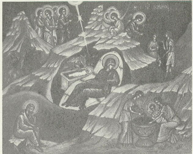
«Ότι έτέχθη ύμιν σήμερα σωτήρ».

συμφώνησαν οι συνέδριοι να προωθήσει ή έκλεγεσία έκτελεστική έπιτροπή, ή όποια και θα ένημερώσει: υπεύθυνα σε συνεργασία με τη συγγογιστική έπιτροπή του συνεδρίου τις Έκκλησίες Έλλάδος, Κύπρου, Κρήτης και το Οικουμενικό Πατριαρχείο, και θα ζητήσει να εύλογήσουν την όλη προσπάθεια επ' άγαθό της Εκκλησίας, όπως σημειωνόταν στο δελτίο τύπου που κυκλοφόρησε άναφορικά με την πρόσδο των έργων του Συνεδρίου.