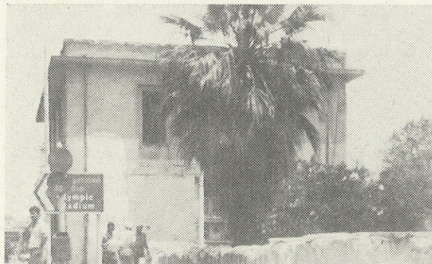
Τὸ παλιὸ κτίριο τοῦ Κ.Ρ.Σ.Ε.Δ.Ε. (EPT 2)

«Κάτι: ποὺ δὲν γράφτηκε εἶναι: σὰν γὰ μὴ συνέδρη». Κι: ἐπειδὴ αὐτὰ ποὺ συμβαίνουν στὴν Ἐκκλησία εἶναι ἀνάγκη νὰ μαθαίνονται: γὰ νὰ ἐδραιώνουν κάποια πα-ράδοση και στὸ χῶρο αὐτό, τὸν ἐρτζιανὸ, εἶναι: περισσό-τερο ἀπὸ ἀπαραίτητο γὰ καταχωροῦνται: γὰ τὸν ἐντοπι-σμὸ τῶν λαθῶν και τὸ προχώρημα στὸ μέλλον.