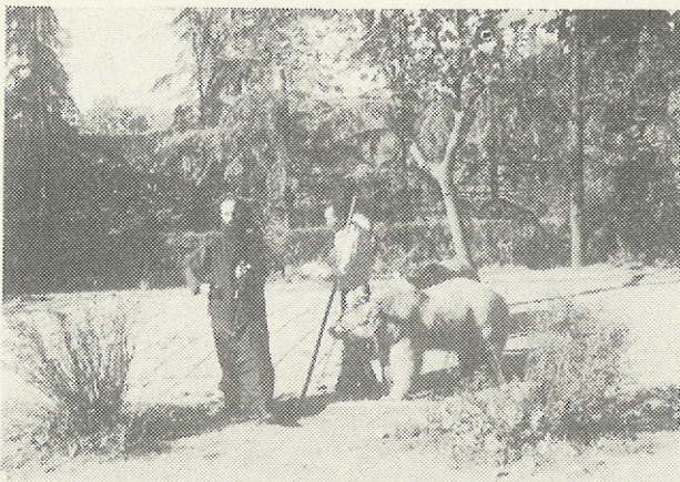
Ὁ ἀρκουδιάρης μὲ τὰ ζῶα του μαζί μ' ἓναν Ὁρθόδοξο κληρικό. Τὸ στιγμιότυπο σὲ φέρνει πίσω στὸ Βυζάντιο.

Ἡ ἐκκίνηση δυστυχῶς ἀπὸ τὸ ξενοδοχεῖο συναρτημένη ἀναγκαστικὰ μὲ τὸ ὀργανωμένο πρόγραμμα σοῦ στερεῖ ἓνα σημαντικὸ μέρος ἀπὸ τὸν Ὁρθρο, ποῦ εἶναι μέσα στὸν ἱστορικὸ πατριαρχικὸ Ναὸ μιὰ καλλιτεχνικὴ