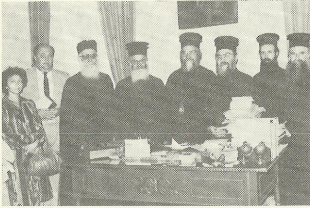
Ἀπὸ ἐπίσκεψη ὑπαλλήλων τῆς Ἱερᾶς Συνόδου στὸ Πατριαρχεῖο μὲ τὸν Παναγ. Οἰκουμηνικὸ Πατριάρχη κ. Δημήτριο. Ἐπικεφαλῆς τῶν ἐπισκεπτῶν ὁ Σεβ. Κιλκιστοῦ κ. Ἀμβρόσιος

Στὸ ἱστορικὸ καὶ πολύπαδο Φανάρι χιτυπάει ἡ καρδιά τῆς Ρωμοσύνης