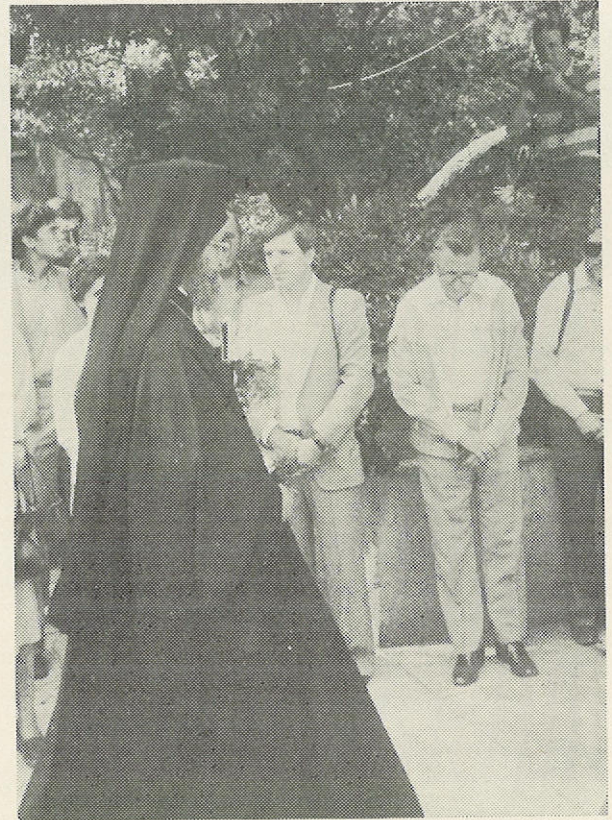
Ὁ Παναγιώτατος Οἰκουμηνικός μας Πατριάρχης ἐξέρχεται ἀπὸ τὸν Ναό.

Τὶ ἀνείπωτη χαρὰ εἶναι αὕτη. Νὰ δεῖς τὸν Πανα-