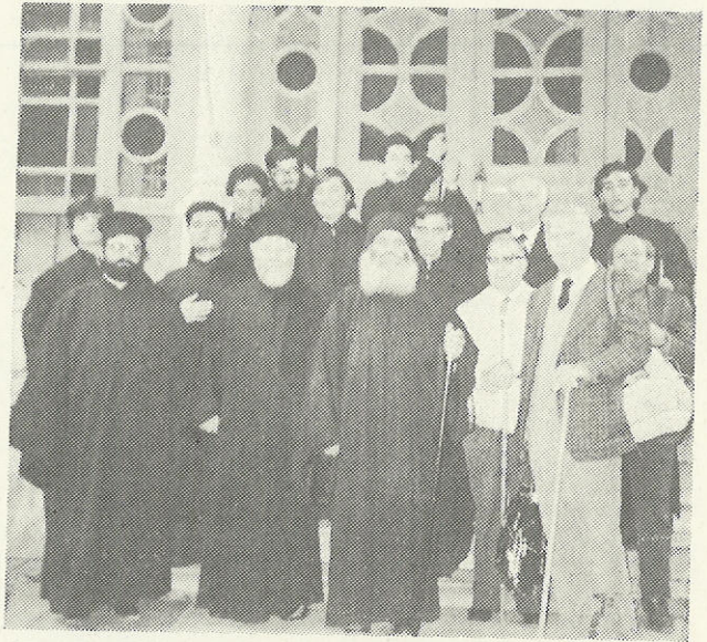
Οἱ ἐκδρομεῖς πρὸ τοῦ Καθολικοῦ τῆς Ἱ. Μονῆς Ἁγίου Παύλου.