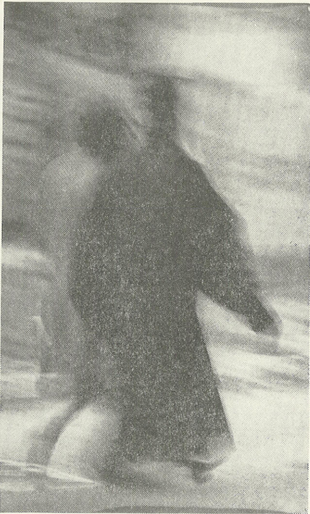
Πρεσβύτερος - Πρεσβυτέρα: Κοινὴ κλήση, κοινὴ πορεία, σὲ ἐποχὲς μετασχηματισμῶν...

Φαίνεται ὅτι δίπλα στὶς ἱερατικὲς κλήσεις ἐξίσου σημαντικὴ εἶναι καὶ ἡ κλήση τῆς πρεσβυτέρας.