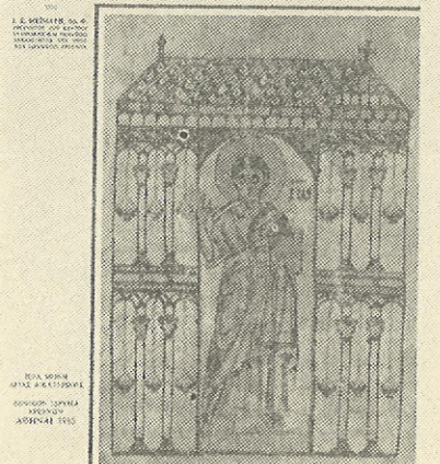
ΚΑΤΑΛΟΓΟΣ ΤΩΝ ΝΕΩΝ ΑΡΑΒΙΚΩΝ ΧΕΙΡΟΓΡΑΦΩΝ ΤΗΣ ΙΕΡΑΣ ΜΟΝΗΣ ΑΓΙΑΣ ΑΙΚΑΤΕΡΙΝΗΣ ΤΟΥ ΟΡΟΥΣ ΣΙΝΑ

Τὸ ἔργο δίνει ἔτσι μιὰ σφαιρικὴ ὄψη μὲ στοιχεῖα ἀφθονα, κρίσεις καὶ ἀπόψεις, τὰ ὁποῖα κατευθύνουν σωστὰ τὸν πραγματικὸ ἢ νοερὸ προσκυνητὴ τοῦ Ἁγίου Ὁρους σ' ὄλη τὴ ζωὴ καὶ ἱστορικὴ κίνηση τοῦ Ἁθῶ. Εἶναι ἓνα ἔργο δηλ. τοῦ ὁποῖου ἡ ὑπευθυνότητα καὶ ἡ αὐθεντικότητα ὑπηρετοῦν ἀληθινὰ στὴν προσέγγιση καὶ στὴν κατανόηση τῆς μοναστικῆς πολιτείας πὸν στίς μέρες μας εἶναι ὁ τηλαυγὴς φάρος ζωῆς, ὀρθοδοξίας καὶ σωτηρίας. Φς.