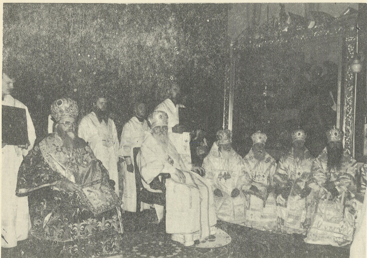
Ἡ Α.Θ.Π. ὁ Οἰκουμ. Πατριάρχης κ.κ. Δημήτριος μετὰ τῆς Α.Θ.Μ. τοῦ Πατριάρχου Μόσχας κ. Ποιμένος.

ΑΠΟ ΤΗΝ ΙΕΡΑΝ ΠΟΡΕΙΑΝ ΤΗΣ Α.Θ.Π. ΤΟΥ ΟΙΚΟΥΜΕΝΙΚΟΥ ΠΑΤΡΙΑΡΧΟΥ