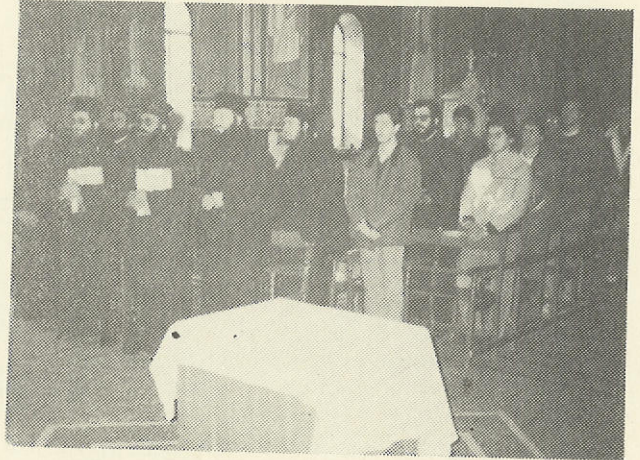
Στὴν Ἐνορία τοῦ Ἁγίου Γερασίμου Ἰλισίων.

λειτουργῶν αὐτῶν πρὸς καταρτισμὸ καὶ συνειδητὴ συμμετοχὴ σὲ αὐτὰ τῶν χριστιανῶν. Ἡ ἔλλειψη αὐτῆς ἔχει σὰν συνέπεια καὶ τὴν δημιουργία ἀταξίας κατὰ τὴν τέλεσή τους ὅπως ἡ παρατηρούμενη κατὰ τὴν ἀνάγνωση τῆς «ἐπιμάχου» ἀποστολικῆς ρήσεως «ἡ δὲ γυνὴ ἵνα φοβῆται τὸν ἄνδρα», στὴν ἀκολουθία τοῦ γάμου.