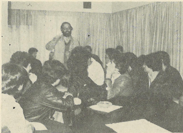
Στὸ «Σπίτι τοῦ παιδιοῦ» (Κυψέλη).

Αὐτὸ τὸ τονίζουν ἰδιαίτερα ἐκεῖνοι ποὺ δὲν ἀρκοῦνται σὲ μιὰ ἀπλὴ συμμετοχὴ σὲ τρεῖς ἢ τέσσερις ποιμαντικὲς ἐπισκέψεις στὴ διάρκεια τοῦ ἑξαμήνου ἀλλὰ ἐξακολουθοῦν ἐπὶ πολλὰς ἐβδομάδες, μῆνες καὶ χρόνια γὰ ἐπισκέπτονται ἐνεργητικὰ πιά τὰ ἱδρύματα ἐκεῖνα μὲ τὰ ὁποῖα τὸ ἐκπαιδευτικὸ πρόγραμμα τοὺς ἔφερε σὲ πρώτη ἐπαφὴ.