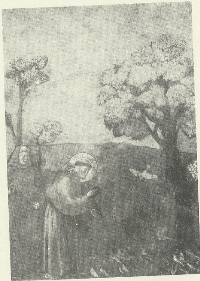
Τò κήρυγμα στά πουλιά (Giotto)

Τò χάος, ὅμως, δέν εἶναι μόνο ὑπόθεση ἱστορικῶν ἐποχῶν, τοῦ χτέος καί τοῦ σήμερα. Παρεμβαίνει στήν προσωπική μας ἱστορία καί ἀναζητᾶμε τρόπο νά τò ἀντιμετωπίσουμε δημιουργικά. Μία προσωπική προσέγγιση καθίστατο ἀναγκαία. Προσκήθηκε, λοιπόν, ὁ συντάκτης τοῦ παρόντος ἀρθρου γιά ν' ἀναπτύξει μέ ποιὰ ἀπροσωπικά καί πνευματικά μέσα μπορεῖ νά γίνει ἡ δημιουργική ἀντιμετώπιση τοῦ χάους. «Ἡ ὀργανωτική ἐπιτροπή τῆς συσκέψεως ἐπειδή πίστευε ὅτι ἡ ποιμαντική καί πνευματική παράδοση τῶν Ὁρθοδόξων Ἐκκλησιῶν ἔχει πολλὰ νά συνεισφέρει στό μεῖζον αὐτό θέμα ἔκρινε ἀπαραίτητη