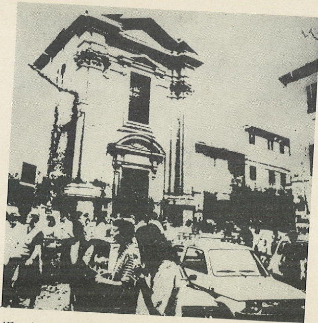
«Εν ειρήνῃ προέλθετε». Κυριακή πρωί μετά τὴν ἀπόλυση. Ἀπὸ τὸ ἐξώφυλλο τοῦ τεύχους τοῦ Φεβρουαρίου 1989 τῶν «Letters from S. Egidio».

τιτλος τῆς εἰσηγήσεώς μου ἦταν: Ἀπὸ τὸ χάος στὸ πρόσωπο ἐν Ἁγίῳ Πνεύματι.