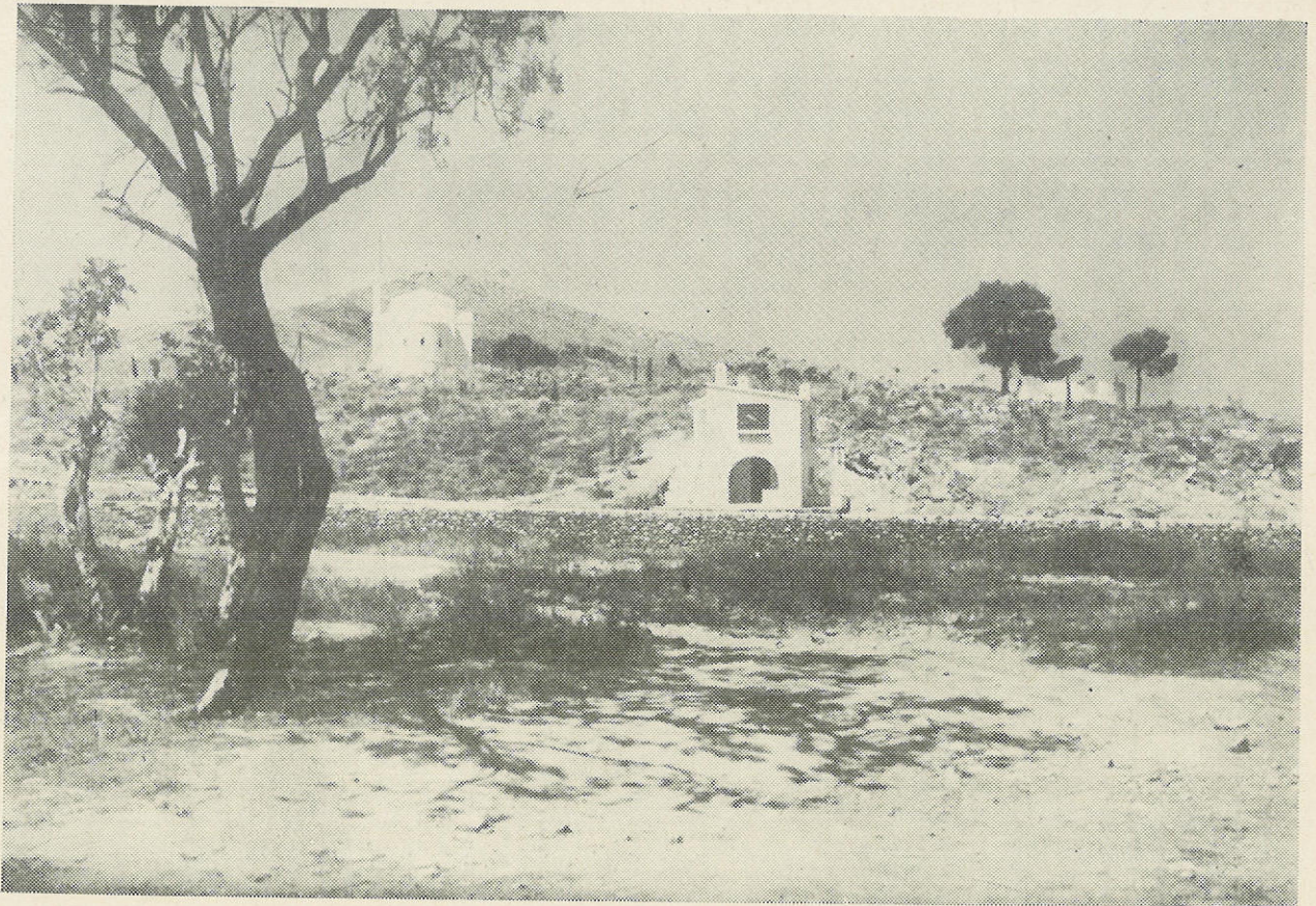
Ὁ πρῶτος ναῦσκος τῆς ἁγίας Φιλοθέης στὸ ὁμώνυμο προάστιο τῆς Ἀθῆνας.