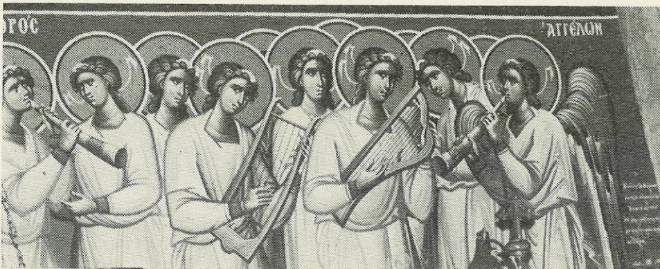
Μέρος τῆς πρωτότυπης παράστασης τοῦ χοροῦ τῶν Ἀγγέλων στὸν ἱερὸ ναὸ Τιμίου Σταυροῦ Χολαργοῦ - Παπάγου