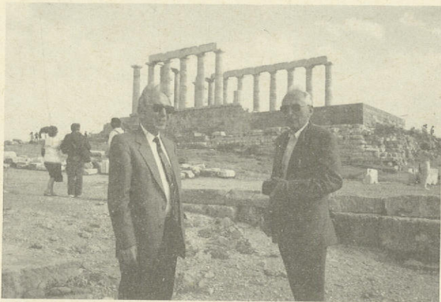
Τὸ τέλος τοῦ ταξιδιοῦ. «Ὡ ξεῖν...»!

Φεύγοντας πρέπει νὰ εἶχε τὸ συναίσθημα ὅτι οἱ Ἕλληνες ποὺ τὸν ὑποδέχτηκαν «τοῦ ἄνοιξαν νὰ ξαναδεῖ σὲ τὶ μεριὲς μεγάλωσε...» 2 , σ' αὐτὸν ποὺ ἀνατράφηκε μὲ τὴν Καινὴ Διαθήκη καὶ τοὺς Ἀρχαίους. Ἐμεῖς θέλουμε νὰ τὸν διαβεβαιώσουμε ὅτι τὸν νιώθουμε δικό μας κι ὄχι ξένο. Παρ' ὅλ' αὐτὰ θὰ ἀπευθυνθοῦμε σ' αὐτὸν μὲ τὸ γνωστὸ «ὦ ξεῖν», καὶ θὰ τὸν παρακαλέσουμε ν' ἀναγγεῖλει στοὺς συμπατριῶτες του Εὐρωπαίους, ὅτι ἡ Ἑλλάδα —καὶ ἡ Ὀρθοδοξία— «οὔτε λέγει οὔτε κρύπτει, ἀλλὰ σημαίνει» 3 . Πιστεύουμε ὅτι σ' αὐτὸ τὸ μικρὸ τμήμα τοῦ βίου του ποὺ ἔζησε στὸν τόπο μας βίωσε πολλὰ, γι' αὐτὸ μπορούμε νὰ συνεχίσουμε τώρα καὶ μὲ λίγα βιο - βιβλιογραφικά, ὥστε νὰ ἀποκομίσουν οἱ ἀναγνώστες μιὰ σχετικὰ πληρέστερη εἰκόνα γι' αὐτὸν καὶ τὸ ἔργο του.