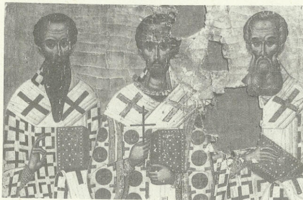
Οἱ Τρεῖς Ἱεράρχες, στυλοβάτες μιᾶς «Πατερικῆς Σχολῆς Παιδαγωγικῶν Ἐπιστημῶν». Φορητὴ εἰκόνα τῆς Ἱερᾶς Μονῆς Βαρυλάμ, Μετέωρα (16ος αἰώνας).

Θὰ ἦταν πράγματι ἰδιαίτερα χρήσιμη ἡ ἐντύπωση στὰ κείμενα αὐτὰ τοῦ Ι. Χρυσοστόμου ἀλλὰ καὶ στὶς εἰσαγωγικὲς σκέψεις τοῦ συγγραφέα. Γράφω ἐντύπωση γιατί περὶ τρυφῆς πρόκειται. Ἡ ἀνάγνωσι συνδυάζει «τὸ τερπνὸν μετὰ τοῦ ὠφελίμου». Οἱ ποιμένες μας θὰ εἶχαν πολλὰ νὰ διδαχθοῦν σ' αὐτὴ τὴν «Πατερικὴ