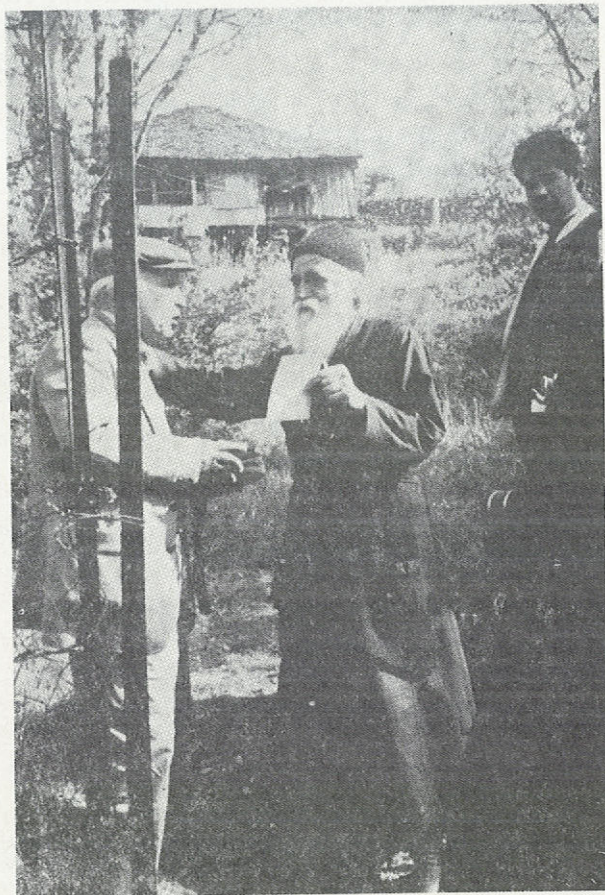
Γέροντας Παΐσιος: Μία ἀπὸ τὶς μεγαλύτερες φυσιογνωμίες τῆς ἐποχῆς μας.

Οἱ Τούρκοι δὲν χασομεροῦν καὶ τὸν πηγαίνουν στὸν Πατέρα Ἀρσένιο. Ὅταν ἀνοιξε τὴν πόρτα του ὁ Πατὴρ καὶ εἶδε αὐτὴ τὴ σκηνή, πολὺ πληγώθηκε καὶ μάλωσε τοὺς Τούρκους, πὺ τὸν εἶχαν δεμένο, γιὰ νὰ τὸν ἐλευθερώσουν γρήγορα καὶ μάλιστα τοὺς εἶπε καὶ παλιότουρκους. Ὁ ἀρχηγὸς τοὺς θύμωσε καὶ τράβηξε τὸ χατζάρι του, γιὰ νὰ κόψῃ τὸν Χα-