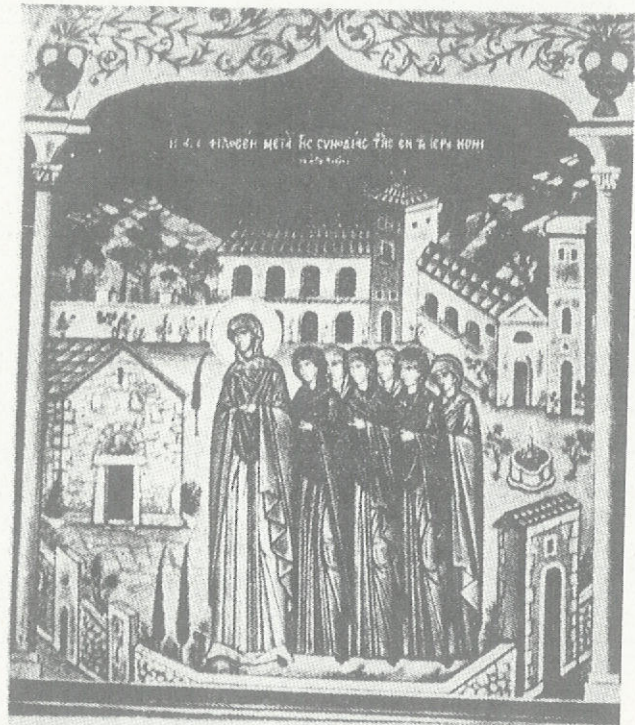
Ἡ ἁγία Φιλοθέη μετὰ τῆς συνοδείας τῆς ἐν τῇ Ἱ. μονῇ τῆς Ἁγίας Ἀνδρέας Παιτησίων. Τοιχογραφία ἐν τῷ αὐτῷ ναῷ ὑπὸ Φωτῆς Κόνδραξ.

Ὅτιδήποτε γίνεται πρὸς αὐτὴ τὴν κατεύθυνση μπορεῖ ν' ἀποτελέσει σημεῖο στήριξης καὶ τῶν δικῶν μας προσπαθειῶν γιὰ τὴν ποιμαντικὴ ἐνεργοποίηση τῶν μνημῶν μιᾶς πόλεως ἢ τῆς μνήμης τῶν πόλεων. Ἀρκεῖ νὰ μὴ ἐπιδιώκει μία « μουσειακὴ » ἀντίληψη τῆς χρήσεως τῶν χώρων ἀκόμα καὶ προκειμένου περὶ ἐκκλησιῶν ποὺ θὰ θεωροῦνται ὡς τόποι ἐπισκέψεως καὶ μόνο. Πάνω σ' αὐτὸ τὸ σημεῖο θὰ ὑπῆρχε περιθώριο νὰ λεχθοῦν πολλὰ καθὼς καὶ γιὰ τοὺς κινδύνους ἐνὸς τουρισμοῦ ἀσέβαστου τόσο γιὰ τὸ παρὸν ὅσο καὶ γιὰ τὸ παρελθὸν — γιὰτὶ ὄχι καὶ γιὰ τὸ μέλλον — αὐτοῦ τοῦ τόπου. Ἀντίθετα ἢ ἀντίληψη ἐνὸς τουρισμοῦ ὑπὸ τὴν ὀπτικὴ τῶν θεραπευτικῶν τοῦ ἀποτελεσμάτων μᾶς βρῖσκει πρόθυμος νὰ τὸν υἰοθετήσουμε ( θεραπευτικὸς τουρισμός ).