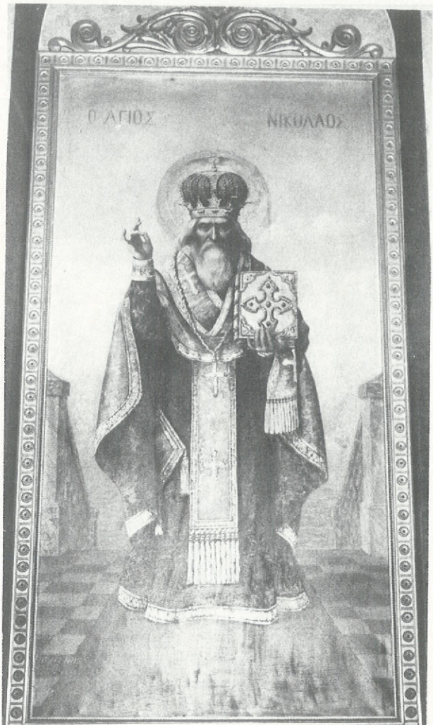
Ὁ Ἅγιος Νικόλαος.

Εἰκονίζεται σὲ μεγαλόπρεπη στάση, εὐλογῶν καὶ αὐστηρὸς σὰν Ρώσσοις Ἐπίσκοπος. Τὸν Ἅγιο Νικόλαο θὰ συναντήσωμε σὲ ὅλα τὰ ἐμπορικὰ κέντρα τῶν ἀποδήμων Ἑλλήνων. Στὸν πίνακα αὐτὸν γίνεται ἔντονα ἐμφανὴς ἡ χρῆσις τῆς τεχνικῆς