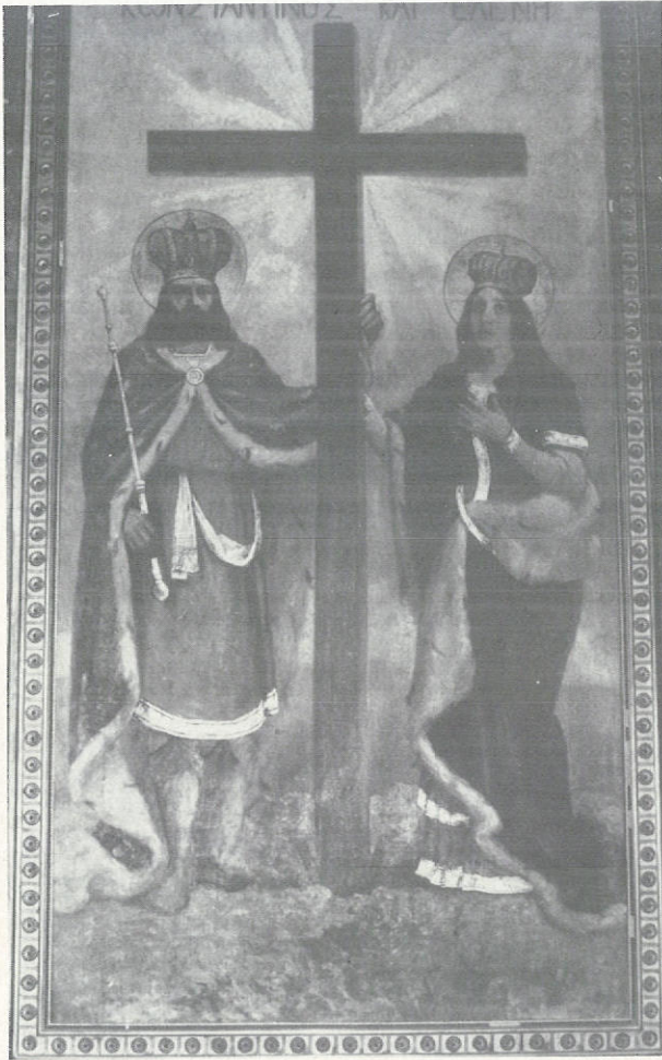
Οἱ Ἅγιοι Κωνσταντίνος καὶ Ἑλένη.

Οἱ Ἅγιοι ἀπεικονίζονται κατὰ τὴν συνηθισμένη παράσταση μὲ ἔντονη τὴν δυτικὴ φαντασία, καλοδουλεμένοι ἀπὸ πλευρᾶς ἐνδυμάτων. Τὸ ἔργο ἱστορήθηκε πρὸς τιμὴν τοῦ Κωνσταντίνου Τυφόξυλου, ἐπιφανοῦς μέλους τῆς Κοινότητος. Ὁ Κ. Τυφόξυλος γεννήθηκε στὴν Κοζάνη τὸ πρῶτο ἡμῶν τοῦ 19ου αἰῶνα καὶ μαζί μὲ τὸν ἀδελφό του Ἐμμανουήλ, ἐπέδωσαν σὲ ἐμπορικῆς ἐπιχειρήσεις