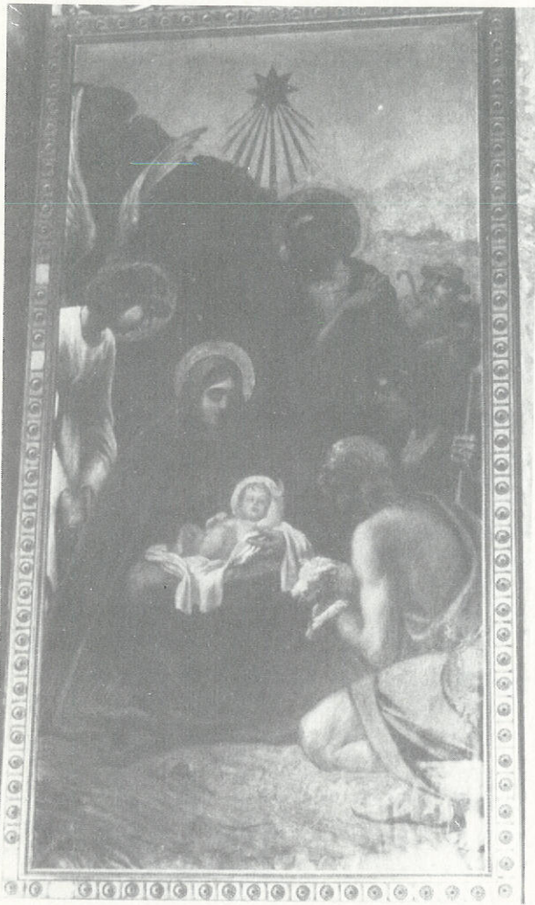
Ἡ Προσκύνησις τῶν Ποιμένων.

τὴν ἀναπνοὴν τῶν» ἐπιμένει ὁ φανατικὸς στὰ παραδοσιακὰ Φ. Κόντογλου — ἀλλὰ ἡ ἴδια ἡ ἀγκάλη τῆς Θεοτόκου γίνεται λίκνον γιὰ τὸν Ἀχώρητον Υἱὸν Της.