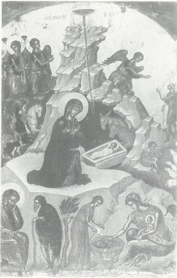
Ἡ Παναγία γονατιστή μὲ σταυρωτὰ τὰ χέρια. Ἔργο τοῦ 1546 τοῦ Θεοφάνους τοῦ Κρητός. Ἡ στάση αὐτὴ ὀφείλεται σὲ δυτικὴ (ἰταλική) ἐπίδραση καὶ δὲν ὑπάρχει σὲ προγενέστερα ἔργα τοῦ ἴδιου, ὅπου ἡ Κυρία Θεοτόκος παριστάνεται λεχώνα, ὅπως στὴ βυζαντινὴ ἀγιογραφία.

γῆς Μ. Καλλιγᾶ παρὰ ἀπευθείας ἀπὸ ἰταλικὸ πρότυπο».