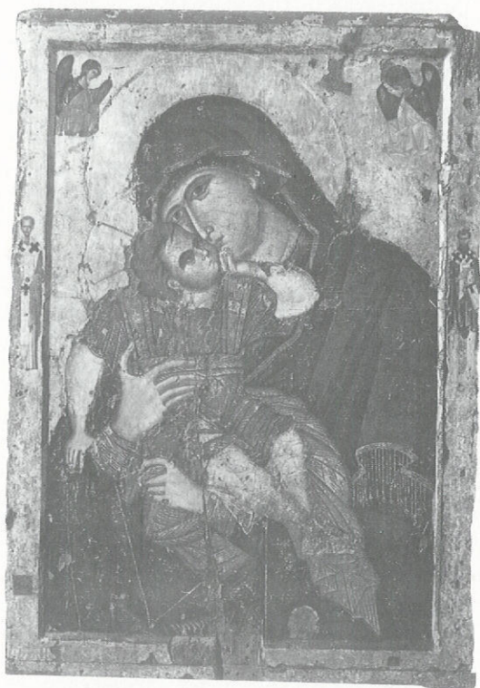
Παναγία ἡ Γλυκοφιλοῦσα

«Τὴν ἄχραντον εἰκόνα Σου προσκυνοῦμεν Ἀγαθέ...», συνόδευε μὲ τοὺς ψάλτες, κρατώντας τὴ Γλυκοφιλοῦσα στὰ χέρια του.