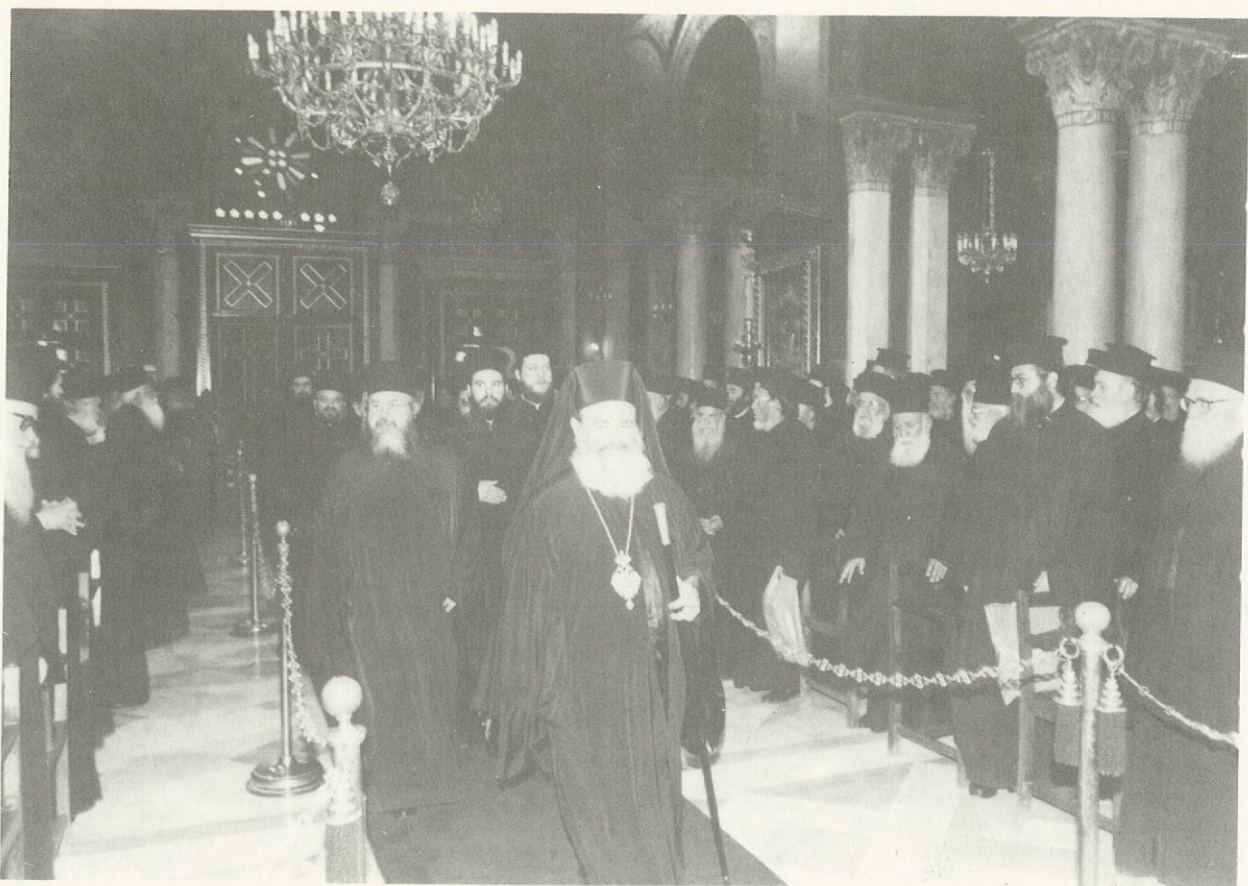
Ὁρθοί οἱ Ἱερεῖς ὑποδέχονται τὸν Μακ. Ἀρχιεπίσκοπο Ἀθηνῶν καὶ πάσης Ἑλλάδος κ. Χριστόδουλο, συνοδούμενο ἀπὸ τὸν Πανοσ. Ἀρχιμ. κ. Δανιὴλ Πουρτσουκλή, Ἀρχιγραμματέα τῆς Ἱ. Συνόδου, κ.ἄ.