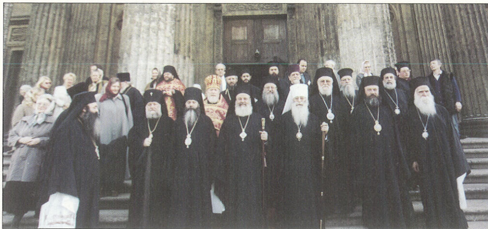
Μὲ τὸν Σεβ. Μητροπολίτη Ἁγίας Πετρούπολεως καὶ Λαδόγας κ. Βλαδίμηρο (Ἱερὸς Ναὸς Παναγίας τοῦ Καζάν)