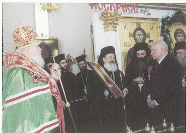
Ὁ Μακαριώτατος προσφέρει τὴν εἰκόνα τοῦ Ἀποστόλου Παύλου στὸν Δήμαρχο τῆς Μόσχας