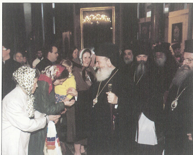
Ἡ Εὐλογία. Στὸν Ἱερὸ Ναὸ τῆς Παναγίας τοῦ Καζάν στὴν Ἁγία Πετρούπολη.