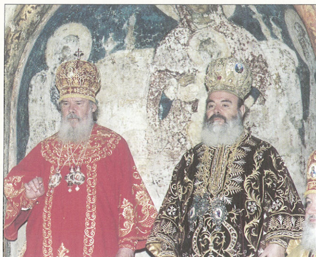
Στὸν Καθεδρικό Ναὸ Κοιμήσεως τῆς Θεοτόκου τοῦ Κρεμλίνου