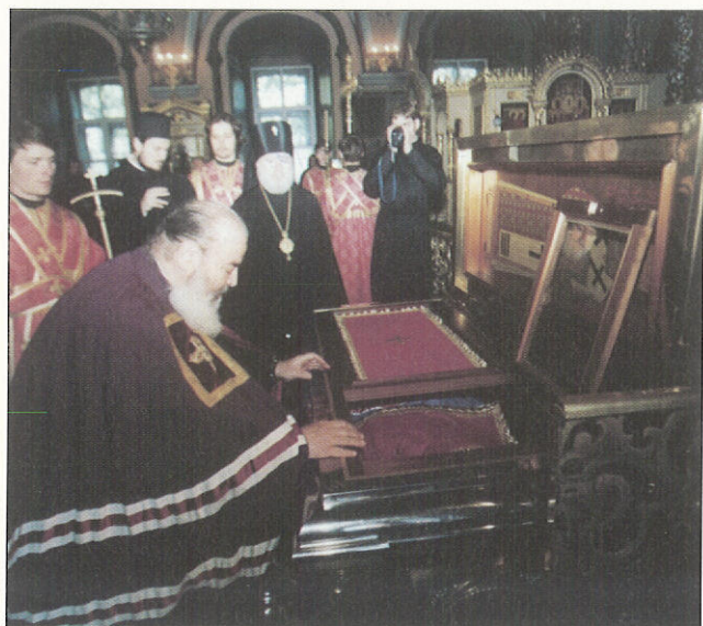
Προσκύνηση τῶν ἱερῶν λειψάνων τοῦ Ἁγίου Σεργίου Ραντονέξ