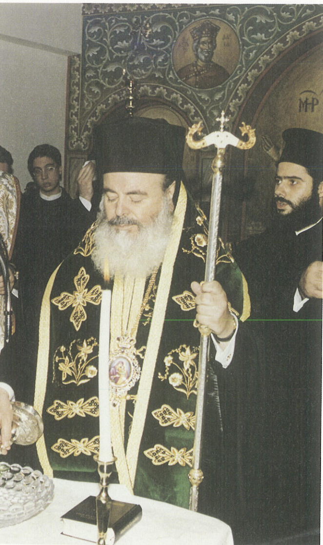
«Στέγης Γερόντων» τοῦ Ἱ. Ν. Ἀγ. Παντελεήμονος Ἀχαρνῶν.

Τὰ ἐγκαίνια τῆς θαυμασίας αὐτῆς «Στέγης Γερόντων» τέλεσε ὁ Μακ. Ἀρχιεπίσκοπος Ἀθηνῶν καὶ πάσης Ἑλλάδος κ. Χριστόδουλος τὴν 18ῃ Νοεμβρίου 2001, ὁ ὁποῖος δὲν περιορίσθηκε στὴν χαιρετιστήρια προσφώνησί του, κατὰ τὴν ὁποία συνεχάρη τοὺς συντελεστὲς τοῦ ἔργου, ἀλλὰ τὴν ἰδίαν ἡμέρα ἔγραψε καὶ προσωπικὴν