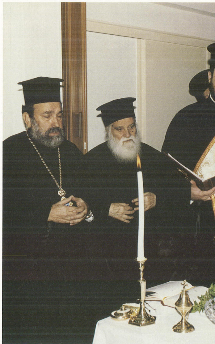
Στιγμιότυπο ἀπὸ τὴν τελετὴ τῶν ἐγκαίνιων τῆς «Στέγης

Μετὰ τὴν έκδοσι δύο οἰκοδομικῶν ἀδειῶν ἀπὸ τὶς Ὑπηρεσίες τῆς Ναοδομίας και τῆς Πολεοδομίας, ἀνέλαβε ὅλους τοὺς κόπους τῆς έπιστασίας και παρακολουθήσεως τοῦ ἔργου, τὸ ὁποῖο ὀλοκληρώθηκε με διαφάνεια, με νομίμους διαγωνισμοὺς και με