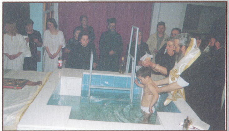
Ἀπὸ τὴν βάπτισιν 15 ἐνηλίκων κατηχουμένων στὸ Βαπτιστήριον τοῦ Ἱ. Ν. Ἁγ. Παρασκευῆς Λαμίας (16.3.2002)