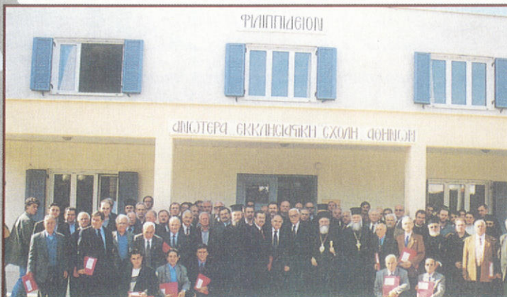
Ἀναμνηστικὴ φωτογραφία τῶν Ἱεροψαλτῶν τῆς Ἱ. Μητροπόλεως Ἀττικῆς, ποὺ μετείχαν στὴν Ἡμερίδα, ἢ ὁποία ὀργανώθηκε μὲ πρωτοβουλία τοῦ Σεβ. Μητροπολίτου κ. Παντελεήμονος