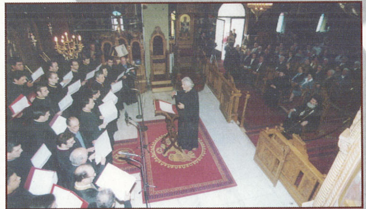
Ἀπό τὴν πρώτη συνάντηση πο- λυφωνικῶν καὶ βυζαντινῶν χορο- διῶν στὸν Ἱερό Ναὸ Φανερωμέ- νης στὸν Χολαργό (14.4.2002)