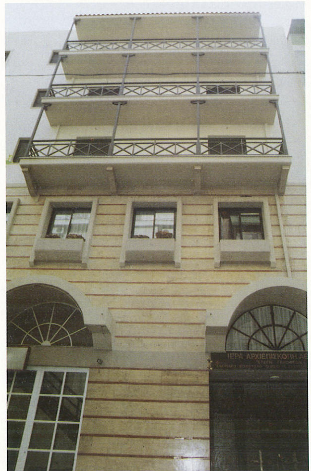
Τὸ μεγαλοπρεπὲς οἰκοδόμημα τῆς «Στέγης Γερόντων».

Εἶναι περιττὸν νὰ ἐπαναλάβω ὅτι οἱ ἀξιέπαινες ἀθόρυβες προσπάθειες ἐνὸς ἐφημερίου πρὸς ἀνέγερσιν τῆς περὶ οὗ ὁ λόγος «Στέγης Γερόντων», ἡ ὁποία ἀποτελεῖ νέον κόσμημα τῆς Ἱ. Ἀρχιεπισκοπῆς Ἀθηνῶν, ἀποτελεῖ ἀξιομίμητο παράδειγμα μεθοδικῆς ἐργασίας σ' ἕνα σπουδαιότατο τομέα τοῦ ποιμαντικοῦ ἔργου.