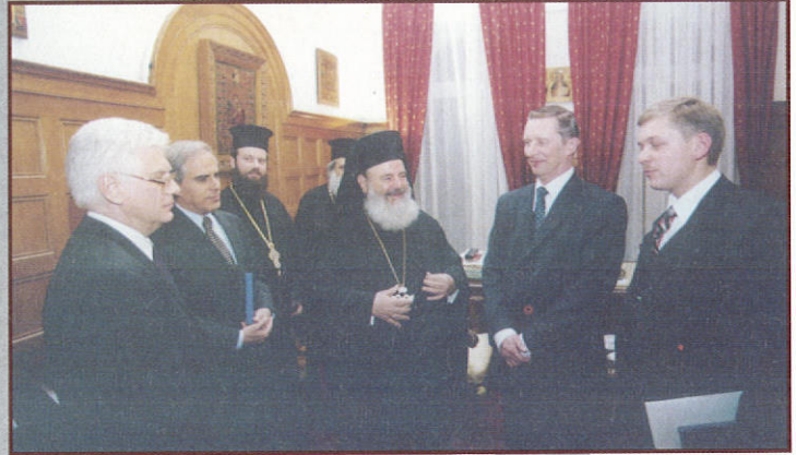
Έπίσκεψη του Ρώσου Υπουργού Άμυνας κ. Ίβανώφ στην Ίερά Άρχιεπισκοπή Ἀθηνῶν (4.4.2002)