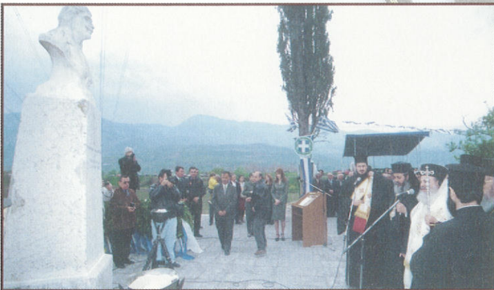
Ἐπίσκεψιν τοῦ Μακαριωτάτου στὴν Ἱερὰ Μητρόπολη Φθιώτιδος ἐξ ἀφορμῆς τῶν ἐκδηλώσεων «Διάρκεια 2002» (20.4.2002)