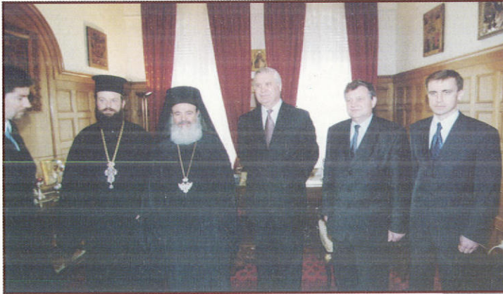
Έπίσκεψη του Υπουργού Ἐξωτε- ρικῶν τῆς Οὐκρανίας κ. Ἀνατόλι Ζλένκο στην Ίερά Ἀρχιεπι- σκοπή Ἀθηνῶν (18.4.2002)