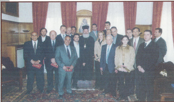
Έπίσκεψη μελῶν τοῦ Δ.Σ. τοῦ Συλλόγου Ἑλλήνων Ὀλυμπιο- νικῶν στὴν Ίερά Ἀρχιεπισκοπή Ἀθηνῶν