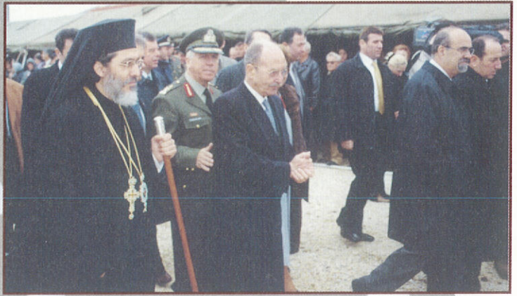
Ἀπὸ τὴν ἐπίσκεψιν τοῦ Ἐξοχωτάτου Προέδρου τῆς Ἑλληνικῆς Δημοκρατίας κ. Κων/νου Στεφανοπούλου στὸ Σιδηρόκαστρο γιὰ τὶς γιορτὲς τοῦ Ροῦπελ καὶ τῶν Ὁχυρῶν (7.3.2002)