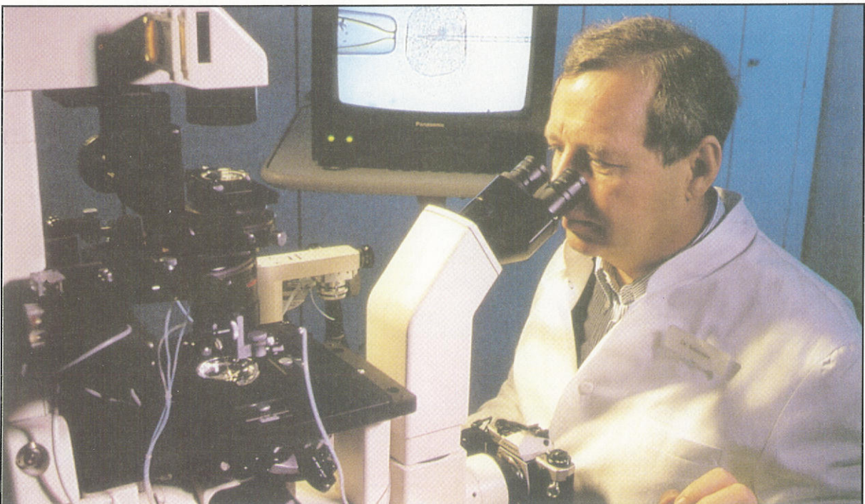
Άπό τó περιοδικό «Πεμπτουσία».

4. Θα μπορούσαμε σ' αυτό τó σημείο νά συμφωνήσουμε μέ τή διατύπωση τού Ρεζις Ντεμπρέ ότι «ό χριστιανισμός έπινοεί μια γενεαλογία χωρίς γενετική: έστ' ός άτομο, είσαι αυτός πού θά επιλέξεις τήν πίστη σου και θά τή ζήσεις» (δ.π., σ. 1).