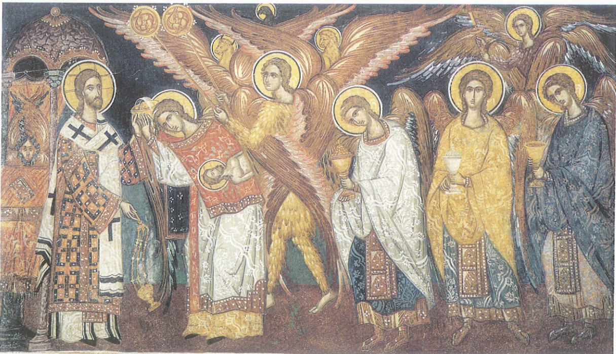
Ἡ Λειτουργία τῶν ἀγγέλων, Τοιχογραφία Ἰ. Μουῆς Φιλανθρωπινῶν (1542).

Ἡ Ἐκκλησία μπορεῖ νὰ μᾶς βοηθήσει νὰ ἀναβιώσουμε τὴ θεολογία τῆς σήμερα, εἶναι ἡ Ἀσκητικὴ. Ἐδῶ τὰ πράγματα ἀπαιτοῦν κάποιες ἐξηγήσεις, γιατί ὁ ἀσκητισμὸς συνήθως ταυτίζεται μὲ κάποια ἐχθρικότητα ἔναντι τοῦ ὑλικοῦ κόσμου καί, στὴν καλύτερη περίπτωση, μὲ τὴν περιφρόνησή του. Μὲ ἐξαιρεση ὀρισμένων τάσεων στὸν ἀρχαῖο μοναχισμό, ποὺ ἦταν κάτω ἀπὸ τὴν ἐπίδραση τῆς