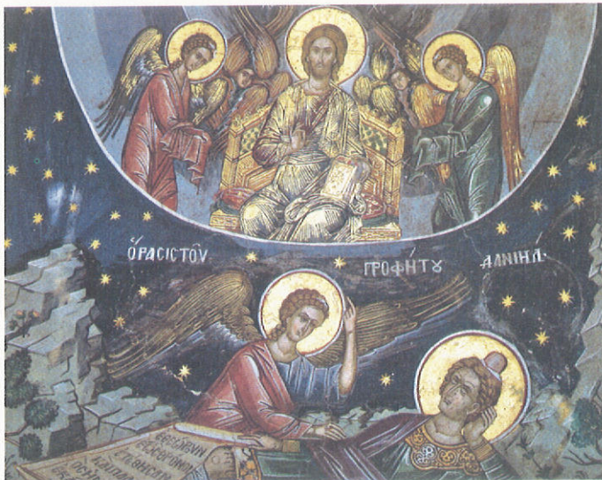
«Ὁρασις τοῦ προφήτου Δανιὴλ», 1568

• Ὁ Θεὸς Πατέρας μετὰ τὴν παλαιδιαθηκικὴ ἔννοια, δηλ. τῆς φροντίδας τοῦ Θεοῦ γιὰ τὴν ἱστορικὴ ἀποστολὴ τοῦ ἐκλε-