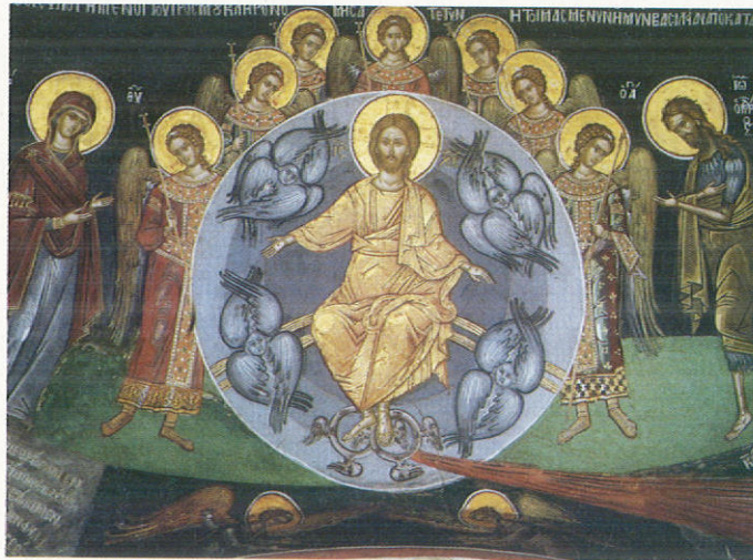
Η Δευτέρα Παρουσία και ο Πύρινος Ποταμός, 1568

τε» σωστό λόγο στο κήρυγμά σας. Είναι αναγκαία ή μελέτη και ο προσωπικός σας αγώνας και για την ποιμαντική αποστολή σας. Θαυμάζω πολλούς επιστήμονες, δικηγόρους, γιατρούς, εκπαιδευτικούς κ.λπ., που κυριολεκτικά «ξενυχτούν», ακόμη και στα ώριμά τους χρόνια, για την ενημέρωσή τους λ.χ. στις νέες νομολογίες, σε «δεδικασμένα» ή για τις καινούριες ιατρικές-φαρμακευτικές τεχνικές, για την προετοιμασία των μαθημάτων τους