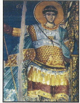
ΕΞΩΦΥΛΛΟ: Ὁ Ἅγιος Δημήτριος. Νωπογραφία τοῦ Μανουὴλ Πανσέληνου, Ἅγιον Ὄρος.