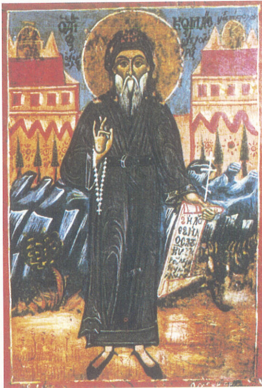
Ὁ ἅγιος Κοσμᾶς ὁ Αἰτωλὸς (1714-1779)

στὶς λατρευτικὲς συνάξεις, στὶς ἀκολουθίες ποὺ ὁ ἴδιος προέτρεπε ἢ ἐπιτελοῦσε, στὸν ἀγῶνα καὶ τὴν προσπάθειά του νὰ μάθει στοὺς ἀπαιδευτοὺς ἱερεῖς, πῶς νὰ τελοῦν τὰ μυστήρια, πῶς νὰ κηρύττουν τὸ λόγο τοῦ Θεοῦ. Ὁ Ἅγιος συνδέει τὸ κήρυγμα μὲ τὴ λατρευτικὴ καὶ μυστηριακὴ ζωὴ τῆς Ἐκκλησίας, ἔχει λατρευτικὴ καὶ ἐκκλησιαστικὴ συνείδηση, γι' αὐτὸ καὶ τὸ κήρυγμά του εἶναι μυσταγωγικό.