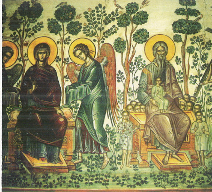
Ἡ Εὐφροσύνη τοῦ παραδείσου, 1568

Περιττεύει νὰ ποῦμε κἂν πόσο ἀνεπαρκῆ καὶ ἐκκρεμῆ εἶναι τέτοια ἰδανικά, καὶ ἂν ποτέ δικαιουῦνται κἂν νὰ λέγονται ἰδανικά!