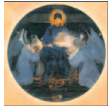
ΕΞΟΦΥΛΛΟ: Νικολάου Γύζη «Ἡ Παναγία μέ τους Ἀγγέλους»