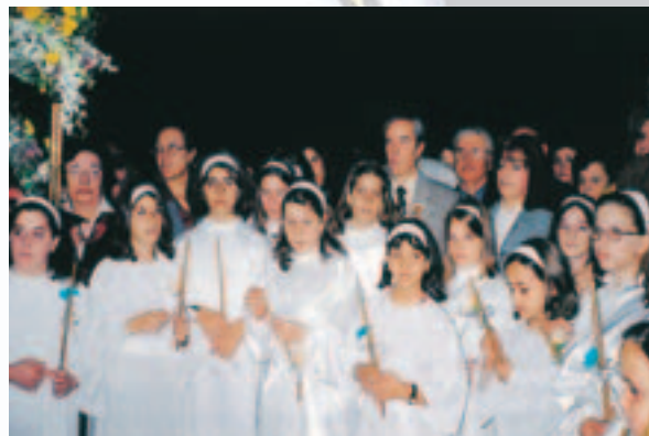
Κορίτσια – ἀκόλουθοι τῆς περιφορᾶς τῆς εἰκόνας τῆς Παναγίας τῆς Ἐνορίας Εἰσοδίων τῆς Θεοτόκου Πρασί- νου Λόφου Ἡρακλείου Ἀττικῆς (Νοέμβριος 2004).