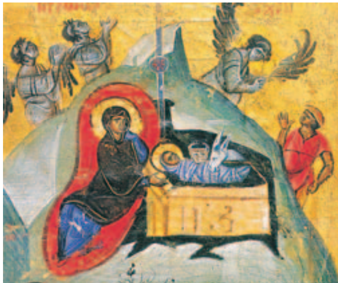
Μικρογραφία χειρογράφου Γ. Μ. Βατοπεδίου, 13ος αϊ.

θεῖ μία ἄλλη ψηφιδωτὴ παράσταση σὲ σφαιρικὸ τρίγωνο πάλι, του τρούλου στο καθολικὸ τῆς μονῆς Δαφνίου, κοντὰ στὴν Ἀθήνα, στὰ τέλη του ΙΑ' αϊ. καὶ με μικρὲς φθορές. Ἡ φωτεινὴ δέσμη κατέρχεται ἀπὸ τὸν οὐρανὸ καὶ χωρίζεται σὲ τρία μέρη, δηλώνοντας τὴν τριαδικότητα του Θεου.