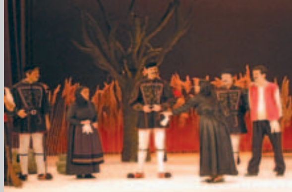
Ἀπό τὴν θεατρικὴ παράσταση «Παῦλος Μελάς» ποὺ ἀνέβασε τὸ θεατρικὸ ἐργαστήρι τῆς Ἱ. Μ. Βεροίας (Νο- έμβριος 2004).