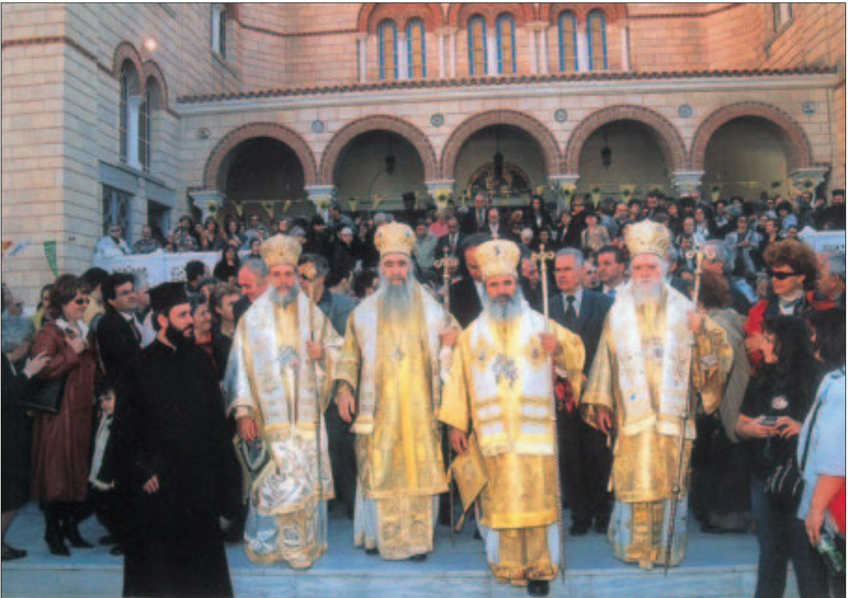
Στιγμιότυπο ἀπὸ τὴ λαμπρὴ Πανήγυρη τοῦ Ἁγίου Νεκταρίου στὴν Αἴγινα. Ἀπὸ τὰ ἀριστερὰ διακρίνονται οἱ Σεβ. Σύρον κ. Δωρόθεος, Νικαίας κ. Ἀλέξιος, Ὑδρας κ. Ἐφραίμ καὶ ὁ Θεοφ. ἐπίσκοπος Κορωνείας κ. Παντελεήμων

Εἶναι καὶ αὐτὸς ἓνας λόγος γιὰ τὸν ὁποῖο ἀποτελεῖ ἐπεῖγον αἴτημα νὰ δουλέψουμε γιὰ τὴ λειτουργικὴ συνειδητοποίηση τοῦ λαοῦ μας, θέμα τὸ ὁποῖο θὰ μᾶς ἀπασχολήσῃ σὲ ἄλλα σημειώματα.