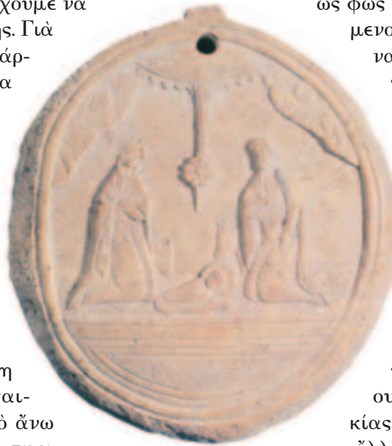
Λιθανάγλυφο δισκάριο I. M. Σίμωνος Πέτρα

Ἀναφερόμενοι στὸ ἄστρο μὲ τρεῖς προβολές (αἰχμές) τονίζουμε, ὅτι ὑπαινίσσεται τὰ τρία πρόσωπα τῆς Ἁγίας Τριάδας, ἐνῶ ἡ μόνη κεντρικὴ ἀκτίνα κατερχόμενη στὴ γῆ συμβολίζει τὴν ἐνσάρκωση τοῦ Χριστοῦ. Πρόκειται γιὰ μίᾶ σχηματικὴ θεολογικὴ διδασκαλία, «ὀπτικὴ Θεολογία», ὅχι ἄγνωστη γιὰ τὴν πρωτοχριστιανικὴ καὶ περισσότερο γιὰ τὴν βυζαντινὴ περίοδο, μετὰ μάλιστα ἀπὸ τὴν ἐκτεταμένη διδασκαλία γιὰ τὸ ἄκτιστο φῶς καὶ τὶς θεῖες ἐνέργειες τῆς γνωστικῆς καὶ τῆς παλαμικῆς ἢ ἡσυχαστικῆς Θεολογίας.