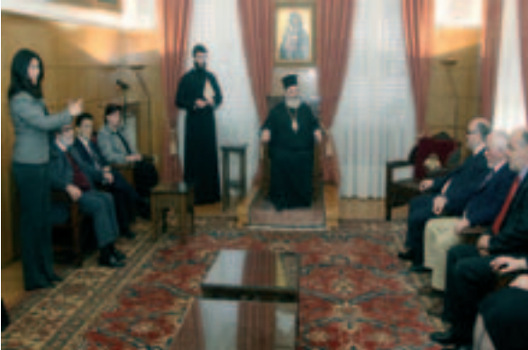
Ὁ Μακαριώτατος με ἐκπροσώπους τῶν Προσώπων με Εἰδικές Ἀνάγκες (Δεκέμβριος 2004).