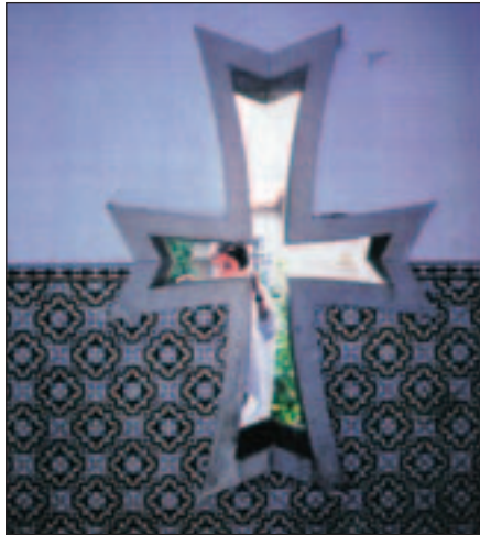
Ἡ ἀκεραιότητα καὶ ἡ ἰσοτιμία στὶς σχέσεις τῶν δύο φύλων τέμνεται καὶ ἰσορροπεῖ στὶς ὀριζόντιες καὶ κατακόρυφες κεραῖες τοῦ Σταυροῦ (φωτογραφία Α. Μ. Σταυροπούλου, Πορτογαλία 1995).

Ἐνδεικτικὸ εἶναι τὸ κείμενο τῶν ἀρχῶν τοῦ προηγούμενου αἰῶνα ποὺ ἀνήκει στὸν ἅγιο Νεκτάριο, ἓνα ἀπὸ τοὺς τελευταίους