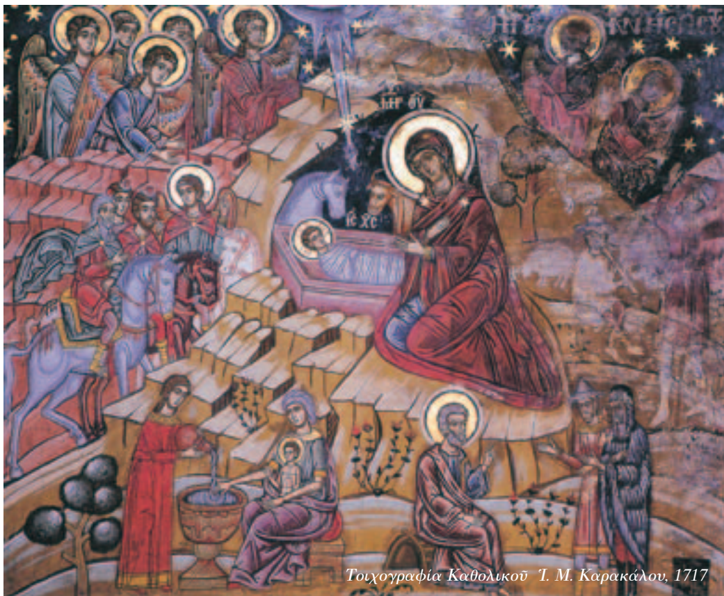
Τοιχογραφία Καθολικῶν Ἱ. Μ. Καρακάλου, 1717

Γέννησης δέν σε άγγίζει άπλά, ζεις το θαύμα, μένεις έκθαμβος και γαληνεμένος ακούγοντας τις γλυκύτατες βυζαντινές ψαλμοδιές και βλέποντας τις παραστάσεις της Γέννησης στους τοίχους ή στις φορητές εικόνες ιστορημένες από τα χέρια των μεγάλων έκπροσώπων της μακεδονικής ή της κρητικής σχολής, είτε κι ενός ταπεινού άγιογράφου των χρόνων της Τουρκοκρατίας. Μια ίλαρότητα, για να θυμηθούμε τον Παπατσώνη, νύνει τα πρόσωπα των μοναχών, νέων και γερόντων, και οι άγγελου αφήνουν τις τοιχογραφίες, όπως εκείνο το βράδυ της Γέννησης, και κατεβαίνουν στη γη, θαρρείς για να συμψάλλουν μαζί με