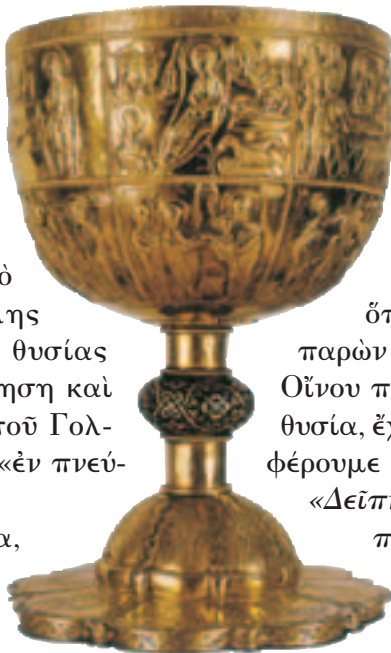
Ἅγιο Ποτήριον τῆς Ἱ. Μ. Ἰβήρων, 1587-1588, μέ παράσταση Γεννήσεως

Ἄλλὰ τὸ Μυστήριον αὐτό, ὅπου ὁ Χριστὸς εἶναι πράγματι παρὼν ὑπὸ τὰ εἶδη τοῦ Ἄρτου καὶ τοῦ Οἴνου προσφερόμενος ὡς ἀναιμάκτος θυσία, ἔχει καὶ ἄλλες ὀνομασίες. Ἀναφέρουμε μερικές: «Κυριακὸν Δεῖπνον», «Δεῖπνον μυστικὸν καὶ θεῖον», «Τράπεζα Κυρίου», «Τράπεζα Δεσποτική», «Ἄρτος Κυριακός», «Ἄρτος οὐράνιος», «Ποτήριον Κυρίου», «φάρμακον ἀθανασίας», «Ποτήριον ζωῆς», «θυσία», «θυσία ἁγία».