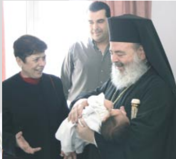
Ἀπὸ τὴν ἐπίσκεψη τοῦ Μακαριωτάτου στὸ μαιευτήριο «Ἑλενα» (Ἀπρίλιος 2004).