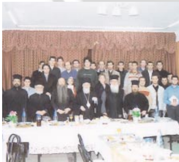
Ἀπὸ τὴν Συνάντηση Ἀναγνωστῶν καὶ Ἱεροπαίδων τῆς Ἱ. Μητροπόλεως Ἀττικῆς (Ἀπρίλιος 2004).