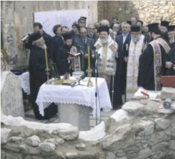
Ὁ Μακαριώτατος εὐλογεῖ τὶς ἐργασίες ἀνοικοδομήσεως τοῦ ἱ. ναοῦ τοῦ ἁγίου Ἐλισσαίου (Ἀπρίλιος 2004).