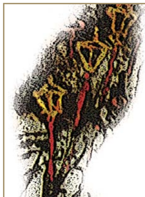
Λεπτομέρεια ἀπὸ Λιτανεία.

2. Ἐγὼ κι ἐσεῖς εἴμαστε γραμμένοι στὸν κατάλογο ἀπὸ τὴ μέρα ποὺ βαπτιστήκαμε. Τὸ ἔχουμε συνειδητοποιήσει; Σήμερα, ποὺ ξανακούσαμε τὸν κατάλογο, ἂς βάλουμε αὐτὴ τὴν ἐγγραφὴ βαθιὰ στὸ μυαλό μας καὶ ἂς τὴν ἀποδεχτοῦμε μὲ τὴν καρδιά μας. Γιὰ νὰ καταλάβουμε τί σημαίνει ὅτι ὁ Θεὸς δημιουργεῖ τὴν Ἐκκλησία του, ὅτι ἑμεῖς εἴμαστε τὰ μέλη της, ἐκεῖνοι ποὺ γεννοῦν τὸν Χριστὸ, τὸν Χριστὸ ποὺ γεννιέται σὲ λίγες μέρες καὶ τὸν γιορτάζουμε. Ἀμήν.