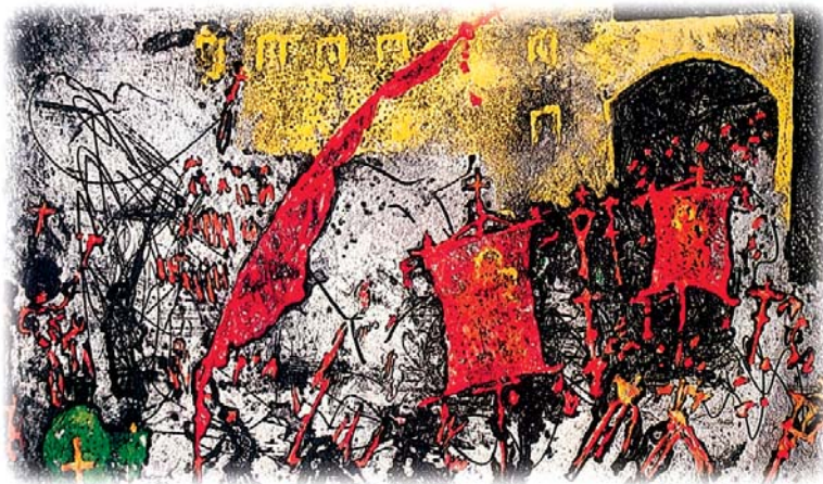
Λιτανεία τῆς Ἀναστάσεως τοῦ Ἁγίου Νικολάου.