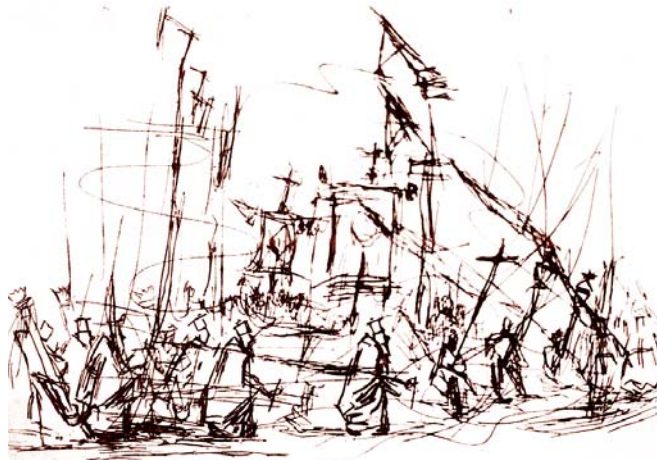
Λιτανεία τοῦ Ἁγίου Σπυρίδωνα

(Ἀπὸ Τροπάριο παλαιᾶς ἐξοδίου ἀκολουθίας)