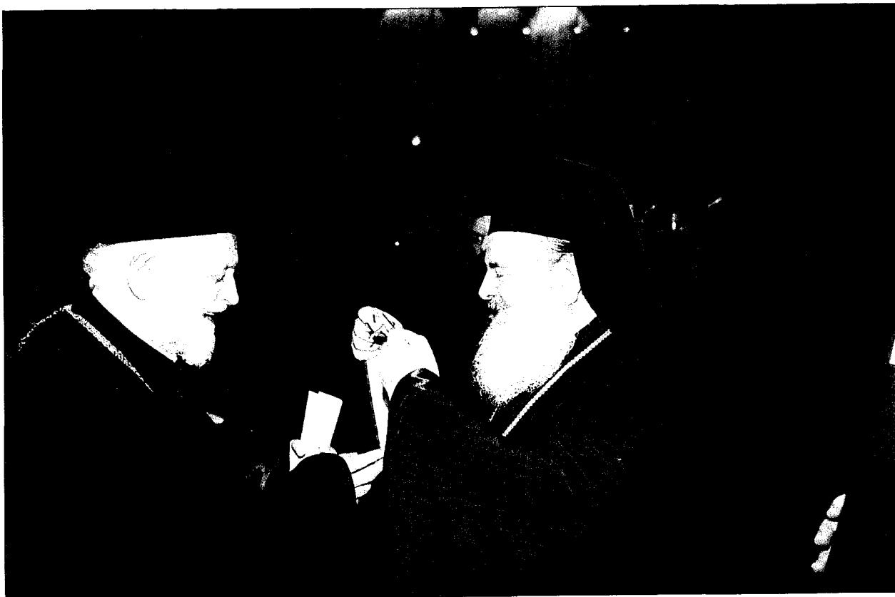
Ὁ Σεβ. Μητροπολίτης Κορίνθου κ. Παντελεήμων παραλαμβάνει ἀπὸ τὸν Μακ. Ἀρχιεπίσκοπο τὸ δίπλωμα καὶ τὸ Χρυσὸ Σταυρὸ τοῦ Ἀποστόλου Παύλου.

μετέπειτα Ἀρχιεπίσκοπος Ἀθηνῶν Σεραφεῖμ, ποῦ ποτὲ δὲν λησιμόνησε τὴν ἀντιστασιακὴν του δράση καὶ ιδιότητα στὶς τάξεις τοῦ Ε.Δ.Ε.Σ. γιὰ τὶς ὁποῖες καὶ δικαίως ἐκανχᾶτο. Ὁ Ἡλείας Ἀντώνιος, εἶναι γνωστὸν ὅτι καθ' ὅλη τὴν διάρκεια τῆς Κατοχῆς συγκακοπάθησε μὲ τὸ λαό, προεκινδύνευσε ὑπὲρ αὐτοῦ, ἔδωσε ἐπανειλημμένα στοὺς Γερμανοὺς κατακτητὲς προσωπικὲς ἐγγυήσεις προκειμένου νὰ σώσει ἀπὸ τὸν θάνατο συλληφθέντες πατριῶτες ἢ ἀπειλούμενες μὲ ἀντίποινα πόλεις τῆς Ἡλείας. Ὁ δὲ Κοζάνης Ἰωακείμ, εἶχε ἤδη πολὺ πρὸ τοῦ πολέμου ἐθνικὴ δράση καὶ εἶχε διακριθῆ ὡς Μητροπολίτης Μετρώων καὶ Ἀθύρων γιὰ τὴν προστασία τῶν ἐλληνικῶν πληθυσμῶν τῆς ἐθναρχούσης Ἐκκλησίας καὶ τῆ διαφύλαξη τῆς ἐλληνορθόδοξης παράδοσης, καταδικασθεὶς εἰς θάνατον ἀπὸ τοὺς Τούρκους. Καὶ οἱ δύο ἀνέβησαν στὸ βογνὸ σὲ μιὰ δύσκολη καμπὴ τῆς ἐθνικῆς μας περιπέτειας, πάντως ὅμως στὴν διάρκεια τῆς Κα-