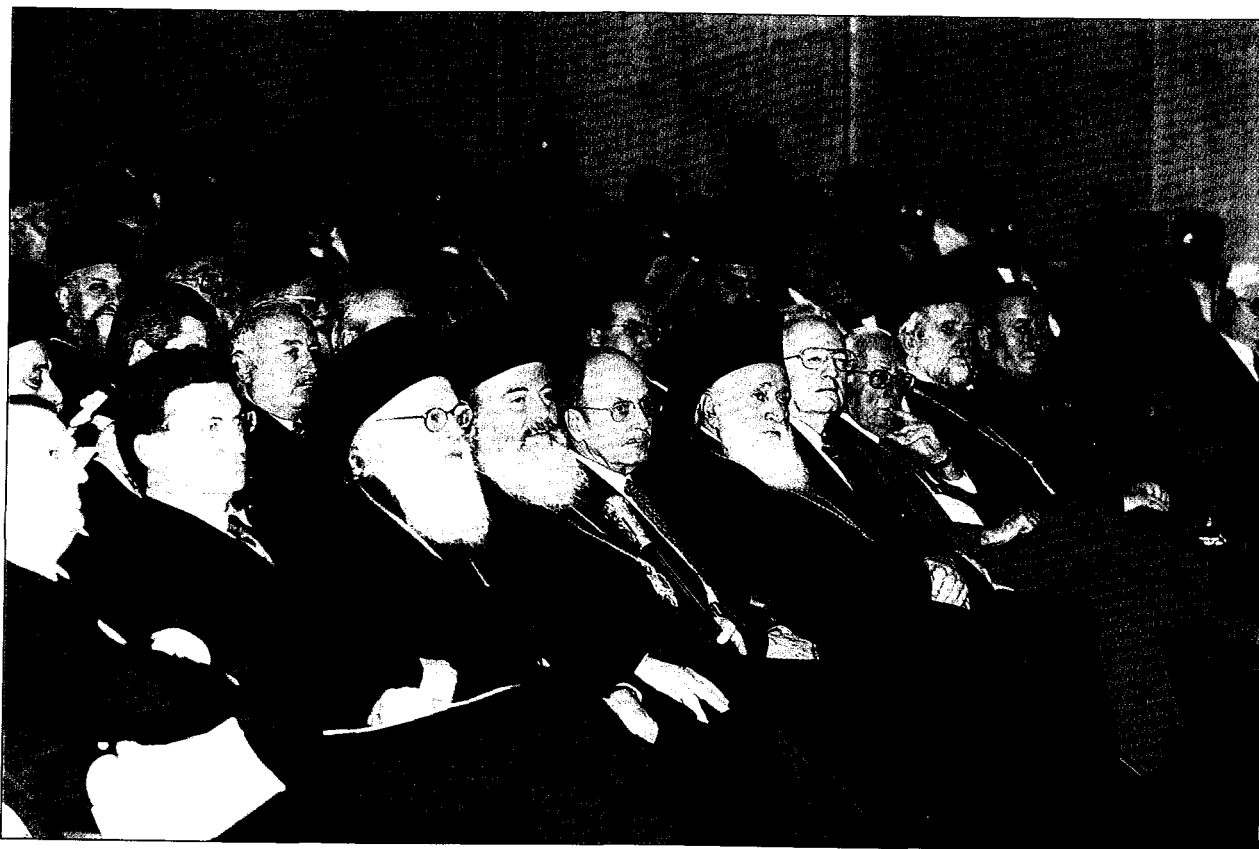
Οί Έπίσημοι στην πρώτη σειρά, παρακολουθοῦν μὲ ἐνδιαφέρον τὴν παρουσίαση τοῦ Τόμου.

Ἀκολούθησε ἡ ὁμιλία τοῦ Μακαριωτάτου Ἀρχιεπισκόπου Ἀθηνῶν καὶ Πάσης Ἑλλάδος κ.κ. Χριστοδούλου, ὑπὸ τὸν τίτλο: