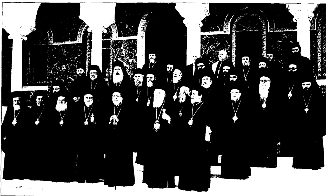
Ἡ Μείζων ἐν Κύπρῳ συνελθοῦσα Σύνοδος (14-17 Νοεμβρίου 2000) ἔμπροσθεν τῆς Ἱ. Ἀρχιεπισκοπῆς Κύπρου.

Ὁ Μακαριώτατος Ἀρχιεπίσκοπος Κύπρου καὶ Νέας Ἰουστινιανῆς κ. Χρυσόστομος, δι' ἐπιστολῆς Αὐτοῦ ἀπὸ 27ης Ὀκτωβρίου 2000, ἐν συνοχῇ καρ-