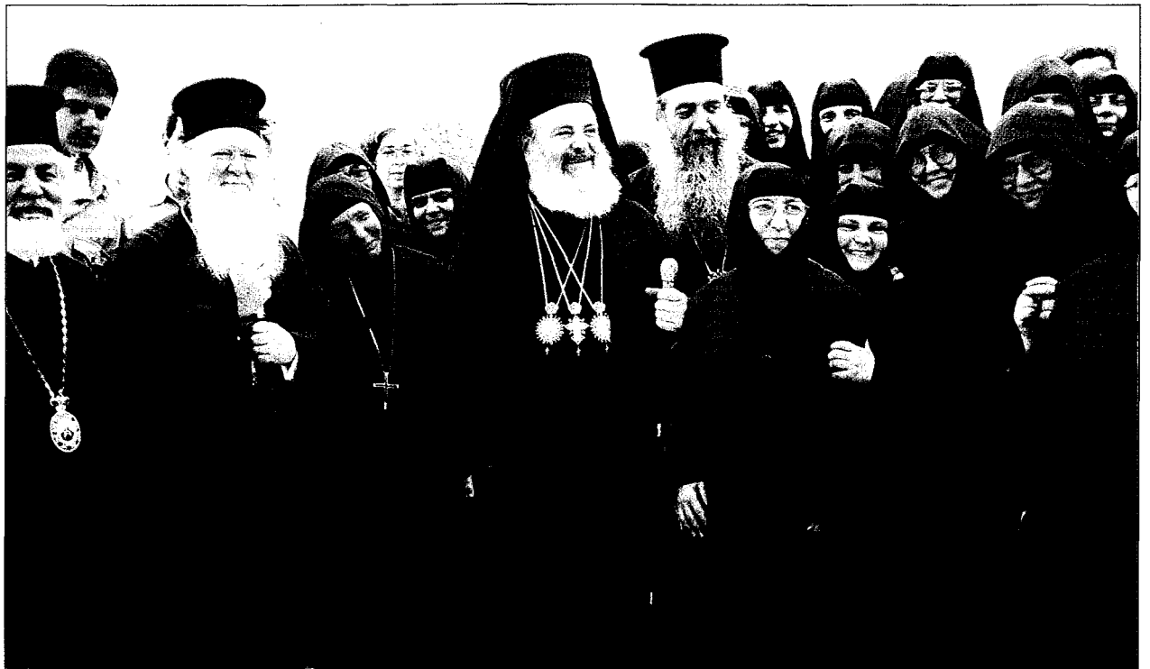
Οί δύο Προκαθήμενοι στην Γ. Μονή Άγ. Κηρύκων και Ίουλίτης τής Γ. Μ. Σιδηροκάστρου. Μαζί με τούς Σεβ. Μητροπολίτες Γαλλίας κ. Τερεμία και Σάμον και Ίκαρίας κ. Ευσέβιο και τισ μονάζουσες.