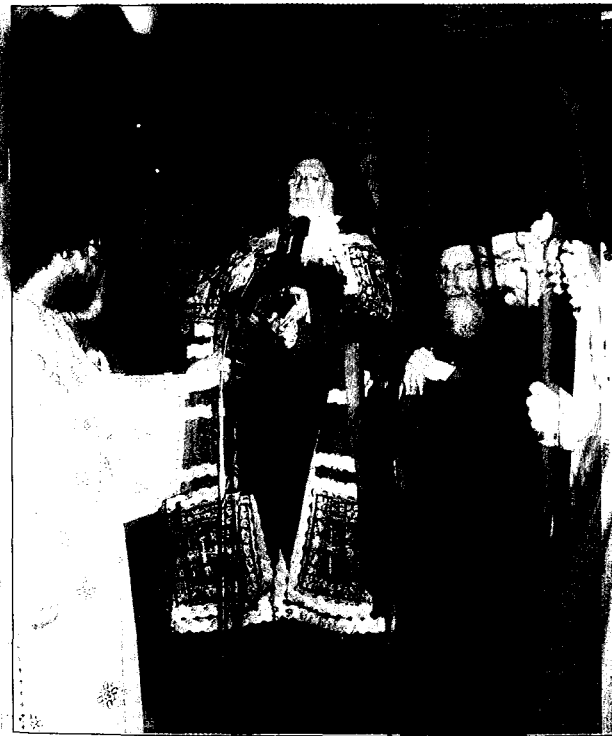
Δοξολογία στὴ Βυζαντινὴ Ἱ. Μονὴ Τιμίου Προδρόμου τῆς Ἱ. Μ. Σερρών. Δίπλα στὸν Παναγιώτατο ὁ Σεβ. Μητροπολίτης Σερρών καὶ Νιγρίτης κ. Μάξιμος.