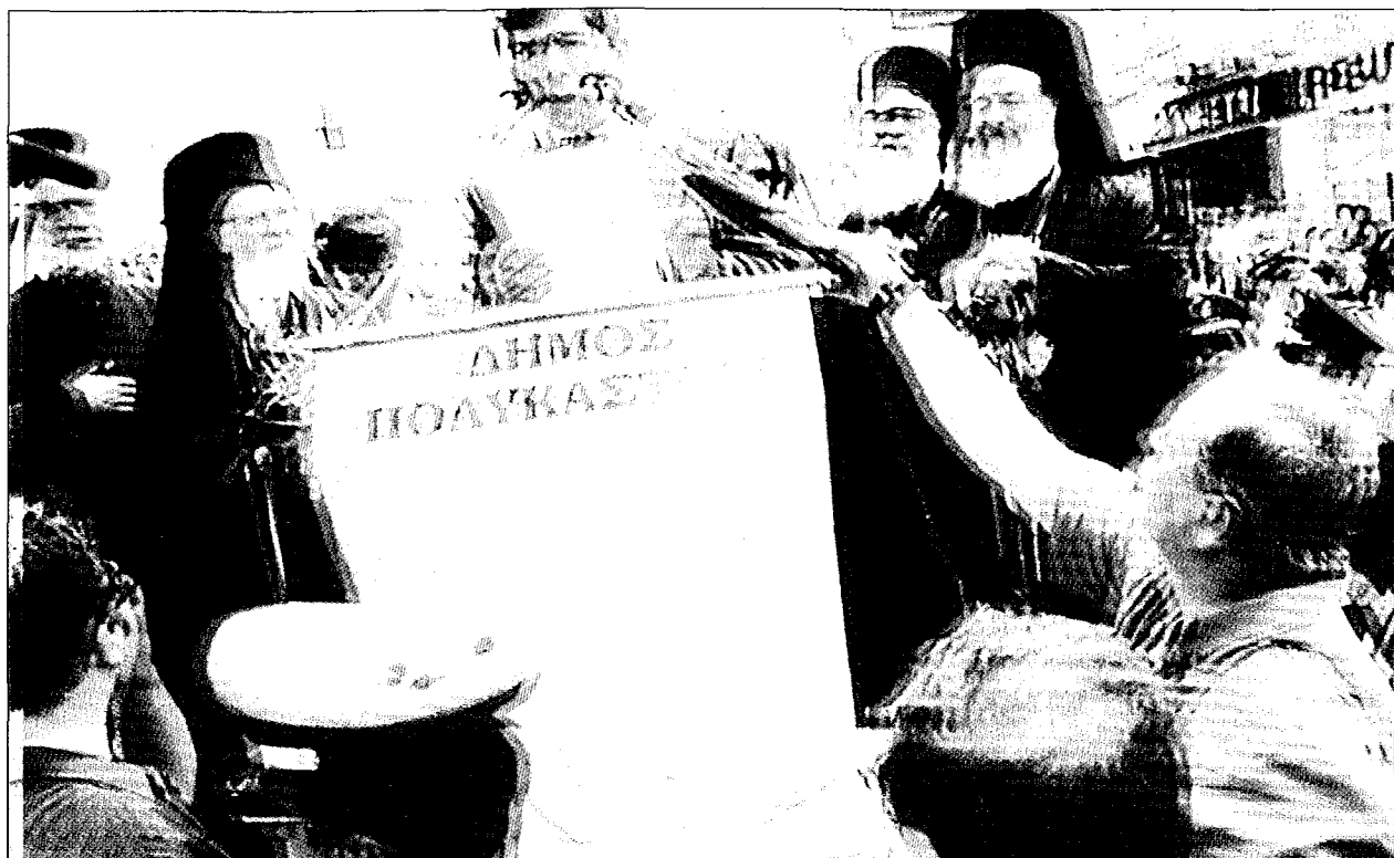
Στό Δήμο Πολυκάστρου ο Δήμαρχος προσφωνεί τους Ύψηλους Έπισκέπτες.