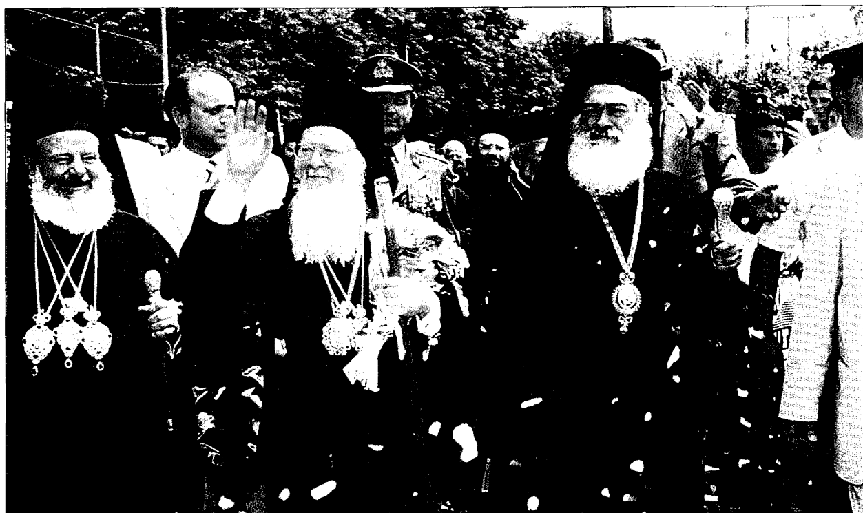
Θερμότατη και συγκινητική ύπηρεζε ή ύποδοχή τών δύο Προκαθημένων στην Ί. Μητρόπολη Γουμενίσσης. Τους συνοδεύουν ό Σεβ. κ. Δημήτριος και οί Τοπικές Άρχές.