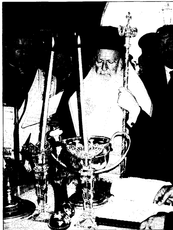
Θυρανοίξια Μητροπολιτικοῦ Παρεκκλησίου στήν Ἀρναία. Λίπλα του ὁ Ὑφυπουργός κ. Πάχτας.