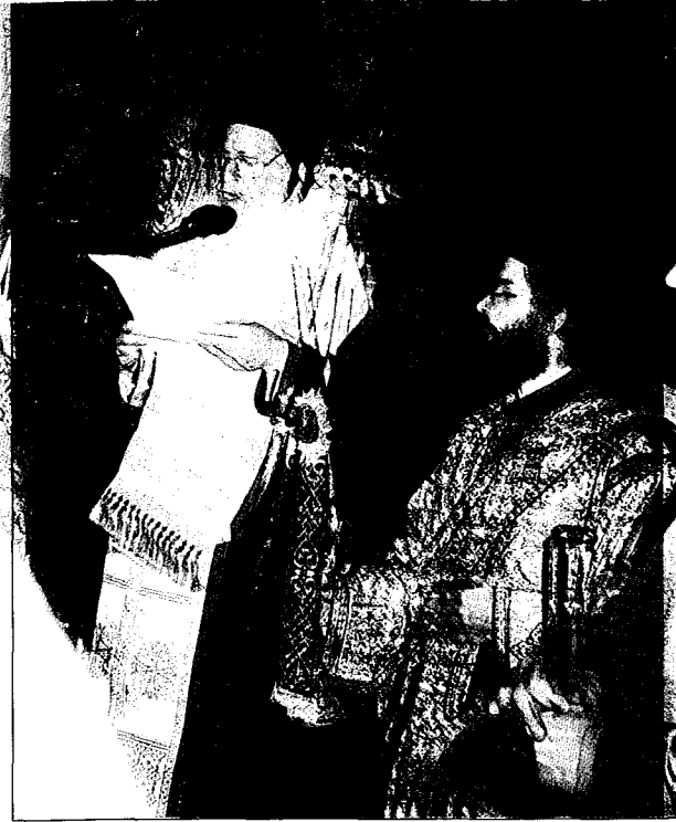
Ἡ Δοξολογία στο Καθολικὸ τῆς Ἱ. Μονῆς Εἰκοσιφοινίσσης.