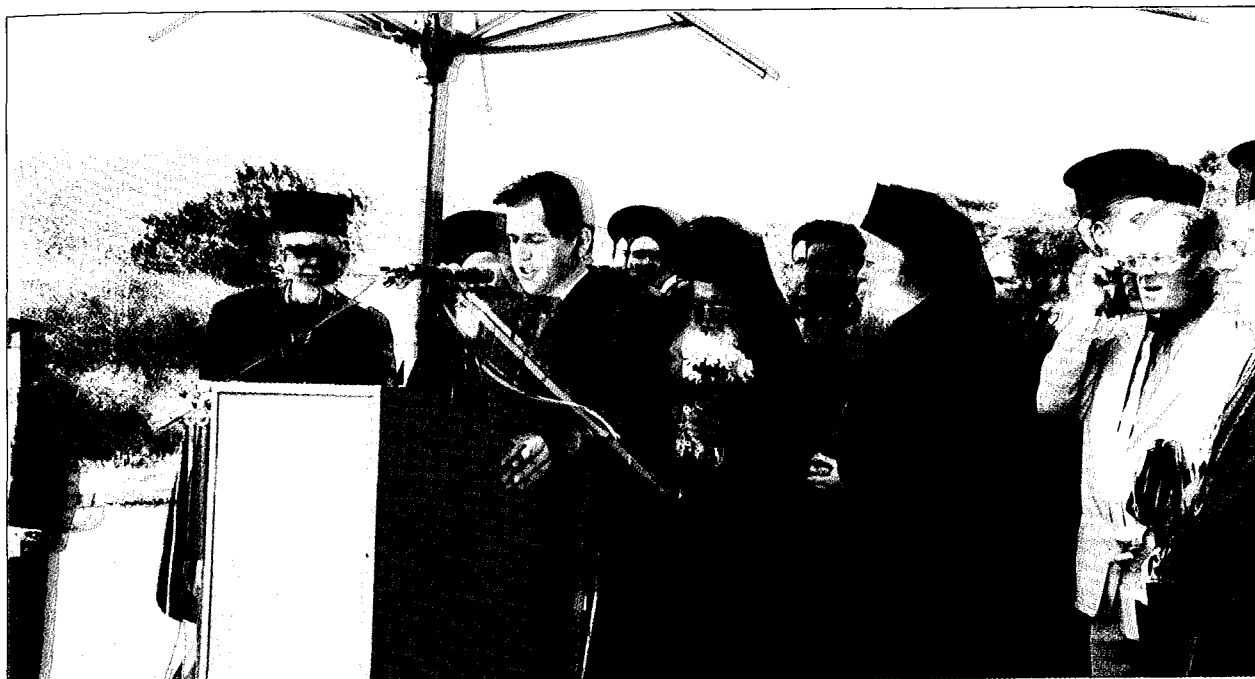
Υποδοχή στον Δήμο Βεργίνας.