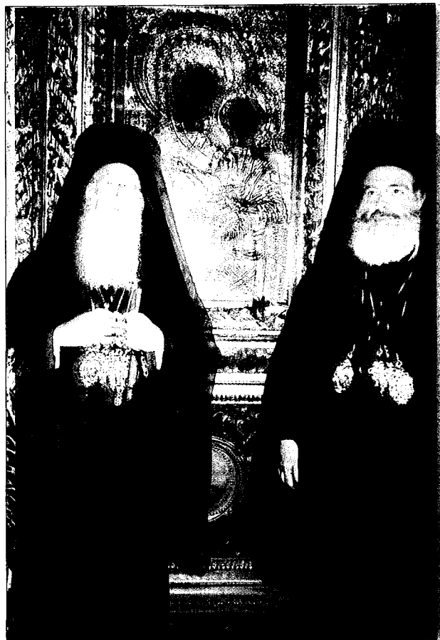
Στό Προσκύνημα της Παναγίας Μηχανιώνας.