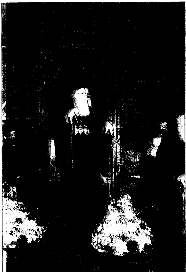
Δοξολογία στον Άγιο Γεώργιο Ροτόντας (Θεσσαλονίκη).