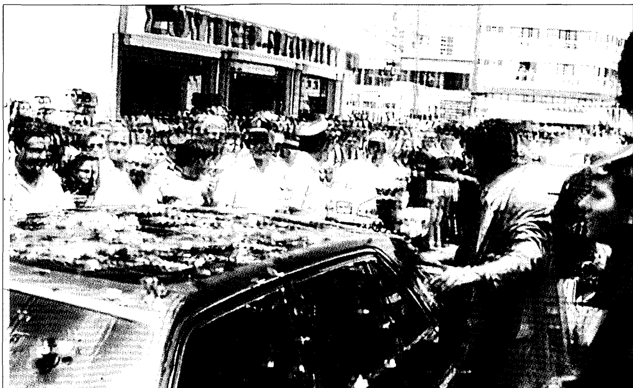
Οί χριστιανοί ραίνουν με άνθη τόν Παναγιώτατο Οικουμενικό Πατριάρχη στήν Ι. Μητρόπολη Γουμένισσης.