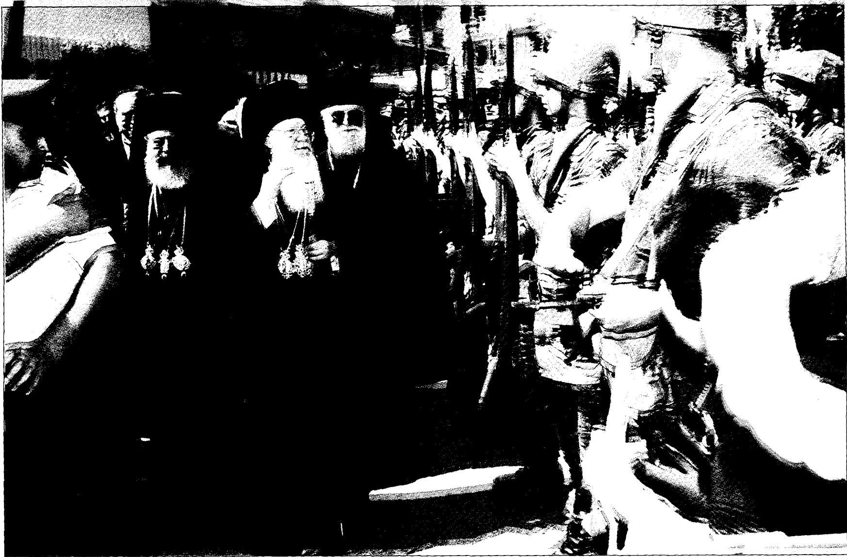
Ὁ Παναγιώτατος ἐπιθεωρεῖ τιμητικὸ ἄγγμα στὴν Ἱερὰ Μητρόπολη Νεαπόλεως καὶ Στανρουπόλεως συνοδευόμενος ἀπὸ τὸν Μακαριώτατο καὶ τὸν Σεβ. κ. Διονύσιο.