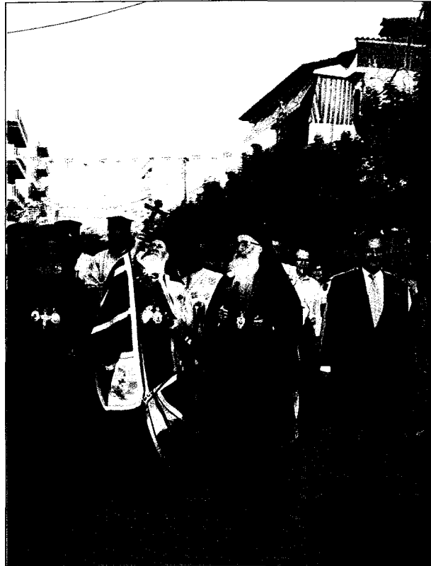
Υποδογή στόν Λαγκαδά. Τόν Παναγιώτατο συνοδεύουν ό Μακαριώτατος Αρχιεπίσκοπος κ. Χριστόδουλος, ό Σεβ. Μητροπολίτης Λαγκαδά κ. Σπυρίδων και ό Υπουργός Μακεδονίας - Θράκης κ. Μαγκριώτης.