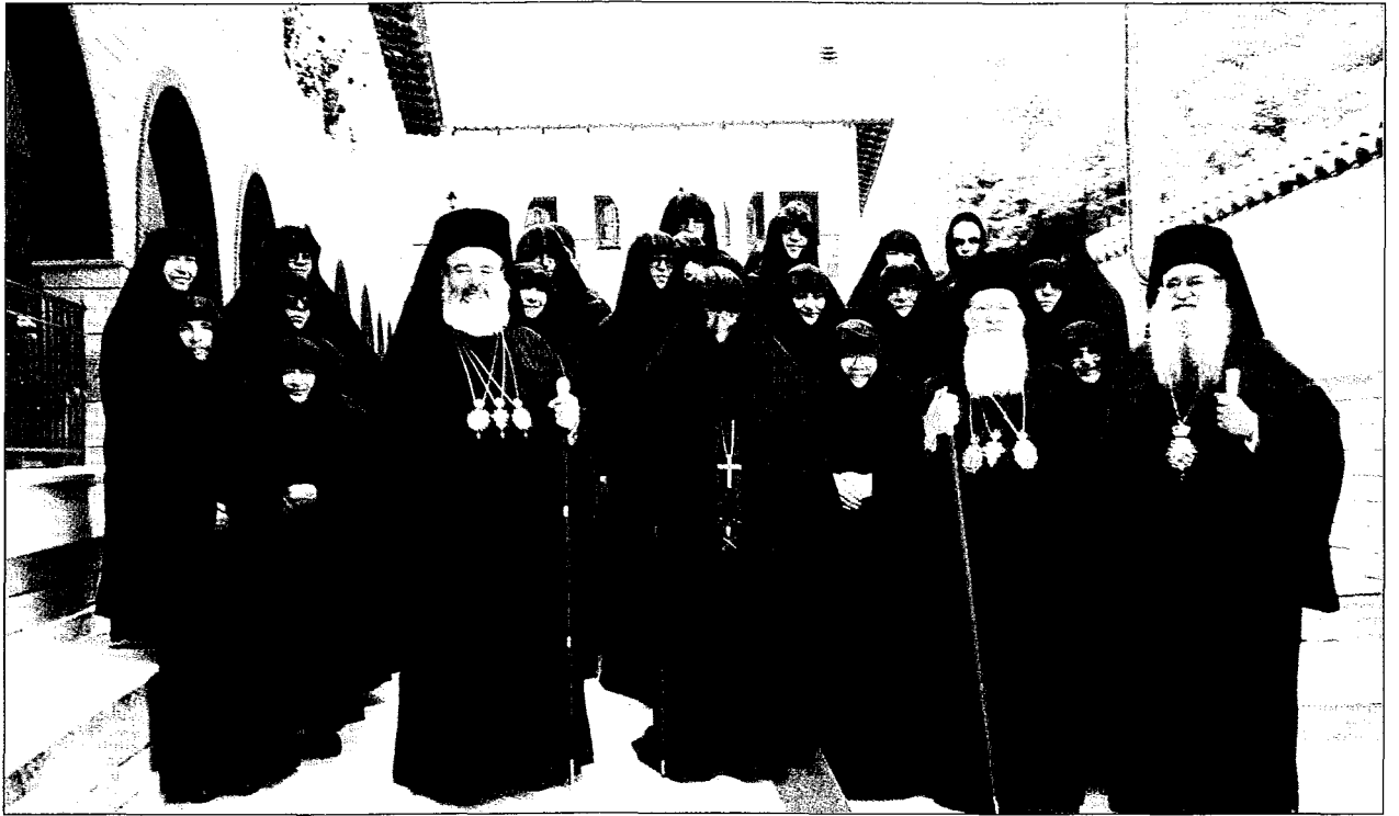
Οί δύο Προκαθήμενοι με τόν Σεβ. Μητροπολίτη Λράμας κ. Διονύσιο και τή μοναστική αδελφότητα τής Είκοσι-φονίσσης.