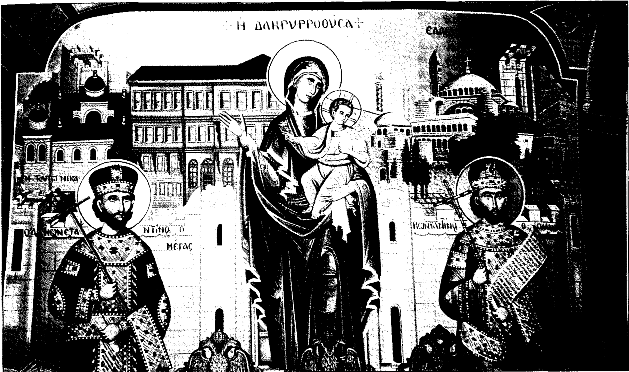
Ἡ Παναγία ἡ Δακρυρροοῦσα. Τοιχογραφία στό μητροπολιτικό παρεκκλήσιο Ἀρναίας. Εἰκονίζεται μεταξύ τοῦ Μ. Κωνσταντίνου καί τοῦ Κωνσταντίνου Παλαιολόγου.