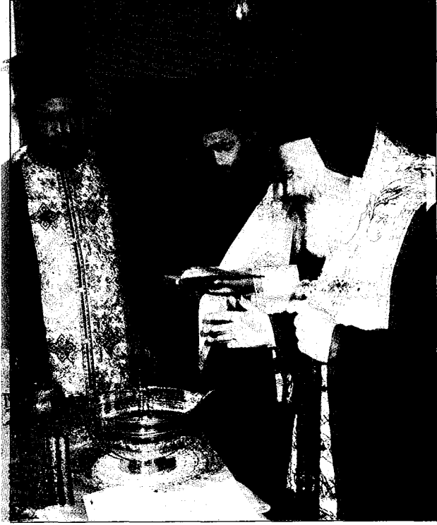
Ὁ Μακ. Ἀρχιεπίσκοπος κ. Χριστόδουλος τελεῖ τὸν Ἅγιασμό τῆς νέας πτέρυγας τῆς Ἱ. Μονῆς Εἰκοσιφοινίσσης.