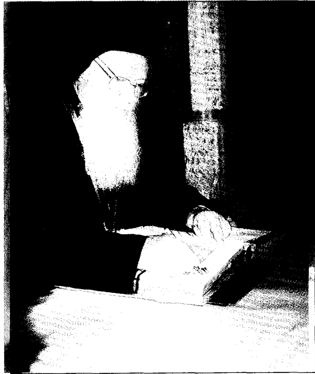
Ἡ Α.Θ.Π. ὁ Οἰκουμενικὸς Πατριάρχης υπέγραψε σὲ κάθε Δοξολογία τὰ ἱερά Εὐαγγέλια.