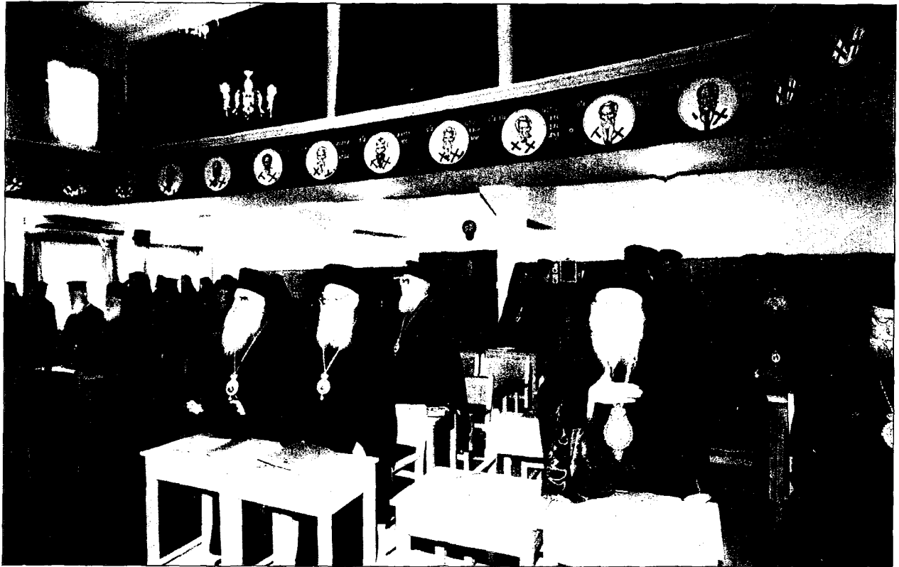
Σεβασμιώτατοι Ίεράρχαι - Σύεδροι κατά την έναρκτήριον Προσευχήν.

στός, ως Διδάσκαλος, Λυτρωτής και Ζωοδότης, είναι τὸ Α και τὸ Ω τῆς ζωῆς τῆς Ἐκκλησίας.