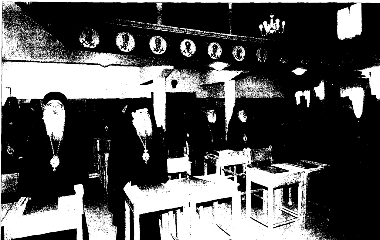
Σεβασμιώτατοι Ίεράρχαι - Σύεδροιο, κατὰ τὴν Ἐναρκτήριον Προσευχήν.