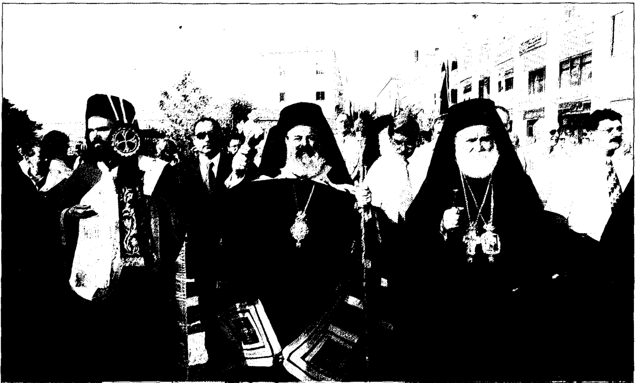
Άπό τήν ύποδοχήν εις τήν Ναζαρέτ.