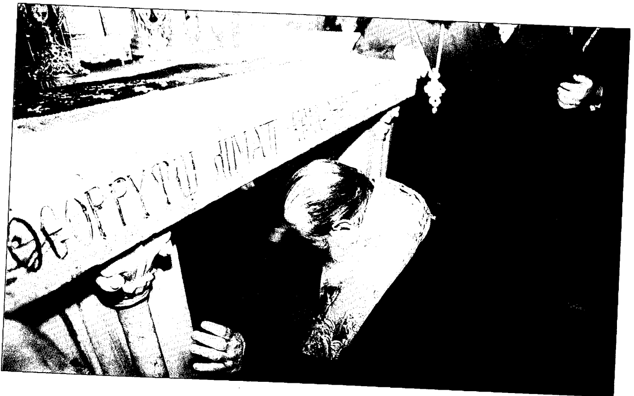
Ὁ Μακαριώτατος προσκυνῶν τὸν φρικτὸν βράχον τοῦ Γολγοθᾶ.