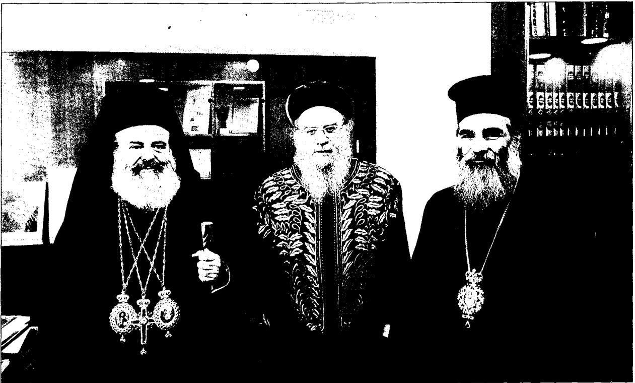
Άπο την επίσημον επίσκεψιν εις τον Αρχιεραββίνον του Κράτους του Ίσραήλ κ. Bakshi Doron.