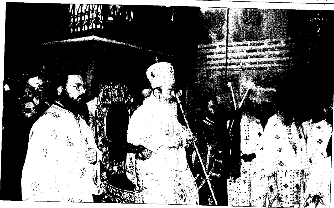
Μεταμεσονύκτιος Θεία Λειτουργία ἐν τῷ Ἱερῷ Κουβουκλίῳ τοῦ Παναγίου Τάφου.