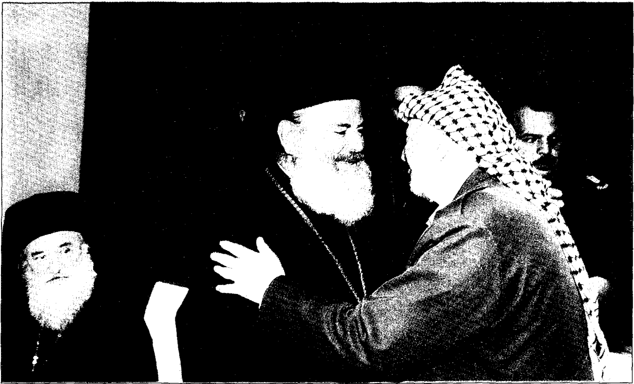
Έγκάρδιος χαιρετισμός υπό του Προέδρου τής Παλαιστινιακής Αυτόδιοικήσεως κ. Πασέρ Άραφάτ.