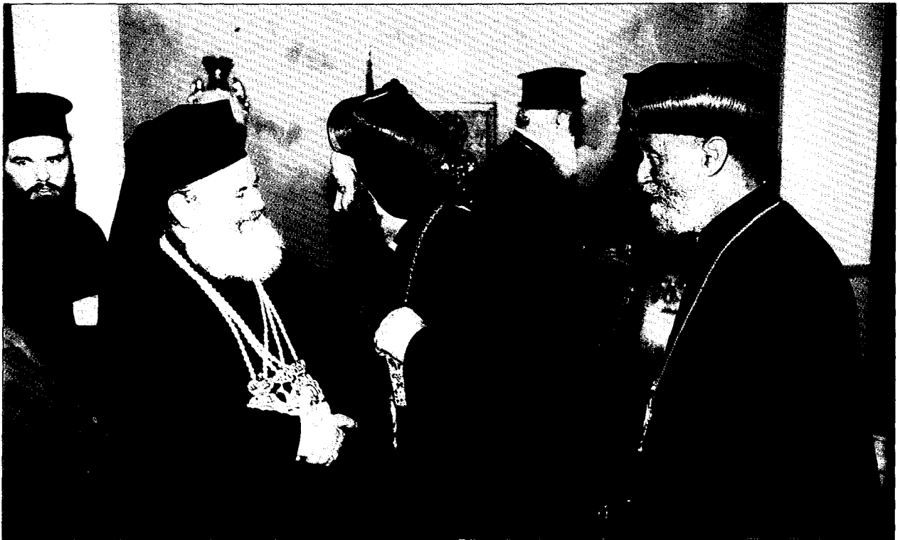
Έκπρόσωποι ξένων δογματών υποβάλλουν τας εϋχάς των εις τόν Μακαριώτατον.