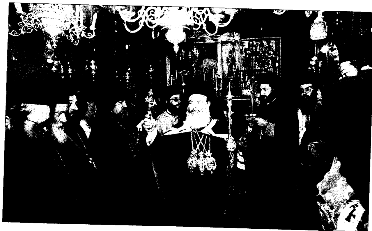
Ἡ ἀκολουθία τῶν Ἐγκωμίων ἐπὶ τῇ Κοιμήσει τῆς Ὑπεραγίας Θεοτόκου εἰς τὸ Θεομητορικὸν Μνήμα ἐν Γεθσημανῇ.