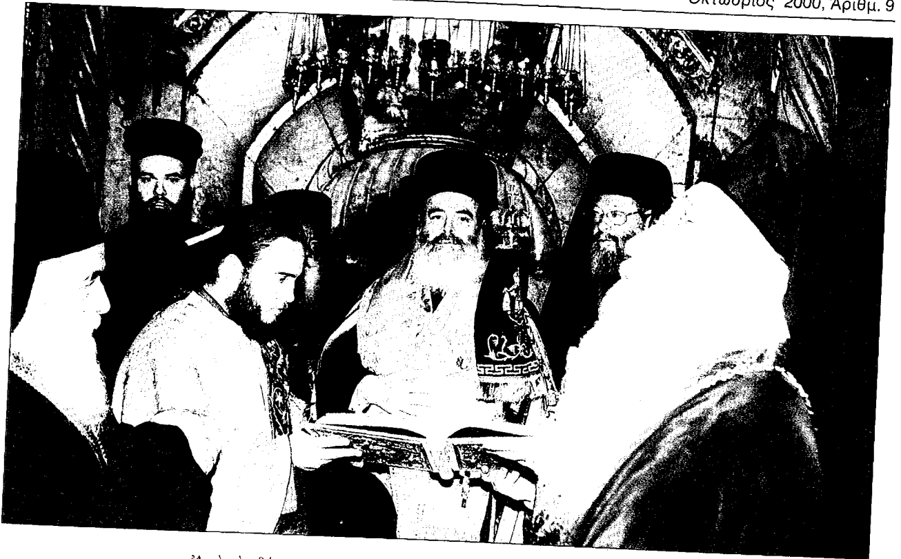
Άπό τήν δέησιν πρό τοῦ Ἱεροῦ Κουβουκλίου τοῦ Παναγίου Τάφου.