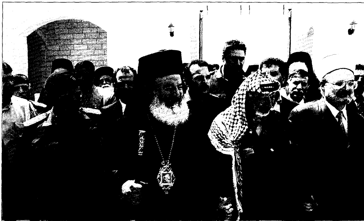
Άπο την ύποδοχήν του Μαχαριωτάτου ύπο του Προέδρου κ. Γιασερ Άραράτ.