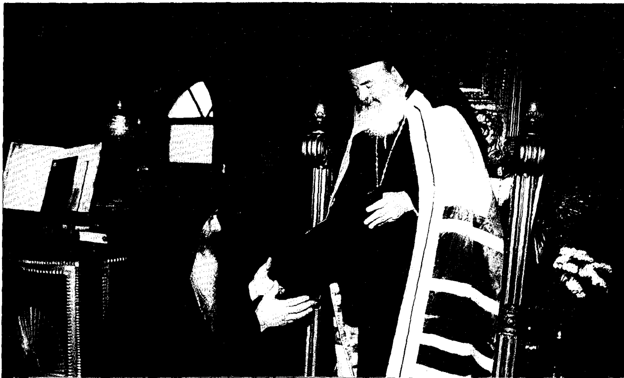
Άπο την Δέησιν εις την Ίερών Λαύραν του Άγιου Σάββα.