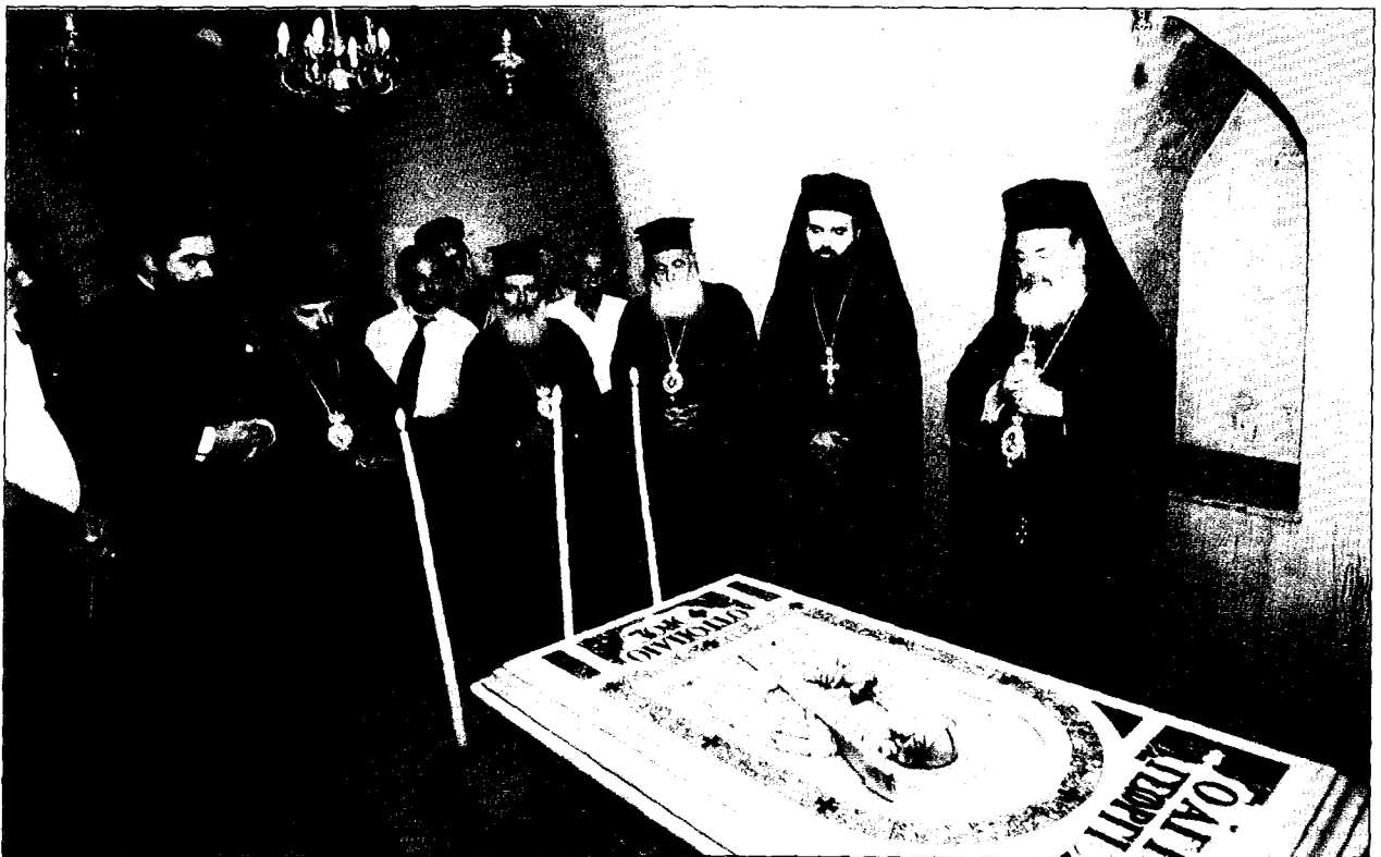
Ένώπιον του τάφου του Άγιου ένδόξου μεγαλομάρτυρος Γεωργίου του Τροπαιοφόρου εις Λύδδαν.