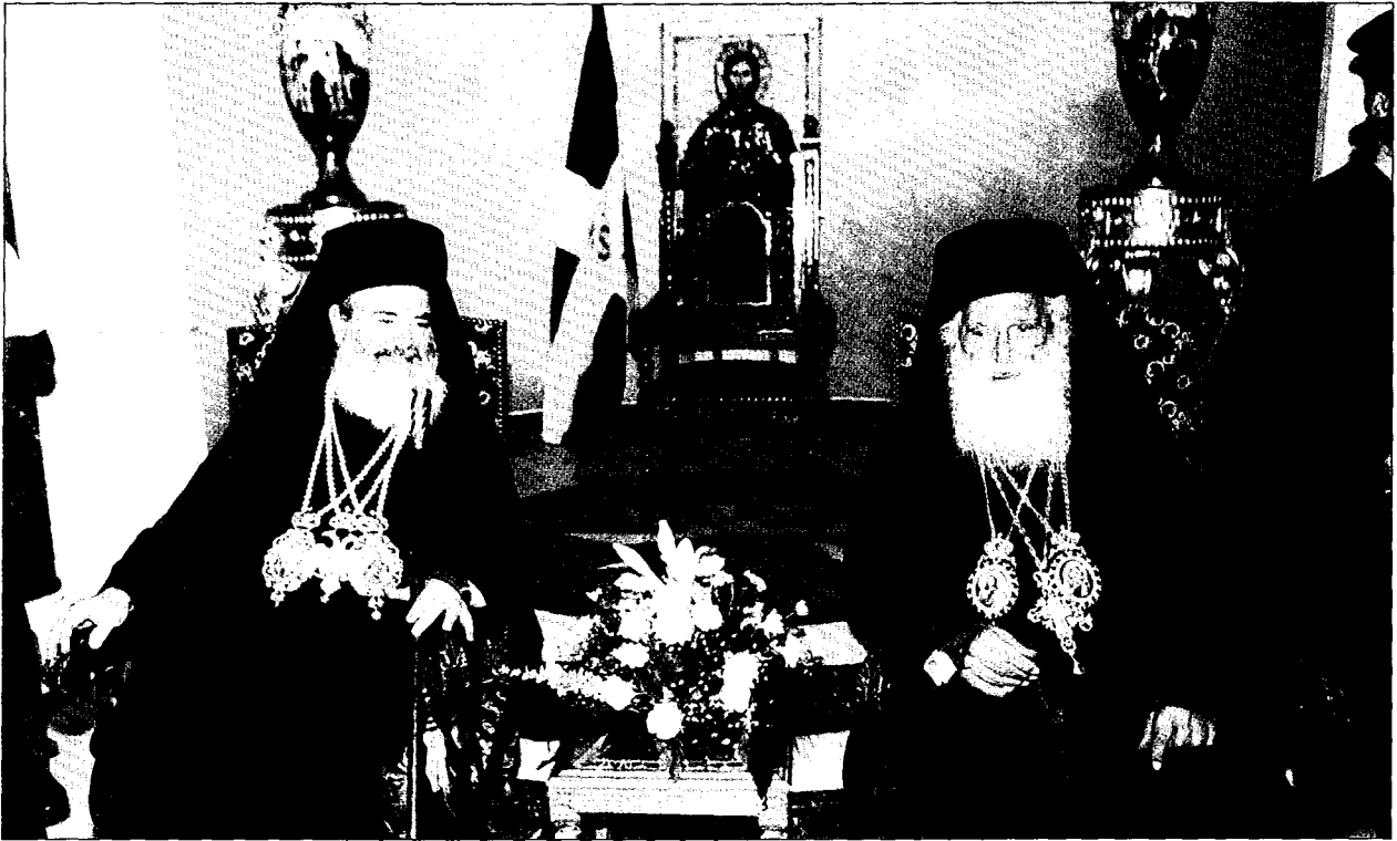
Οί δύο Προκαθήμενοι εις τήν Αΐθουσαν του Θρόνου του Πατριαρχείου Ιεροσολύμων.