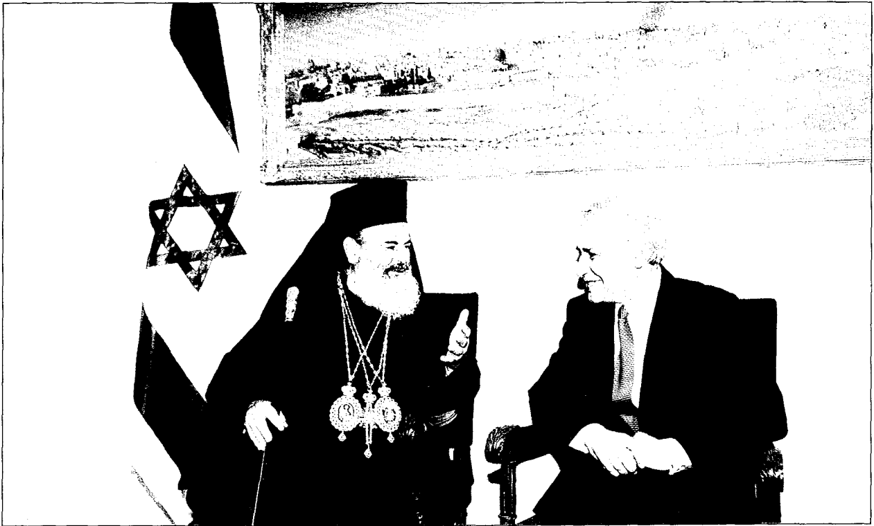
Άπο την επίσημον επίσκεψιν εις τον Πρόεδρον του Κράτους του Ίσραήλ κ. Moshe Kautsav.