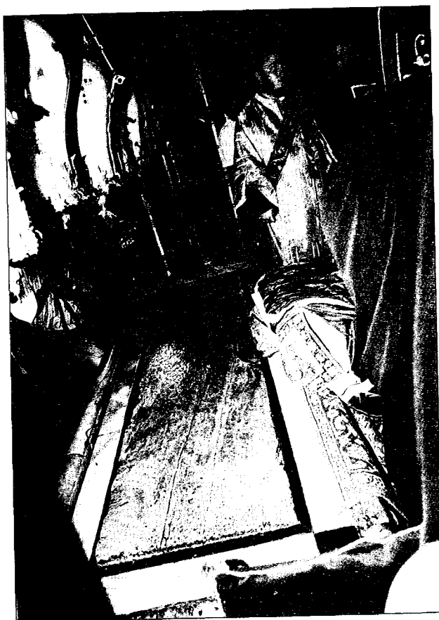
Πρό τής Άγίας Άποκαθηλώσεως.