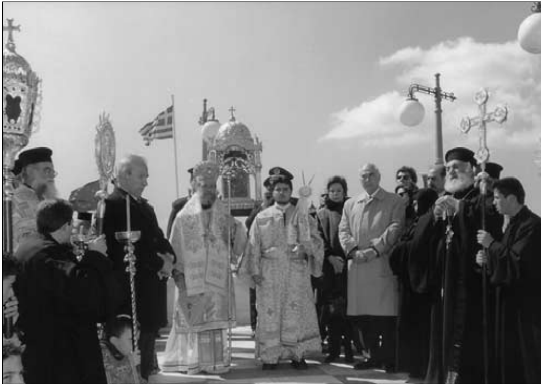
Ἀπὸ τὸν ἑορτασμό τοῦ Εὐαγγελισμοῦ τῆς Θεοτόκου στὸ Ἱ. Ἰδρυμα Εὐαγγελιστρίας Τήνου, χοροστατοῦντος τοῦ Σεβ. Μητροπολίτου Σύρου Δωροθέου Β΄.

σια τῆς ποιμαντικῆς του μέριμνας γιὰ τὴν ὀρθοτόμηση τοῦ λόγου τοῦ Θεοῦ καὶ τὴν πνευματικὴ προαγωγή τοῦ Χριστεπωνύμου πληρώματος τῆς τοπικῆς μας Ἐκκλησίας, ἐξήγγειλε: