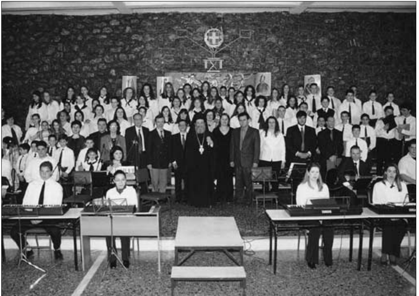
Ἀπὸ τὴν καθιερωμένη Μουσικὴ Ἐκδήλωση τῆς Χορωδίας - Ὀρχήστρας Νέων τῆς Ἱ. Μητροπόλεως Χαλκίδος γιὰ τὴν Ἐπανάσταση τοῦ '21 (16.3.2003).