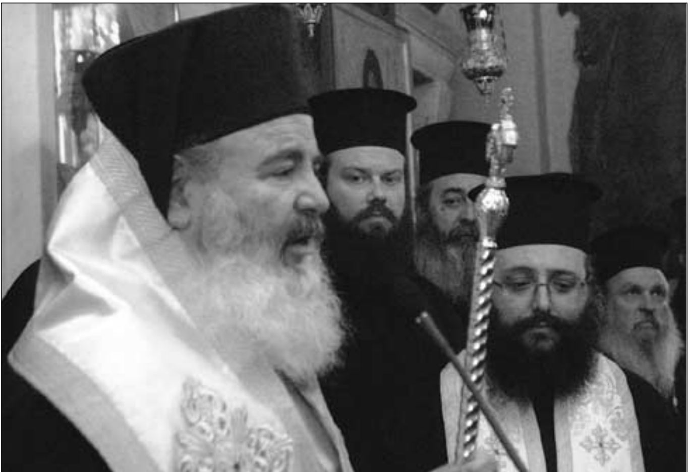
Ὁ Μακαριώτατος Ἀρχιεπίσκοπος Ἀθηνῶν καὶ πάσης Ἑλλάδος κ. Χριστόδουλος ἀναπέμπει δέηση ὑπὲρ τῆς εἰρήνης στὸ Συνοδικὸ Παρεκκλήσιο τῆς Ἱερᾶς Μονῆς Ἀσωμάτων Πετράκη (19.3.2003).

Ἡ πόλεμος θὰ διορθώσει αὐτὰ τὰ κακά, μόνο στίς προπαγανδιστικὲς ἀνακοινώσεις. Στὴν πραγματικότητα, οἱ γέροι στὸ Ἰράκ πεθαίνουν ἀβοήθητοι στοὺς δρόμους καὶ στὰ παρατημένα σπίτια τους. Οἱ δικοὶ τους δὲν εἶναι πιά ἐκεῖ. Κι ἂν εἶναι, θὰ κοιτάξουν πῶς θὰ βοηθήσουν τὰ παιδιὰ, ὄχι τοὺς γέροντες καὶ τοὺς ἄρρωστους. Ὅσοι μποροῦν νὰ διασχίσουν τὴν ἔρημο φεύγουν γιὰ τὴν Ἰορδανία καὶ τὴ Συρία. Ὅσοι μποροῦν νὰ διασχίσουν τὰ γεμάτα χιόνια καὶ ἀπόκρημα βουνά, καταφεύγουν στὸ