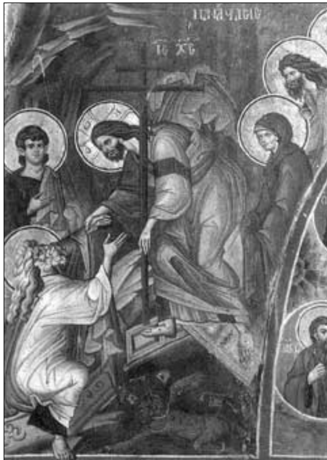
«Ἡ Ἀνάστασις». Ἰ. Μ. Βατοπεδίου

† Ὁ Κωνσταντινουπόλεως διάπυρος πρὸς Χριστὸν Ἀναστάντα εὐχέτης πάντων ὑμῶν