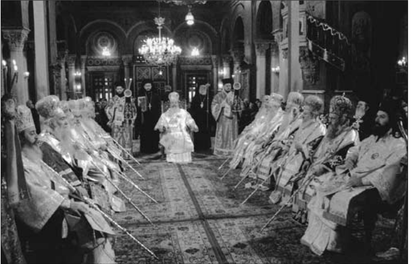
Ὁ Μακαριώτατος Ἀρχιεπίσκοπος Ἀθηνῶν καὶ πάσης Ἑλλάδος κ. Χριστόδουλος καὶ τὰ μέλη τῆς Διαρκoῦς Ἱερᾶς Συνόδου κατὰ τὸν ἑορτασμὸ τῆς Κυριακῆς τῆς Ὁρθοδοξίας (16.3.2003).