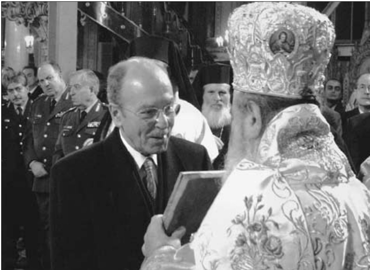
Ὁ Πρόεδρος τῆς Δημοκρατίας κ. Κωνσταντῖνος Στεφανόπουλος ἀσπάζεται τὴν Ἱερὰ Εἰκόνα τοῦ Δεσπότη Χριστοῦ, τὴν ὁποία προτείνει ὁ Μακαριώτατος Ἀρχιεπίσκοπος Ἀθηνῶν καὶ πάσης Ἑλλάδος κ. Χριστόδουλος μετὰ τὴν λιτάνευσιν τῶν Ἱερῶν Εἰκόνων (16.3.2003).

πότητα τοῦ Χριστοῦ εἶναι ἡ εἰκόνα τοῦ ἀοράτου Θεοῦ καὶ ἐπομένως μέσῳ τῆς ὁράσεως τοῦ Χριστοῦ ὁ ἄνθρωπος ὁρᾶται τὴν Θεότητα, ὅπως καὶ ὁ ἴδιος ὁ Κύριος εἶπε: «Ὁ ἔωρακώς ἐμέ ἔώρακε τὸν Πατέρα» 21 .