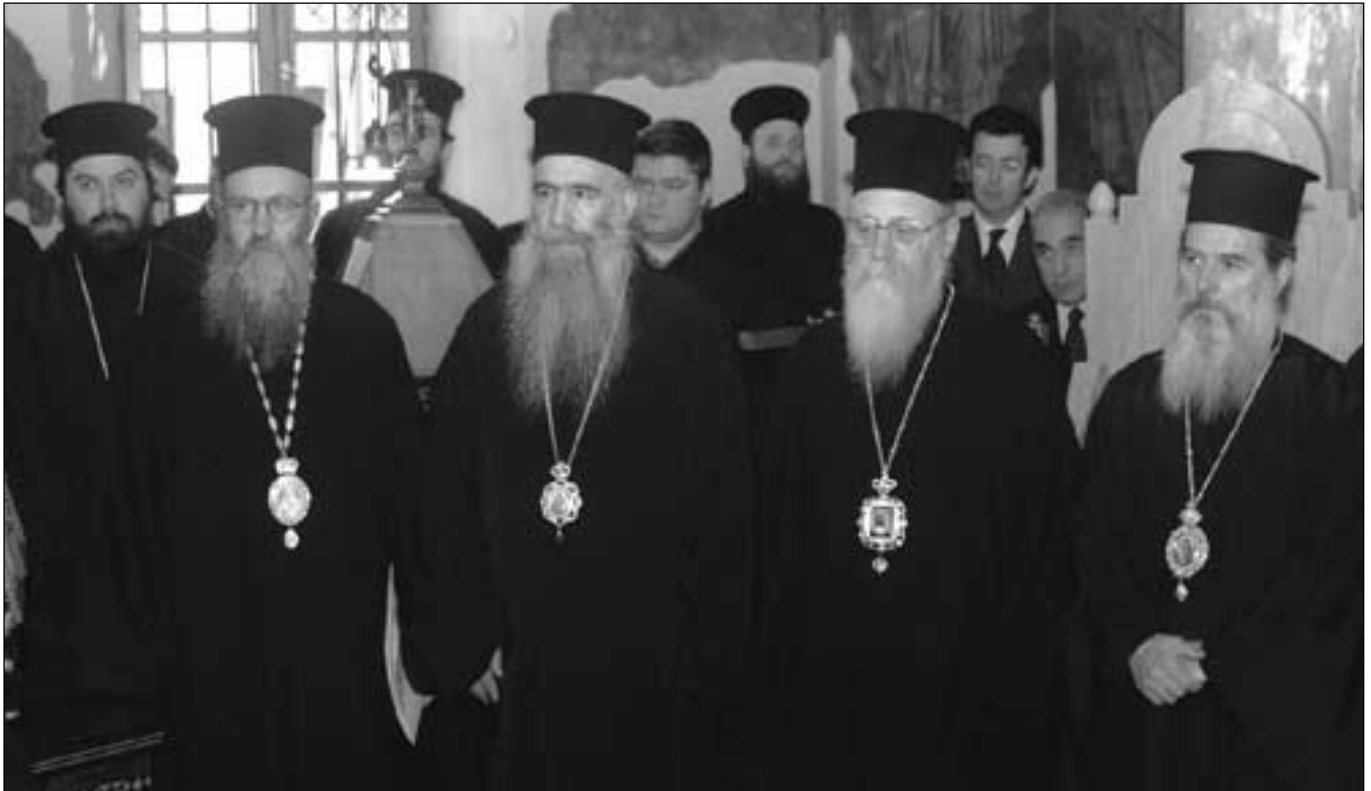
Μέλη τῆς Διαρκoῦς Ἱερᾶς Συνόδου συμπροσεύχονται ὑπὲρ τῆς εἰρήνης (19.3.2003).