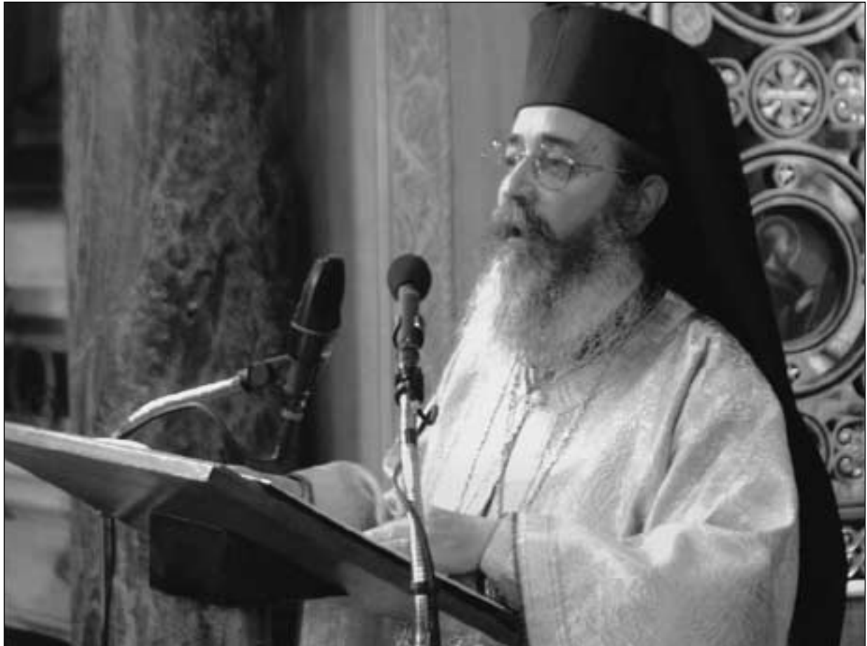
Ὁ Σεβασμιώτατος Μητροπολίτης Φθιώτιδος Νικόλαος ἦταν ὁ ὁμιλητὴς κατὰ τὸν πανηγυρικό ἐορτασμό τῆς Κυριακῆς τῆς Ὁρθοδοξίας στὸν Μητροπολιτικό Ναὸ Ἀθηνῶν (16/3/2003).

εἰκόνες καὶ μὲ τὴν Ἑβδόμη Οἰκουμενικὴ Σύνοδο (787 μ.Χ.) ἀπεφάνθη ἡ Ἐκκλησία, ὅτι ἡ τιμητικὴ προσκύνηση τῶν ἱερῶν εἰκόνων ἀποτελεῖ « ἔγκριτον καὶ θεάρεστον θεομοθεσίαν καὶ παράδοσιν τῆς Ἐκκλησίας » καὶ ὅτι « ἐν ταῖς Εἰκόσιν ὀρῶμεν τὰ ὑπὲρ ἡμῶν του Δεσπότου πάθη, τὸν Σταυρόν, τὸν Τάφον, τὸν ἄδην νεκρούμενον καὶ σκυλευόμενον, τῶν Μαρτύρων τοὺς ἄθλους, τοὺς στεφάνους αὐτὴν τὴν σωτηρίαν, ἣν ὁ πρῶτος ἡμῶν ἀθλοθέτης καὶ ἀθλοδότης καὶ στεφανίτης ἐν μέσῳ τῆς γῆς κατεργάσατο » 5 .