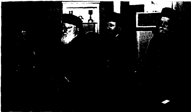
(Ἀπὸ ἀριστερὰ πρὸς τὰ δεξιὰ). Ὁ Σεβ. Μητροπολίτης Θήρας κ. Ἐπιφάνιος, ὁ Θεοφ. Ἐπίσκοπος Βελεστίνου κ. Δαμασκηνός, ὁ Θεοφ. Ἐπίσκοπος Φαναρίου κ. Ἀγαθάγγελος καὶ ὁ Θεοφ. Ἐπίσκοπος Κορωνείας κ. Παντελεήμων.

Ἡ Ἐπιτροπὴ Τύπου τῆς Ἱερᾶς Συνόδου τῆς Ἱεραρχίας (9-1-2003)