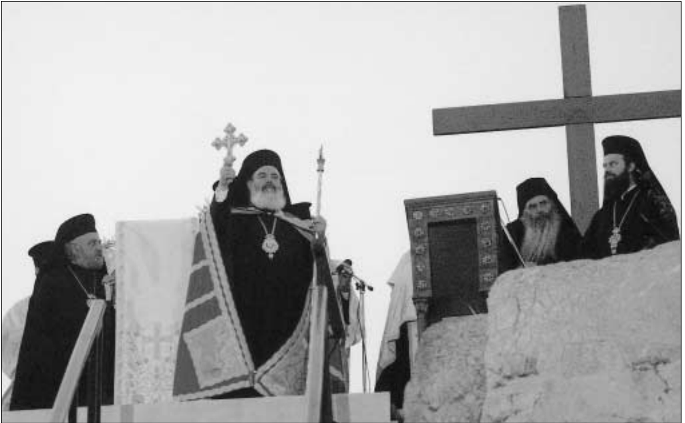
Ὁ Μακαριώτατος Ἀρχιεπίσκοπος Ἀθηνῶν καὶ πάσης Ἑλλάδος κ. Χριστόδουλος εὐλογεῖ τοὺς πιστοὺς κατὰ τὸν Πανηγυρικό Ἑσπερινὸ τῆς ἑορτῆς τοῦ Ἀποστόλου Παύλου (Ἄρειος Πάγος 29.6.2003).

ζεται ἀπὸ αὐτόν, ἀφοῦ ὅλες οἱ συνθήκες εἶναι προϊόντα συμβιβασμοῦ. Ὁ Εὐρωπαῖος ἄνθρωπος ἀρνεῖται τὴ λογικὴ του «οὐαὶ τῆς ἡττημένοις», τὴν ὁποία θεωρεῖ βάριβαρη. Ἀλλὰ δὲν μπορεῖ νὰ νοηθεῖ συμβιβασμὸς μὲ τὴν ἱστορία καὶ τὴ δημοκρατία, δὲν μποροῦμε νὰ βάζουμε σὲ παρένθεση τὴν ἱστορία καὶ τὴ δημοκρατία.