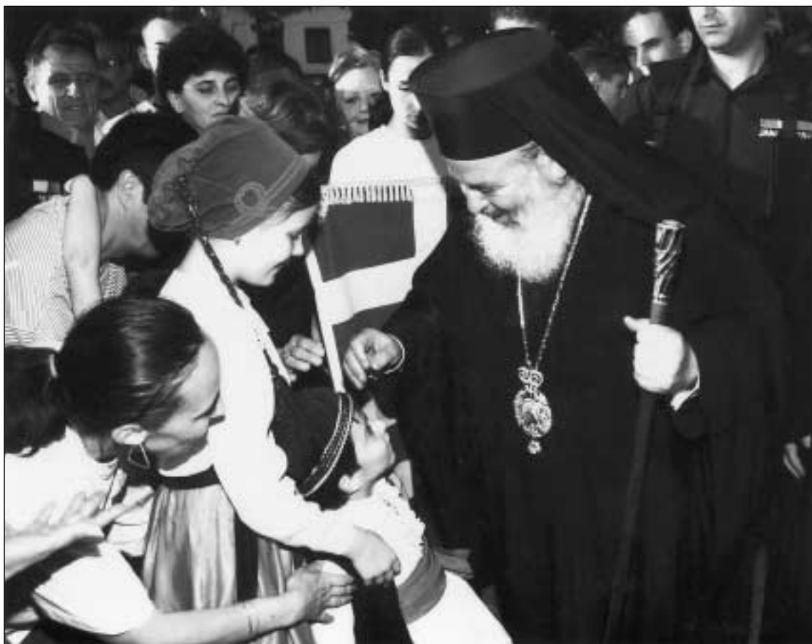
Ὁ Μακαριώτατος Ἀρχιεπίσκοπος Ἀθηνῶν καὶ πάσης Ἑλλάδος κ. Χριστόδουλος καὶ ἡ Ἀντιπροσωπεία τῆς Ἐκκλησίας τῆς Ἑλλάδος ἔτυχαν ἐνθουσιώδους ὑποδοχῆς ἀπὸ τοὺς Ἕλληνες μονίμους κατοίκους τῆς Κραϊόβα.

Ἡ Εἰρηνικὴ ἐπίσκεψη τοῦ Μακαριωτάτου Ἀρχιεπισκόπου Ἀθηνῶν καὶ πάσης Ἑλλάδος κ. Χριστοδούλου καὶ τῆς συνοδείας του στὴν Ρουμανία ἦταν εὐλογημένη καὶ συνετέλεσε στὴν μεγαλύτερη σύσφιγξη τῶν δεσμῶν μας μὲ τὴν ἀδελφὴ Ὁρθόδοξη Ἐκκλησία τῆς Ρουμανίας. Παρὰ τὸν μεγάλο κόπο τῶν συνεχῶν μετακινήσεων καὶ τῶν ἐκδηλώσεων δοξολογήσαμε τὸν Θεὸ γιὰ τὸ ταξίδι αὐτὸ καὶ εὐχηθήκαμε ὁ Θεὸς νὰ στερεώνη τοὺς ἀδελφούς μας Ρουμάνους στὴν πίστη τῶν Πατέρων μας καὶ στὴν εὐσέβεια τῆς Ὁρθοδόξου Παραδόσεως, μακριὰ ἀπὸ ἐθνοφυλετισμοὺς, οἱ ὅποιοι ὅπου ἀναπτύσσονται εἶναι συμφορὰ στὸ Σῶμα τῆς Ἐκκλησίας.