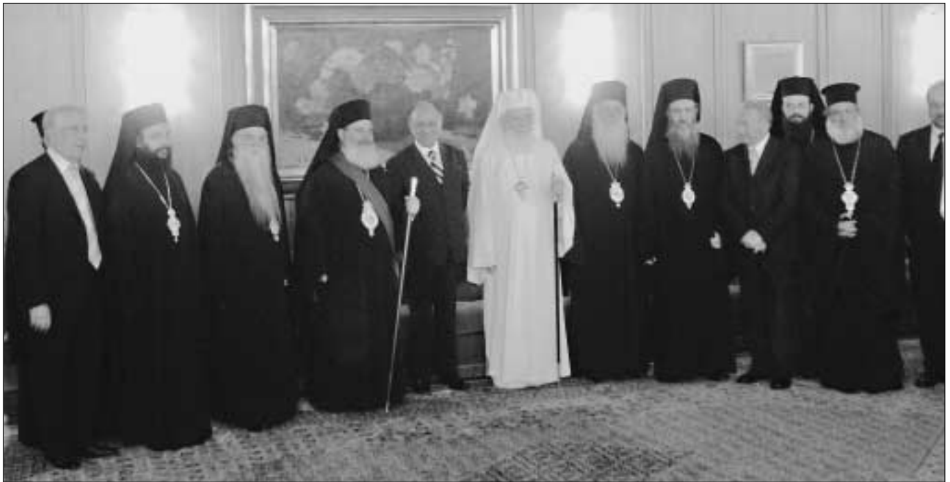
Ἀπὸ τὴ συνάντησι τοῦ Μακαριωτάτου Ἀρχιεπισκόπου Ἀθηνῶν καὶ πάσης Ἑλλάδος κ. Χριστοδοῦλου καὶ τῆς Ἀντιπροσωπείας τῆς Ἐκκλησίας τῆς Ἑλλάδος μετὸν Πρόεδρο τῆς Ρουμανίας κ. Ion Iliesku στὸ Cotroceni Palace (4.6.2003).

νικῆς καὶ συγχρονικῆς πνευματικῆς τῶν κληρονομίας, χωρὶς νὰ θίγεται μετὸν τρόπον αὐτὸν ἡ ἀρχὴ τῆς θρησκευτικῆς ἐλευθερίας δι' ὅλας τὰς Θρησκείας ἢ Ὁμολογίας.