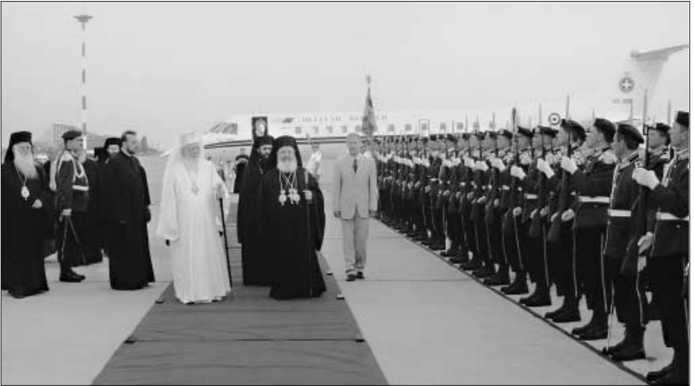
Ἀπὸ τὴν ἀφίξη τοῦ Μακαριωτάτου Ἀρχιεπισκόπου Ἀθηνῶν καὶ πάσης Ἑλλάδος κ. Χριστοδοῦλου καὶ τῆς Ἀντιπροσωπείας τῆς Ἐκκλησίας τῆς Ἑλλάδος, στὸ ἀεροδρόμιο τοῦ Βουκουρεστίου, ὅπου τοὺς ὑποδέχθηκε ὁ Μακαριώτατος Πατριάρχης Ρουμανίας κ. Θεόκτιστος (4.6.2003).

νε, θὰ ἐνδυναμώσει τὴν παρουσία τῆς Ὁρθοδοξίας στὴν Ἑνωμένη Εὐρώπη. Ἀναφερόμενος στὸν Πατριάρχη Θεόκτιστο τὸν χαρακτήρισε μεγάλο κεφάλαιο καὶ πολυτίμη παρακαταθήκη γιὰ τὸ λαὸ τῆς Ρουμανίας. «Ὁ ρόλος τῶν Ἐκκλησιῶν, κατέληξε, ἀναδεικνύεται πολὺ σημαντικός. Γι' αὐτὸ θὰ συνενώσουμε τὶς δυνάμεις μας γιὰ νὰ δώσουμε τὴ μαρτυρία τῆς Ὁρθόδοξης πίστεως».