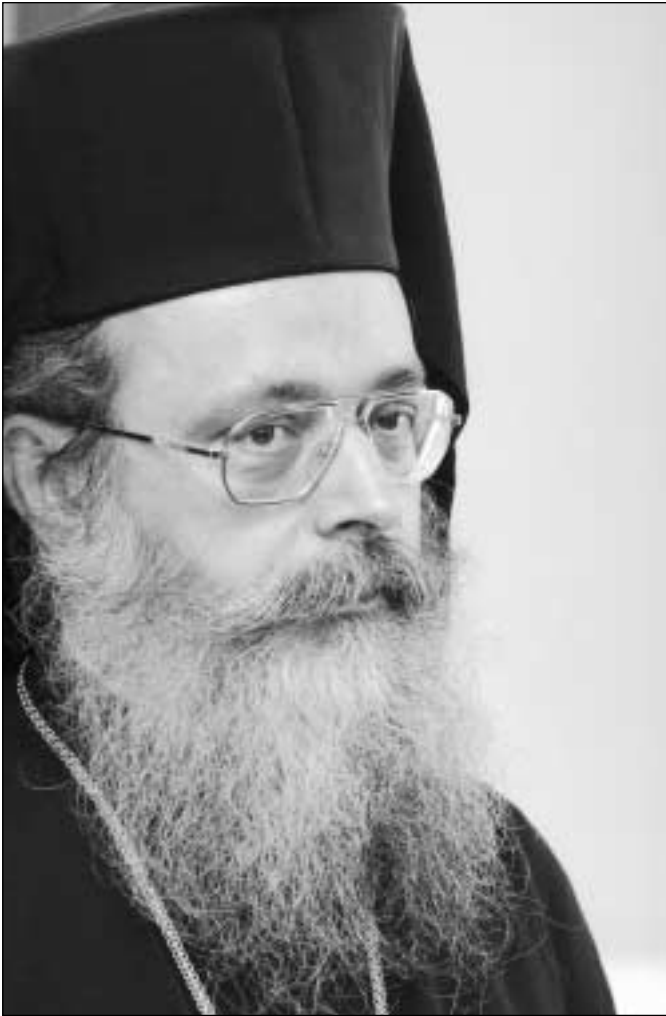
Ὁ νέος Μητροπολίτης Ζιχνῶν καὶ Νευροκοπίου Σεβ. κ. Ἱερόθεος.

Μεγάλο καὶ βαρὺ τὸ χρέος πὺ ἀναλαμβάνω. Ἀνίσχυρες εἶναι οἱ πνευματικὲς καὶ ἠθικὲς μου δυνάμεις. Θὰ τολμήσω ὁμως. Ἡ τόλμη εἶναι τὸ γνῶρισμα τῶν Μαθητῶν τοῦ Χριστοῦ. Ἡ διακονία τοῦ Ἐπισκόπου στὴν Ἐκκλησία δὲν μπορεῖ, παρὰ νὰ ᾿ναι ἡ τόλμη μιᾶς τόλμης. Ἡ τόλμη καὶ τὸ θαῦμα ἐξ᾿ἄλλου εἶναι τὰ ἀκριβὰ παιδιά τῆς πίστεως. Ἐρχομαι –καὶ ἰδοὺ ἐγὼ– ἔχοντας στὴν καρδιά μου πολλὴ τόλμη καὶ ἀφειδώλευτη ἀγάπη γιὰ ὅλους σας. Καὶ λέγοντας τόλμη, ἐννοῶ ἀσφαλῶς διάθεση γιὰ πνευματικὴ διακονία καὶ ἀνύστακτη μέριμνα γιὰ τὴν κατὰ Χριστὸ μόρφωση τοῦ ποιμνίου, τοῦ ὁποῖου οἱ ἐκδηλώσεις συμπαραστάσεως ἤδη γράφτηκαν στὴν καρδιά μου μὲ χρυσὰ γράμματα. Δώστε μου τὰ χέρια σας. Πάρτε τὴν καρδιά μου. Γιατὶ ἐδῶ δὲν ἤρθα ὡς πάροικος ἢ παρεπίδημος. Ἐδῶ ἤρθα νὰ διακονήσω. Ἐδῶ ἤρθα νὰ σωθῶ! Νὰ γιατί ἡ καρδιά μου χτυπάει γι’ αὐτὸν τὸν τόπο καὶ γι’ αὐτὸν τὸν λαό, τοῦ ὁποῖου τὰ ἦθη καὶ ἔθιμα