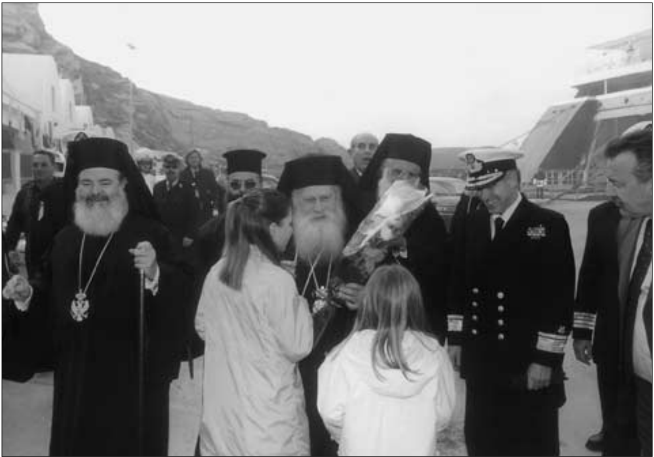
Ἀπό τὴν ὑποδοχὴ τοῦ Σεβ. Μητροπολίτου Θήρας, Ἀμοργοῦ καὶ Νήσων κ. Ἐπιφανίου (8.2.2003)

σίας, τοῦ Μακαριωτάτου Ἀρχιεπισκόπου μας, τῆς σεπτῆς Ἱεραρχίας καὶ τοῦ λαοῦ τοῦ Θεοῦ. Ἄλλωστε, τίποτε ἄλλο δὲν φιλοδοξῶ νὰ εἶμαι, παρὰ μόνο πιστὸς ὑπηρετῆς καὶ διάκονος, ἐντολοδόχος τῶν θείων τοῦ Χριστοῦ βουλῶν, νὰ μεταλαμπαδεύω τὴ Χάρη Του καὶ τὴν Ἀλήθεια Του στὶς καρδιές τῶν πιστῶν καὶ νὰ ἐργάζομαι γιὰ τὴ σωτηρία τους. Ὡς Ἐπίσκοπος, δὲν ἔρχομαι νὰ ἐπιτελέσω δικό μου ἔργο, ἀλλὰ μόνο γιὰ νὰ γίνω εὐχρηστο ὄργανο τοῦ μεγάλου Ἀρχιερέα Χριστοῦ καὶ σύμφωνα μὲ τὸ αἰώνιο πρότυπό Του νὰ θυσιάσω τὴ ζωὴ μου ὑπὲρ τοῦ ποιμνίου.