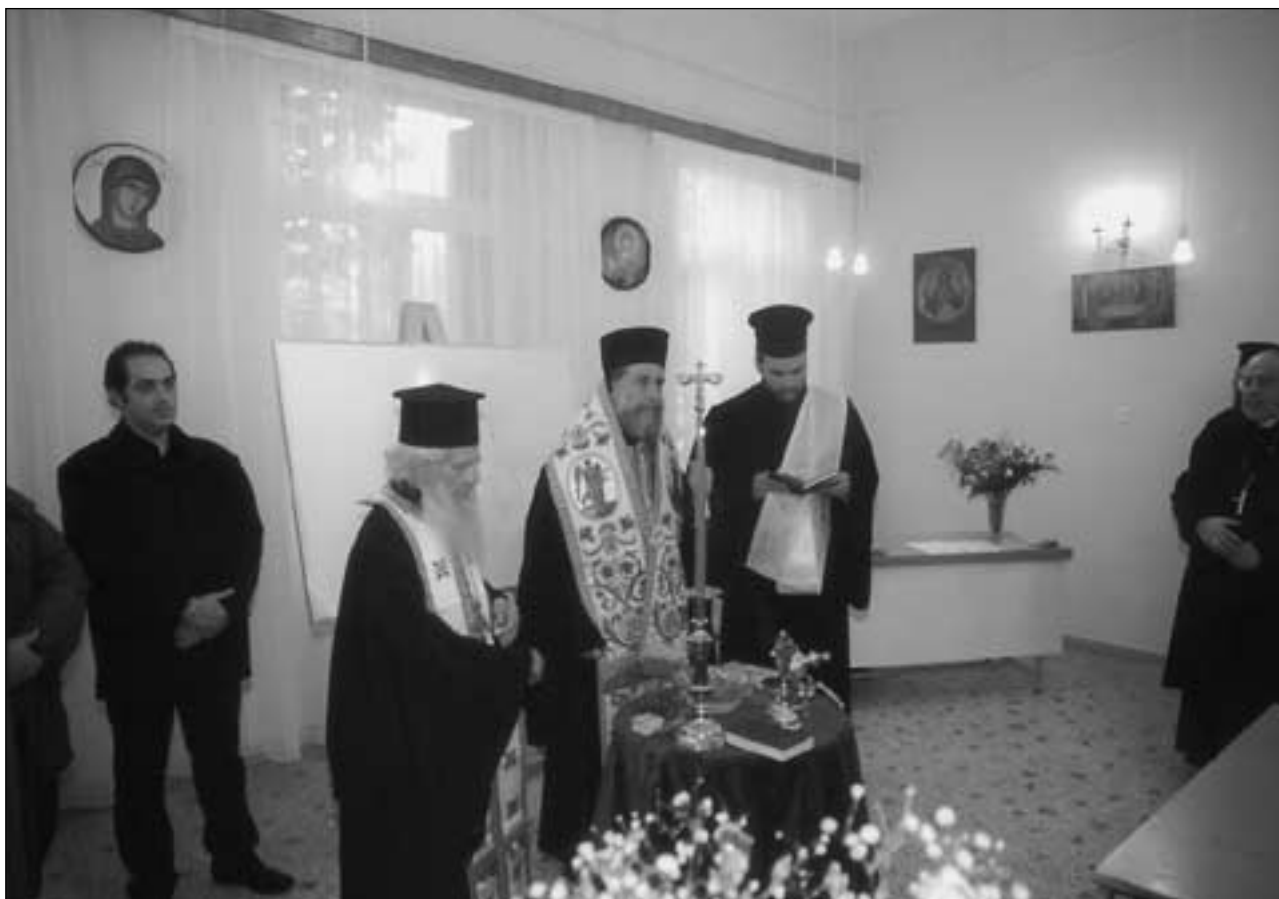
Ἀπὸ τὰ ἐγκαίνια τοῦ Ἐργαστηρίου Ἀγιογραφίας τῆς Ἱερᾶς Μητροπόλεως Σύρου στὴν Ἐρμούπολη, 3.3.2003.

Τὴν Δευτέρα 3η Μαρτίου, πραγματοποιήθηκαν τὰ ἐγκαίνια τοῦ Ἐργαστηρίου Ἀγιογραφίας τῆς Ἱερᾶς Μητροπόλεως, στὴν Ἐρμούπολη. Κατὰ τὴν ὁμιλία του πρὸς τοὺς Χριστιανούς, οἱ ὁποῖοι κατέκλυσαν τὴν αἴθουσα τοῦ Ἐργαστηρίου, ὁ Σεβασμιώτατος κ. Δωρόθεος Β' ἐξέφρασε τὴν χαρὰ του γιὰ τὴν ὑλοποίηση τῆς νέας αὐτῆς δραστηριότητος τῆς τοπικῆς μας Ἐκκλησίας, ἐπεσήμανε ὅτι ἡ Ἐκκλησία εἶναι κοιτίδα πολιτισμοῦ καὶ χαρακτήρισε τὴν βυζαντινὴ ἀγιογραφία, μία ἀπὸ τὶς ωραιότερες ἐκφράσεις Της, προτρέποντας τοὺς περὶ αὐτοῦ ἀμφισβητοῦντες νὰ ἐντρυφήσουν στὰ ἐκκλησιαστικὰ μνημεῖα καὶ κειμήλια. Ἀναφερόμενος στὴν ἀπόφαση τῆς δημιουργίας τοῦ Ἐργαστηρίου, εἶπε ὅτι αὐτὴ ὑποκινήθηκε ἀπὸ τρεῖς μόνον ἀνθρώπους καὶ ἀπευθυνόμενος πρὸς τοὺς πενήντα πρῶτους μαθητές, εὐχήθηκε νὰ κατα-