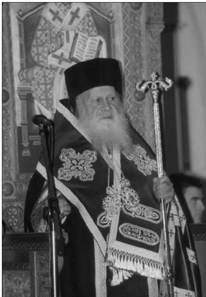
Ἀπὸ τὴν ἐνθρόνισή τοῦ Σεβ. Μητροπολίτου Θήρας, Ἄμοργου καὶ Νήσων κ. Ἐπιφανίου (8.2.2003)

Ἡ μικρὰ τοπικὴ μας Ἐκκλησία χαιρεῖ σήμερα χαρὰ μεγάλη καὶ ἡ αἰτία τῆς χαρᾶς ἐκπηγάζει ἀπὸ τὴν ἀγαπῶσα τὸ ταπεινὸν πρόσωπό μου καρδιά Σας! Μὲ πολὺ πατρικὸ ἐνδιαφέρον ἐπιβλέπατε, στὴν μικρὴ καὶ ἀκριτικὴ αὐτὴ Μητρόπολη καὶ μεριμνήσατε, μετὰ τὴν παραδειγματικὴ πράξη τῆς ἐκούσιας παραιτήσεως τοῦ Σεβασμιωτάτου Ποιμενάρχου μας κ. Παντελεήμονος, νὰ πληρωθεῖ τάχιστα. Ἔχετε τὴν εἰλικρινῆ ἀγάπη καὶ τὴν βαθυτάτη εὐγνωμοσύνη τόσοσιν ἐμοῦ προσωπικὰ, ὅσον καὶ τοῦ ἱεροῦ κλήρου καὶ τοῦ λαοῦ μας. Ὡς ἐπίτιμος δημότης Ἄμοργου, ἐπιτρέψατέ μας νὰ πιστεύουμε ὅτι κατὰ κάποιον τρόπο ἀνήκετε καὶ στὴ Μητρόπόλὴ μας, τὴν ὁποία παρακαλοῦμε νὰ θεωρεῖτε καὶ νὰ αἰσθάνεσθε καὶ ἰδικὴ Σας. Θὰ ἀποτελεῖ ἰδιαίτερη εὐλογία καὶ αἰτία τιμῆς πολλῆς καὶ χαρᾶς γιὰ ὅλους μας νὰ Σᾶς ὑποδεχόμαστε πολὺ συχνὰ στὴν Ἄμοργό, ἀλλὰ καὶ ἐδῶ στὴ Θήρα, ἀφοῦ καὶ ἐκεῖ καὶ ἐδῶ, Σᾶς ἀγαποῦμε, Σᾶς σεβόμαστε καὶ Σᾶς τιμοῦμε εἰλικρινὰ ὡς Πατέρα μας.