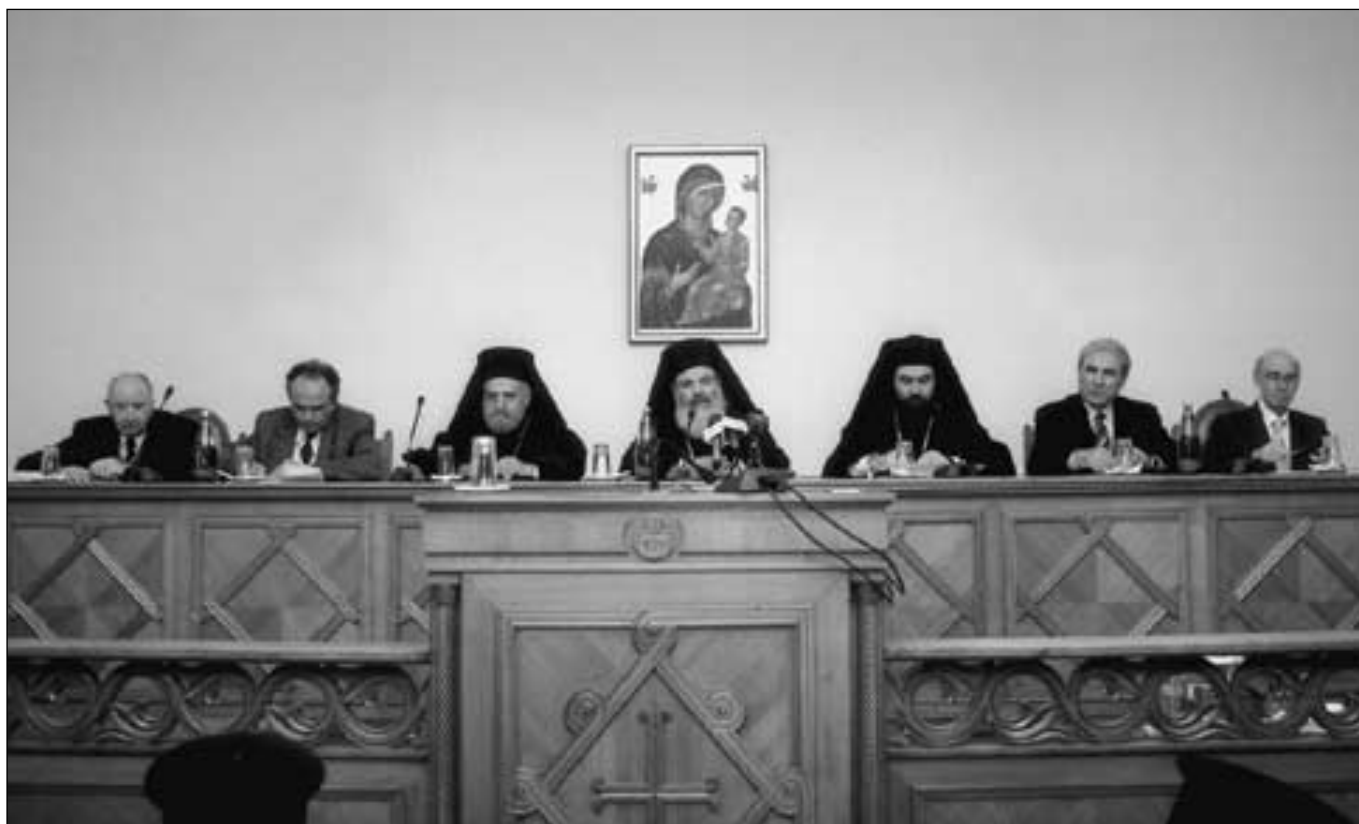
Ὁ Μακαριώτατος Ἀρχιεπίσκοπος Ἀθηνῶν καὶ πάσης Ἑλλάδος κ. Χριστόδουλος καὶ τὸ Προεδρεῖο τῆς Ἡμερίδος πού διοργανώθηκε ἀπὸ τὴν Ἱερά Σύνοδο τῆς Ἐκκλησίας τῆς Ἑλλάδος μὲ συμμετοχὴ τῶν καθηγητῶν τῶν Θεολογικῶν Σχολῶν Ἀθηνῶν καὶ Θεσσαλονίκης (6/2/2003)

ἀπολογητικῆς ἐπιστολῆς πρὸς τὸν πάπαν Νικόλαον: «Βίαν γὰρ ὑπέστημεν, καὶ ἠλίκην θεός, ᾧ πάντα καὶ τὰ κρύφια πεφανέρωται, αὐτὸς συνεπίσταται· συνεσχέθημεν ἄκοντες· κακούργοι ἴσα καθεύροχθημεν· ἐτηρούμεθα φυλασσόμενοι· ἐψηφίσθημεν ἀνανεύοντες» 20 .