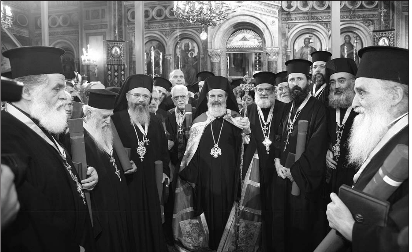
Ὁ Μακαριώτατος Ἀρχιεπίσκοπος Ἀθηνῶν καὶ πάσης Ἑλλάδος κ. Χριστόδουλος μετὰ τοὺς τιμηθέντες μετὰ τὸν Χρυσὸ Σταυρὸ τοῦ Ἀποστόλου Παύλου.

ραγωγὸ τους εἶχαν τὸ Ἅγιο Πνεῦμα. Ὁ ἀπόστολος Παῦλος ἔγραφε «οὐχ ὅτι ἤδη ἔλαβον ἢ ἤδη τετελείωμαι, διώκω δὲ εἰ καὶ καταλάβω, ἐφ' ᾧ καὶ κατελήφθην ὑπὸ Χριστοῦ» 15 . Ἡ παράδοσή μας στὸν Χριστὸ δὲν ἀποτελεῖ καταπτώση, ἀλλὰ τὸ μέγιστο πνευματικὸ κατόρθωμα τοῦ Χριστιανοῦ.