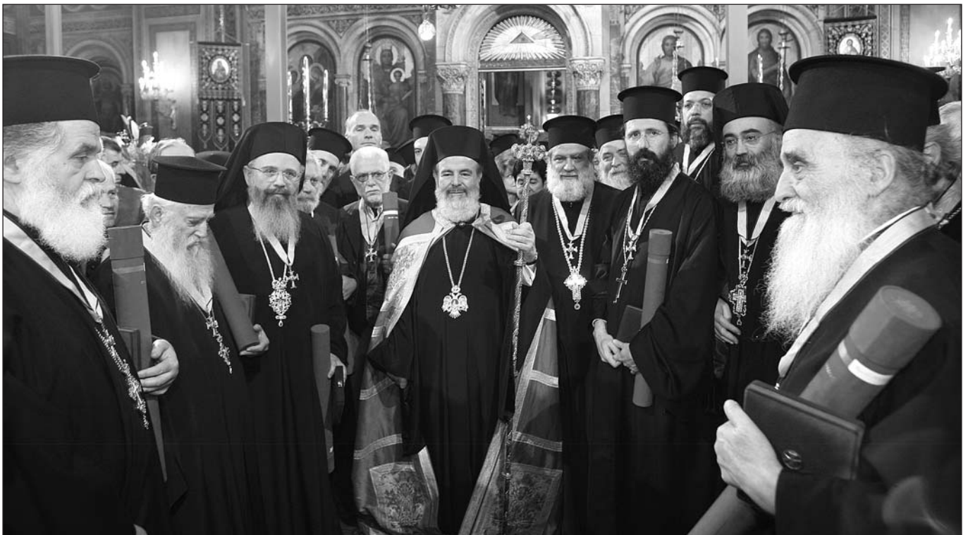
Ὁ Μακαριώτατος Ἀρχιεπίσκοπος Ἀθηνῶν καὶ πάσης Ἑλλάδος κ. Χριστόδουλος με τοὺς τιμηθέντες με τὸν Χρυσὸ Σταυρὸ τοῦ Ἀποστόλου Παύλου.

Τὴν Δευτέρα 13 Μαρτίου, ὁ Πρέσβης τῆς ἐν Ἀθήναις Ρωσικῆς Ὁμοσπονδίας κ. Ἀντρέι Βντόβιν παρέθεσε δεῖπνο πρὸς τιμὴν τοῦ Μακαριωτάτου Ἀρχιεπισκόπου Ἀθηνῶν καὶ πάσης Ἑλλάδος κ. Χριστοδούλου καὶ τῶν Συνοδικῶν Ἀρχιερέων, μὲ τὴν εὐκαιρία τῆς ἐορτῆς τῆς Ὁρθοδοξίας. Τὸ γεγονός αὐτὸ λαμβάνει χώρα γιὰ ἑβδομῆ συνεχῆ χρονιά σὲ ἀνταπόδοση τῆς ἀπὸ σειρὰ ἐτῶν δεξιώσεως, τὴν ὁποία ὀργανώνει ἡ ἑλληνικὴ Πρεσβεία στὴ Μόσχα πρὸς τιμὴν τοῦ Μακαριωτάτου Πατριάρχου Μόσχας καὶ πάσης Ρωσίας κ. Ἀλεξίου.