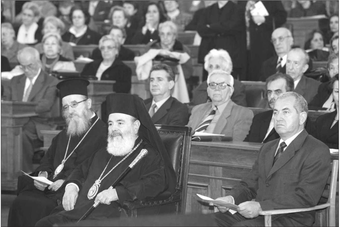
Ὁ Ἀρχιεπίσκοπος Ἀθηνῶν καὶ πάσης Ἑλλάδος κ. Χριστόδουλος στὴν ἐκδήλωση γιὰ τὰ 180 χρόνια ἀπὸ τὴν ἔξοδο τοῦ Μεσολογγίου στὴν Παλαιὰ Βουλὴ περιστοιχιζόμενος ἀπὸ τὸν Σεβ. Μητροπολίτην Αἰτωλίας καὶ Ἀκαρνανίας κ. Κοσμάν καὶ τὸν Δήμαρχο Μεσολογγίου κ. Γ. Πρεβεζάνο.

δυνάμενοι νὰ σωθοῦν, ἔμειναν μὲ εὐχαρίστησιν πλησίον τῶν φίλων καὶ συγγενῶν των, διὰ νὰ πολεμήσωσι μέχρι τελευταίας στιγμῆς καὶ νὰ συναποθάνωσι μὲ αὐτούς 25 . Ὁ σεβάσμιος προεστὼς Χρῆστος Καψάλης κλείστηκε στὸ σπῆτι του, πού ἦτο καὶ πυριτιδαποθήκη, μὲ τετρακόσια περίπου γυναικόπαιδα καὶ ἀσθενεῖς. Ὁ Ἐπίσκοπος Ἰωσήφ, ἐπικεφαλῆς ὁμάδος πολεμιστῶν, ὀχυρώθηκε στὸν Ἀνεμόμυλο.