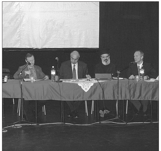
Στιγμιότυπο ἀπὸ τὴν Ἡμερίδα τῆς Ἱ. Μ. Νεαπόλεως καὶ Σταυρουπόλεως μὲ θέμα «Ἑθελοντισμὸς - Στάση ζωῆς»