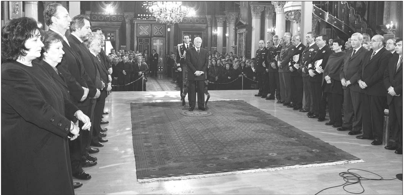
Ὁ Πρόεδρος τῆς Δημοκρατίας κ. Κάρολος Παπούλιας καὶ ἐκπρόσωποι τῆς πολιτικῆς ἡγεσίας τῆς Ἑλλάδος κατὰ τὴν Κυριακὴ τῆς Ὁρθοδοξίας.

Στὴν ἀντιφώνησή του ὁ Μακαριώτατος, συμφώνησε μὲ τὸν Πρόεδρο τῆς Δημοκρατίας τονίζοντας πὼς τόσο ὁ ἴδιος ὅσο καὶ ἡ Ἑλλαδικὴ Ἐκκλησία ἀλλὰ καὶ ἐν γένει ἡ Ὁρθοδοξία, συμμερίζονται τὶς ἴδιες ἀνησυχίες γιὰ τὴν διασφάλιση τῆς εἰρήνης, καὶ ἐπίσημανε τὴν ἀναγκαιότητα τῶν Διαχριστιανικῶν καὶ Διαθρησκευτικῶν Διαλόγων: “ Ὁ 21ος αἰ. γιὰ τὴν Ἐκκλησία ἐπικεντρώνεται στὴν διδασκαλία πρὸς τὸν ἄνθρωπο καὶ στὰ πλαίσια αὐτὰ ἐντάσσεται ἡ προσπάθειά μας γιὰ τὴν διατήρηση τῆς εἰρήνης καὶ τῆς δικαιοσύνης ”, εἶπε ὁ Μακαριώτατος καὶ πρόσθεσε μὲ ἔμφαση: “ Δὲν νοεῖται νὰ γίνονται πόλεμοι ἐν ὀνόματι τῶν θρησκευτικῶν καὶ νὰ ὑπάρχουν θρησκευεῖς ποὺ νὰ ὑπονομεύουν τὴν εἰρήνη. Εἴμαστε πεπεισμένοι, –συνέχισε– ὅτι ὁ ρόλος τῆς Ἐκκλησίας εἶναι κοινωνικός, ὑπὲρ τῆς ἀγάπης, τῆς ἐλευθερίας, καὶ τῆς ἰσότητας. Μὲ τὰ “ἀνοίγματα” μας πρὸς τὴν Ρωμαιοκαθολικὴ Ἐκκλησία, τοὺς Προτεστάντες, τὰ Βαλκάνια, καὶ τὴν Εὐρωπαϊκὴ Ἐνωση, ἐπιθυμοῦμε νὰ συμβάλλουμε στὴν εἰρήνη καὶ στὴ δικαιοσύνη. Οἱ Διαθρησκευτικοὶ διάλογοι εἶναι χρήσιμοι στὶς μέρες μας, γιὰτὴν ἀναζητοῦν καὶ ἀνευρίσκουν τὸ “modus vivendi” μεταξὺ ὅλων τῶν ἀνθρώπων διαφορετικῶν θρησκευτικῶν καὶ πολιτισμῶν, ὑπὸ τὴν αἰγίδα τῶν θρησκευτικῶν. Δὲν λησμονοῦμε ὅτι σὲ ὁλόκληρο τὸν κόσμο διαβιώνουν εἴτε ὁμογενεῖς μας Ὁρθόδοξοι Χριστιανοί, εἴτε Χριστιανοὶ ἄλλων δογματικῶν καὶ χάριν καὶ αὐτῶν ὅπως καὶ τῶν εἰς τὴν πατρίδα μας διαβιούντων μεταναστῶν ποὺ δὲν ἀνήκουν στὴν Ὁρθόδοξη