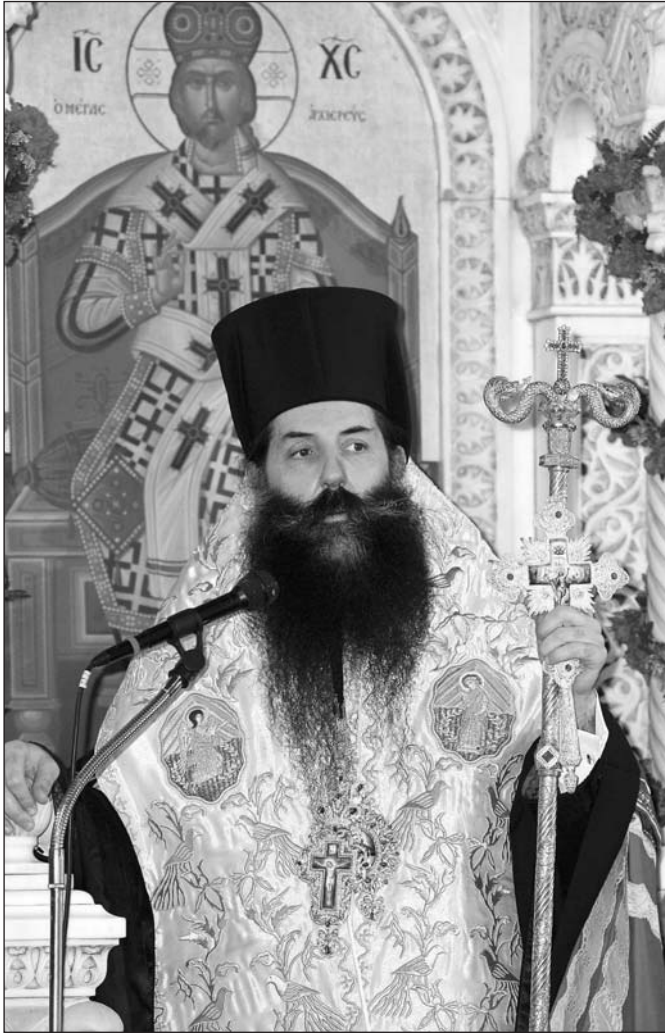
Ὁ Σεβ. Μητροπολίτης Πειραιῶς κ. Σεραφεῖμ

ἀγαθὰ ὑπὲρ ἐμοῦ εἰργάσθητε. Μὲ περιεβάλατε μὲ πολλὴν ἀγάπην καὶ ἐμπιστοσύνην. Μοῦ ἐνεπιστεύθητε τὴν ὑψηλὴν, ἄκρως ἐμπιστευτικὴν καὶ πολυεύθυνον θέσιν τοῦ Ἀρχιεπισκοπείου τῆς Ἱερᾶς Συνόδου τῆς Ἐκκλησίας τῆς Ἑλλάδος. Μὲ κατεστήσατε οὕτω ἄμεσον συνεργάτην σας. Πλησίον σας ἐδιδάχθην πλεῖστα καὶ σπουδαῖα περὶ τὴν ἐκκλησιαστικὴν διοίκησιν. Σὰς ἐγνώρισα χαλκέντερον, ἀκάματον, ἀγρυπνον ἐπὶ τῶν ἱερῶν ἐπάλλεων. Μὲ ἐνεπνεύσατε καὶ ἀνεργησίσατε τὸν ἱερόν μου ἐνθουσιασμόν πρὸς ἐργασίαν ἐν τῷ Εὐαγγελίῳ. Ἔχετε τὴν ἰσόβιον εὐγνωμοσύνην μου καὶ τὸν σεβασμόν μου. Εἰς κάθε θεοφιλῆ πρωτοβουλίαν σας θὰ εὐρίσκωμαι δίπλα σας, ὅπως πρόθυμος πάντοτε συνεργάτης καὶ συμμαχητὴς διὰ τὴν εὐκλειαν τῆς Ἐκκλησίας, τὴν προαγωγὴν τῶν τιμίων συμφερόντων Της καὶ τὴν δόξαν τοῦ Ὄνόματος τοῦ Θεοῦ.