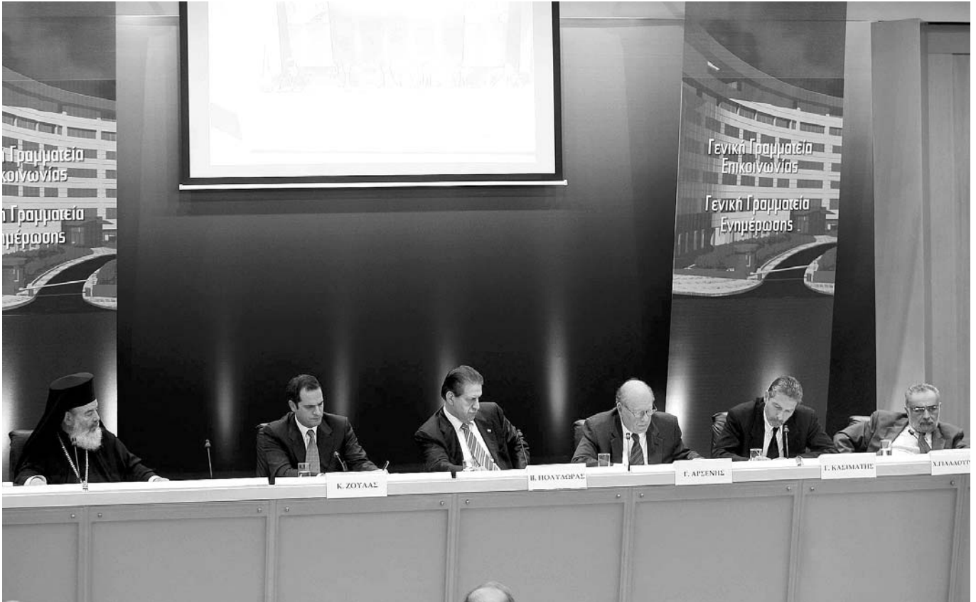
‘Ο Μακαριώτατος Αρχιεπίσκοπος Άθηνων και πάσης Έλλάδος κ. Χριστόδουλος στην εκδήλωση που έλαβε χώραν στο νέο κτήριο της Γενικής Γραμματείας Έπικοινωνιών και Ένημέρωσης για την επίκαιρη συμπλήρωση 50 χρόνων από την ίδρυση των Ευρωπαϊκών Κοινοτήτων.

βουλίου ότι είναι αναγκαία ή υπερψήφιση του Ευρωπαϊκού Συντάγματος. ‘Ο κ. Κασιμάτης ανέφερε ότι ο πιθανότερος υποψήφιος για την θέση του Προέδρου του Ευρωπαϊκού Κοινοβουλίου που θα εκλεγεί στις αρχές του 2007 είναι ο Γερμανός Χριστιανοδημοκράτης κ. Χανς Πέτερινγκ, ο οποίος ήδη ανακοίνωσε ότι μία από τις πρώτες κινήσεις του θα είναι η συζήτηση με τους Έκπροσώπους των Ευρωπαϊκών Έκκλησιών με θέμα τα ζωτικά προβλήματα που άφορούν τους Ευρωπαίους.