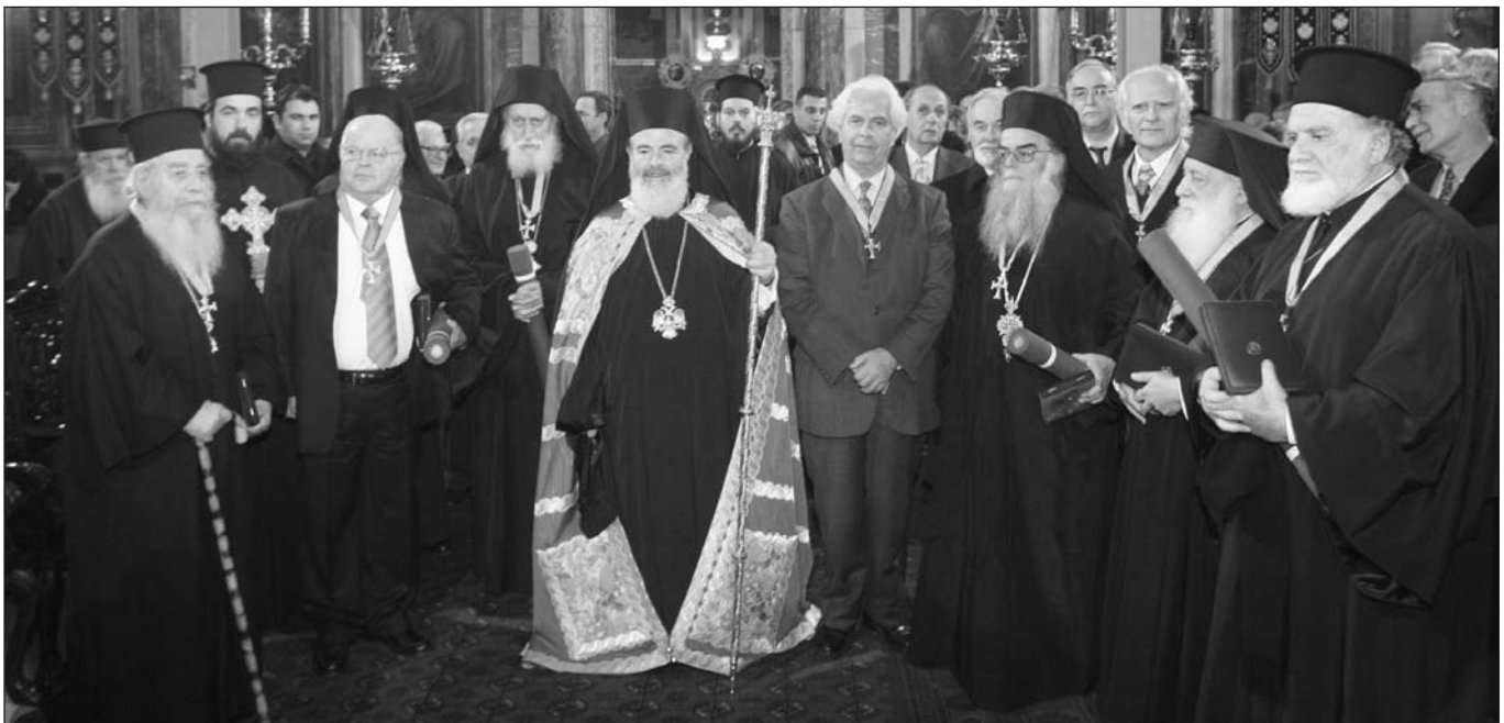
Ὁ Μακαριώτατος Ἀρχιεπίσκοπος Ἀθηνῶν καὶ πάσης Ἑλλάδος περιστοιχιζόμενος ἀπὸ τοὺς βραβευθέντες ἱερεῖς καὶ Καθηγητὲς κατὰ τὸν Ἑσπερινὸ τῆς ἐορτῆς τοῦ Μ. Φωτίου στὸν Καθεδρικό Ναὸ Ἀθηνῶν (5.2.2006)

Τέλος, ὁ Προκαθήμενος τῆς Ἑλλαδικῆς Ἐκκλησίας, ἀναφερόμενος στὶς σχέσεις τῆς Διοίκησης τῶν Θεολογικῶν Πανεπιστημιακῶν Σχολῶν μὲ τὴν ποιμένουσα Ἐκκλησία, κάλεσε τὰ μέλη τῆς Θεολογικῆς Ἀκαδημαϊκῆς Κοινότητας νὰ κάνουν μία νέα ἀρχή. Τὴν πρόταση τοῦ Μακαριωτάτου ἐπικρότησαν καὶ ἀπεδέχθησαν καὶ οἱ