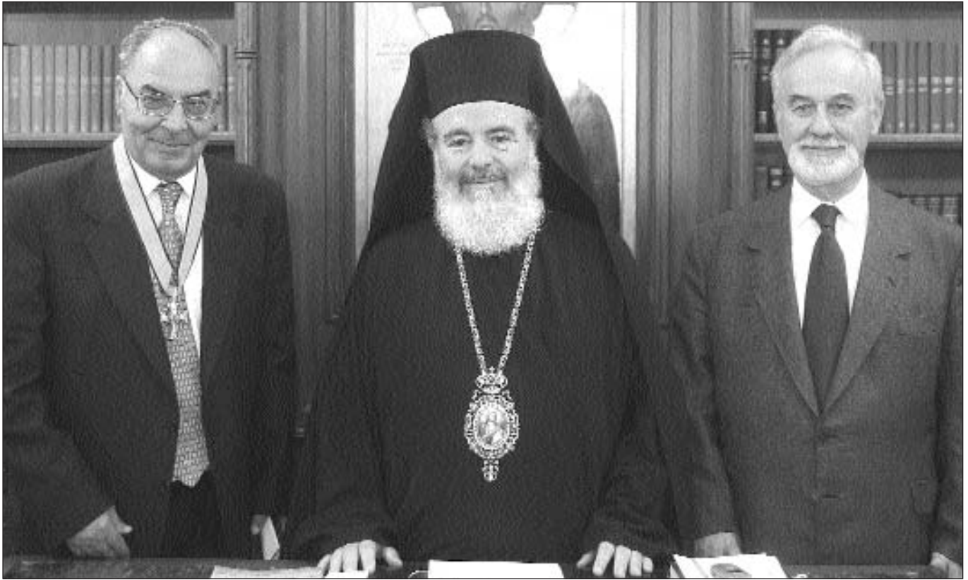
Ὁ Μακαριώτατος Ἀρχιεπίσκοπος Ἀθηνῶν καὶ πάσης Ἑλλάδος κ. Χριστόδουλος μετὸν βραβευθέντα Καθηγητὴ κ. Βλάσιο Φειδᾶ καὶ τὸν Καθηγητὴ κ. Σπυριδῶνα Κοντογιάννη.

σπάθειας ὅλων τῶν πολεμίων της γιὰ τὴν ἀποδυνάμωση ἢ καὶ τὴν κατάργηση τῆς σχέσεως αὐτῆς μετὰ κάθε πρόσφορο ἢ ἀθέμιτο μέσο. Ὡς πρόσφορο μέσο χρησιμοποιοῦν τὸν διεθνῶς ἀνεγνωρισμένο κώδικα τῶν ἀνθρωπίνων δικαιωμάτων καὶ ὡς ἀθέμιτο τρόπο χρησιμοποιοῦν τὴ χρηστικὴ ἢ καὶ καταχρηστικὴ ἄσκηση τῆς νομοθετικῆς ἐξουσίας γιὰ τὴν προστασία δῆθεν τῶν ἀτομικῶν δικαιωμάτων τῶν πολιτῶν, στὰ ὁποῖα ἐντάσσονται καὶ ὅλες οἱ πτυχές τῆς ἀρχῆς τῆς θρησκευτικῆς ἐλευθερίας, γιὰ νὰ ἐξουδετερωθῇ ὁ θεσμικὸς ρόλος τῆς Ἐκκλησίας στὴ λειτουργία τῆς λεγόμενης κοινωνίας τῶν πολιτῶν.