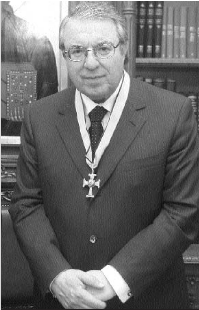
Ὁ βραβευθεὶς, Πρύτανης τοῦ Πανεπιστημίου Ἀθηνῶν κ. Γεώργιος Μπαμπινιώτης

νικοῦ Συμβουλίου τῶν Ἀνωτάτων Ἐκκλησιαστικῶν Ἀκαδημιῶν –πιστεύω ὅτι πρέπει νὰ στρατευθοῦμε γιὰ μορφωμένους ἱερεῖς– καὶ τέλος γιὰ τὴν Ὁμολογία Πίστεως, τὴν ὁποία σὲ πάρα πολλές εὐκαιρίες, σὲ ἀνύποπτο χρόνο, πάλι ἀπὸ μέσα μου ἔχω δημόσια κάνει.